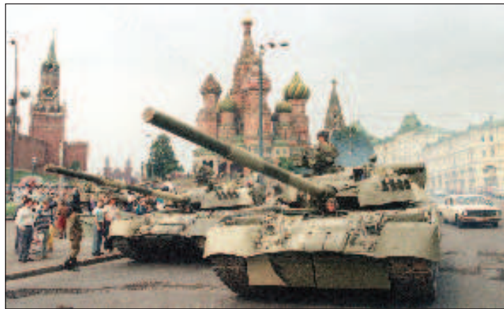
19 августа, утром. Танки на Красной площади

Главная вина и беда жителей СССР-1991 - в неверии в собственные ценности, в нежелании за них биться. Да, немалую роль в этом сыграло огромное разочарование в догматике коммунизма и усталость от ее навязывания сверху. Однако вместе с догмами советские русские люди оставили без защиты те существенные социальные достижения, которые наиболее полно в отечественной истории выразили стремле-