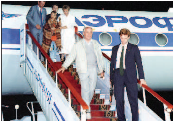
Вечером 22 августа Горбачев прилетает из Фороса

гизме событий августа - декабря 1991 года, этой крупнейшей геополитической катастрофы века, сейчас, по прошествии 25 лет, после обновления российского государства, можно признать, что есть великое провидение в том, что эта трагедия произошла, а попытка ГКЧП закончилась провалом.