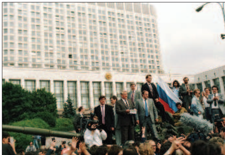
19 августа, полдень. Митинг у Белого дома. С башни танка Ельцин зачитывает указ об объявлении ГКЧП вне закона

Советские лидеры исчерпали себя и были похожи на сдутые куклы, и дело не только в возрасте. Нынешнее российское руководство демонстрирует, как можно энергично и эффективно действовать на мировой арене