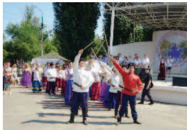
Масштабный праздник казачьей культуры посетили порядка десяти тысяч жителей и гостей Саратовской области