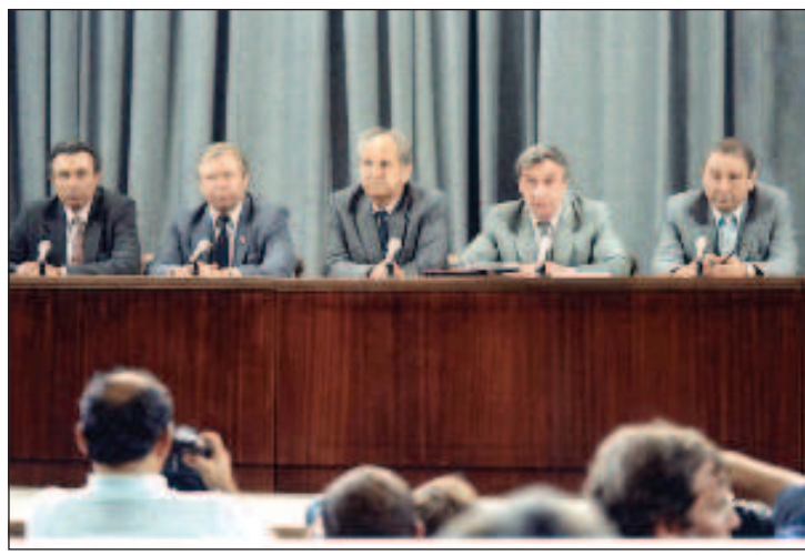
Вечер 19 августа. Александр Тизяков, Василий Стародубцев, Борис Пуго, Геннадий Янаев и Олег Бакланов (слева направо) проводят пресс-конференцию ГКЧП