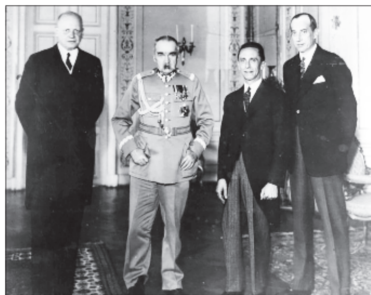
Пилсудский и Геббельс, 15 июня 1934 г., после подписания договора

защиту жизнь и имущество населения Западной Украины и Западной Белоруссии".