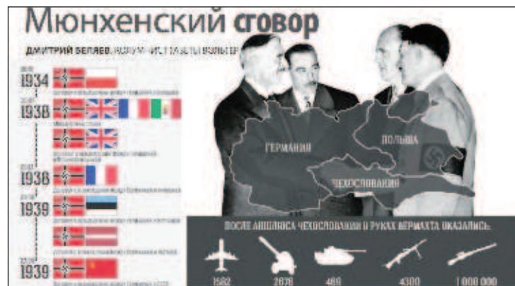
Польша была первая европейская страна, подписавшая договор о ненападении с Гитлером

После подписания документа французский политик Поль Рейно писал: "Сложилось впечатление, что отныне германская политика будет направлена на борьбу с большевизмом. Рейх дал понять о наличии у него стремления к экспансии в восточном направлении..." Также договоры о ненападении имели с Гитлером Литва, Дания, Эстония, Латвия. Считать ли все эти страны союзниками Гитлера? Зачем