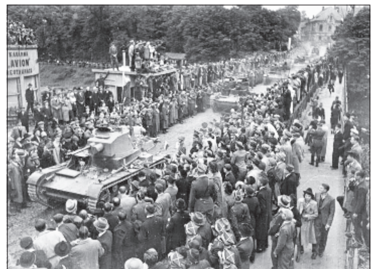
Польские танки входят в Чехословакию после подписания Мюнхенского сговора от 1938 г.

Наконец, есть еще довод "морального права", относимый обычно к демократиям западного типа. Если бы Польша была поистине демократической европейской