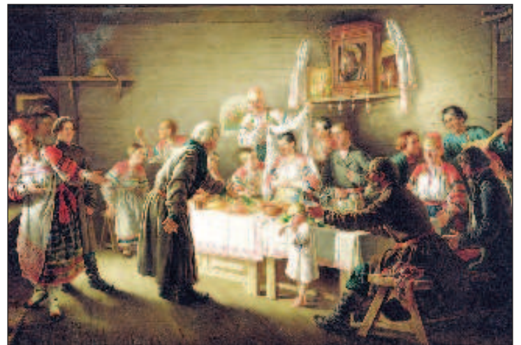
Смотрины в деревне в Южной России

Царь Михаил Федорович изъявил желание жениться, когда ему было 20 лет. В суженые бояре рекомендовали дочь бедных коломенских дворян Марию Хлопову. Девушка ему очень понравилась, и дело шло к венцу. Но внезапно она заболела. Конкретно - "рвало и ломало нутро и опухла была. А после была ей блевота". Причину установили быстро: банальное и неопасное пищевое отравление. Пирожные и сладости из взбитых сливок и сметаны. Но было поздно. "Порченную" невесту и всю ее родню сослали в Тобольск. И только потом выяснилось, что негодную, просроченную сметану девушке подсунили с подачи матери