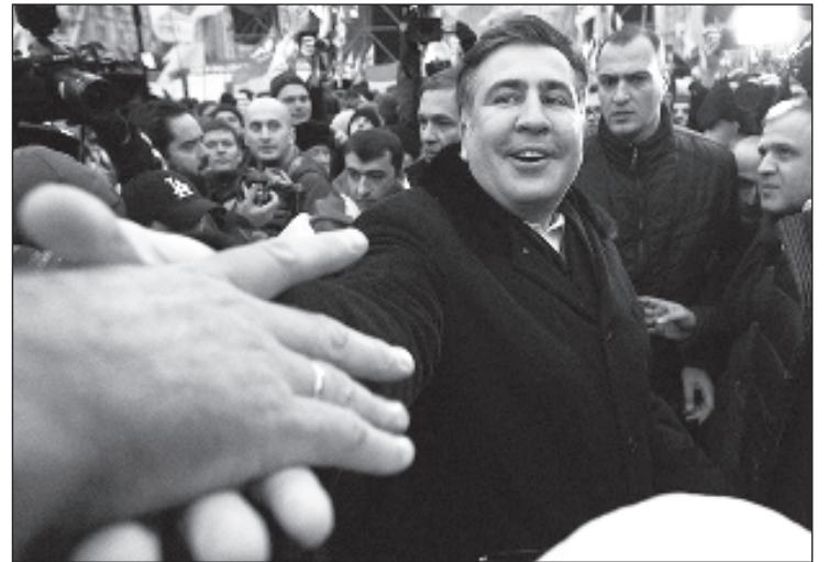
Саакашвили на Евромайдане

Решение Саакашвили оказалось полной неожиданностью для всех и судить об истинных мотивах бывшего президента Грузии можно будет только по дальнейшим событиям. Однако можно вспомнить, например, как с поста главы Днепрпетровской области убрали олигарха Игоря Коломойского - тогда к