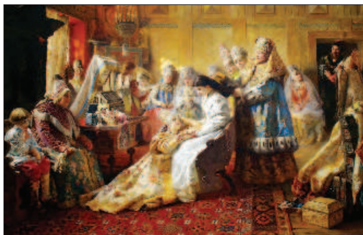
Под венец - конец молодости

же наличие ребенка иногда считалось плюсом, своего рода печатью "годен", поскольку подтверждало, что с основной функцией жены - рожать детей - невеста уж точно справится.