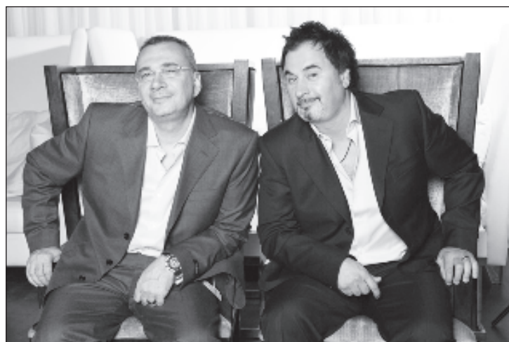
Константин и Валерий Меладзе

- О том, что вот такой лексикон людей сегодня утешает и отвлекает от мрачных мыслей. Просто, весело, бесшабашно! Не струны души бередить, а пуститься в загул. Мне это не близко. Но песни "Ленинграда" сделаны умно, стильно и талантливо. Очень тонко многие вещи подмечены. Мне кажется, это основная альтернатива тому, что показыва-