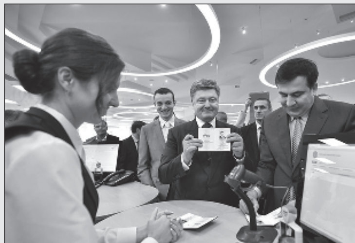
Петр Порошенко (в центре) и Михаил Саакашвили (справа) во время церемонии открытия Центра обслуживания граждан