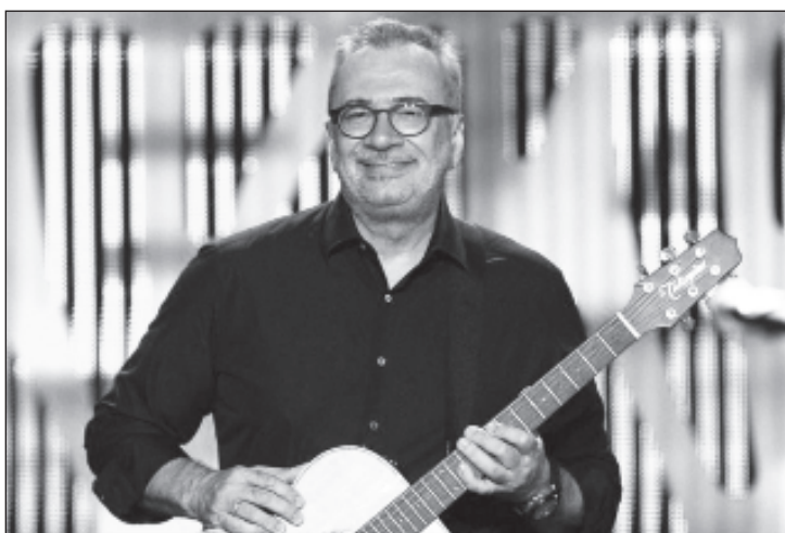
Константин Меладзе на Международном конкурсе молодых исполнителей популярной музыки "Новая Волна 2016" в Сочи

- Безусловно. Во-первых, я уже 30 лет этим занимаюсь. А во-вторых, музыка - это дело молодых. Поэтому столь интенсивно забивать эфир собственной музыкой у меня уже не получается. Лет 10, даже 5 назад я много писал и частенько, знаете, если перескакивал с одной радиостанции на другую, то практически постоянно наткнулся на какую-то свою песню. Сейчас, слава богу, уже не так. Сейчас у меня такой период, когда я больше размышляю и думаю над тем, что буду писать. То есть больше думаю, чем делаю.