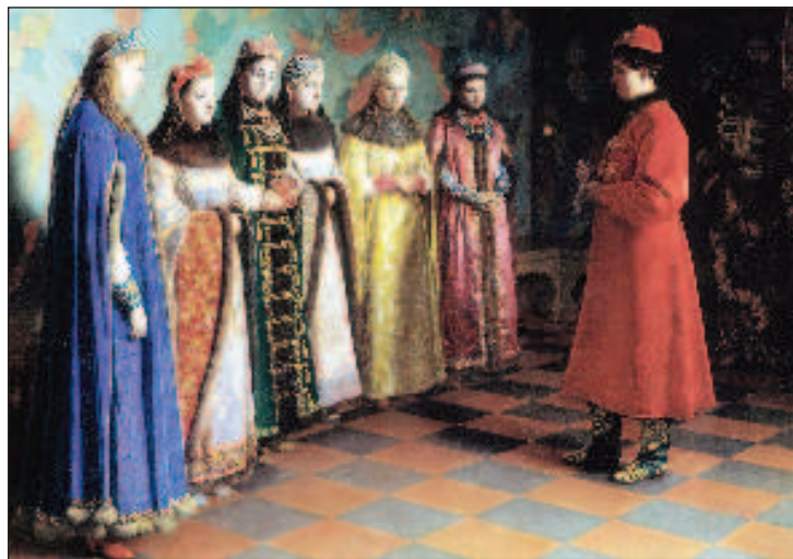
Как царь Алексей Тишайший завел вторую жену