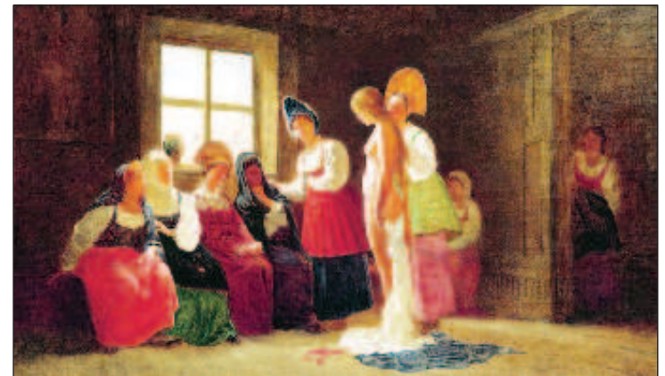
Невесту отводили в баню и там будущая свекровь и свахи осматривали ее

жениха. Ее не устраивала кандидатура - на сына у мамы были свои виды.