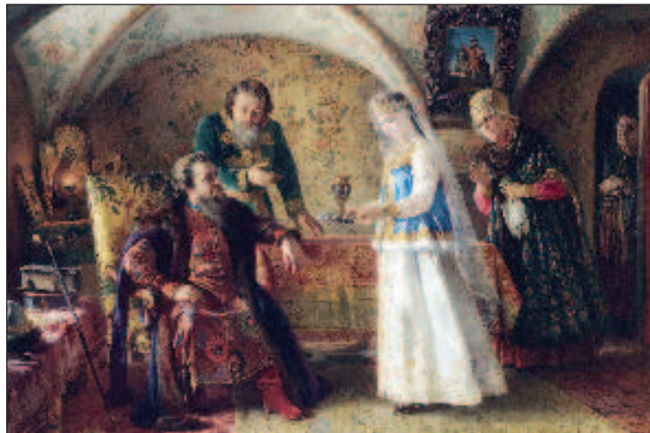
Смотрины допетровской поры

А все потому, что еще через две недели обычно началось самое ответственное действие. Невесту отводили в баню - и там уже будущая свекровь в сопровождении свахи или повивальной бабки осматривала ее тайно. Девственность или ее отсутствие в общем-то волновали мало. Более того, да-