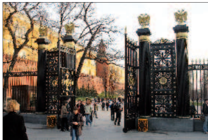
Ювелирная чугунная решетка Александровского сада