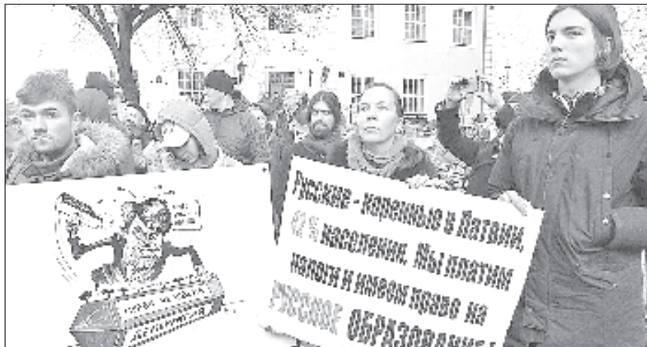
Протест против ликвидации обучения на русском языке в Латвии

В мае 2017 года сейм Латвии принял в первом чтении и передал на рассмотрение комиссии законопроект, который предполагает увеличение штрафов за нарушение закона о государственном (латышском) языке до 10 тысяч евро в отдельных случаях, в числе которых необоснованное использование других языков. Авторы поправки заявили, что штрафы поспособствуют росту экономики.