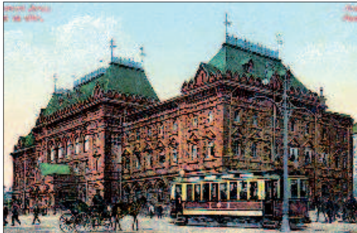
Так в конце XIX в. выглядели Воскресенская площадь (сегодня площадь Революции) и здание Городской Думы, построено по инициативе Алексеева. Позже в нем разместили Музей Ленина, а сегодня - Исторический музей

Его энергии и настойчивости Москва обязана осуществлением крупнейших и необходимейших для огром-