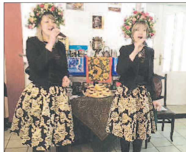
Песни в подарок к чаю от гостей из Благоевграда дуэта "Алёнушки"

нам привезли гости из Дупницы и приготовили хозяева. Каждый гость получил небольшой сувенир в виде маленькой матрешки (для болгарских друзей), остальные - чашку с логотипом фестиваля или коробочку полезного чая.