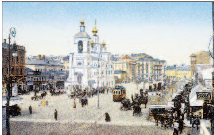
Охотный ряд в те времена. На месте церкви Параскевы Пятницы сегодня стоит здание Государственной Думы

ного города предприятий - водопровода и канализации. До него об этих предприятиях только говорили, но так как это были сложные и трудные многомиллионные сооружения, браться за их осуществление боялись. Устройство водопровода было проведено Алексеевым с обычной энергией и быстротой. Были произведены разведки подземных вод в окрестностях Мытищ, проложены магистрали. В Москве выстроены две водонапорные башни за Крестовой заставой, проложена разветвленная сеть труб. Отныне каждый дом Белокаменной мог присоединиться к водопроводной сети.