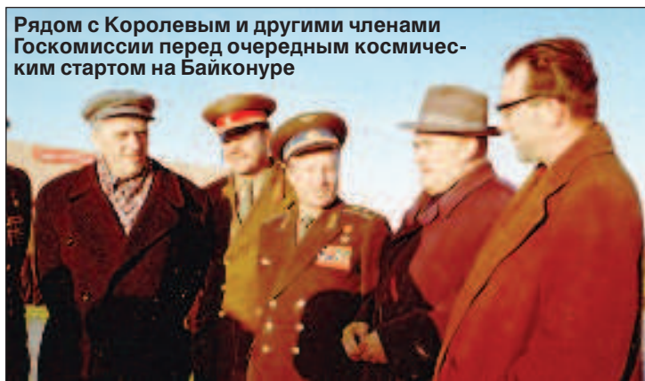
Рядом с Королевым и другими членами Госкомиссии перед очередным космическим стартом на Байконуре

ную дивизию Калининского фронта. В 1943 г. Каманин получил погону генерала и стал командиром штурмового авиакорпуса. "Илы" генерала Каманина громили танковые соединения и укрепленные пункты гитлеровцев.