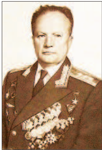
Генерал-полковник авиации Каманин

Каманина направили учиться в Военно-воздушную инженерную академию им. Н.Е. Жуковского, которую он