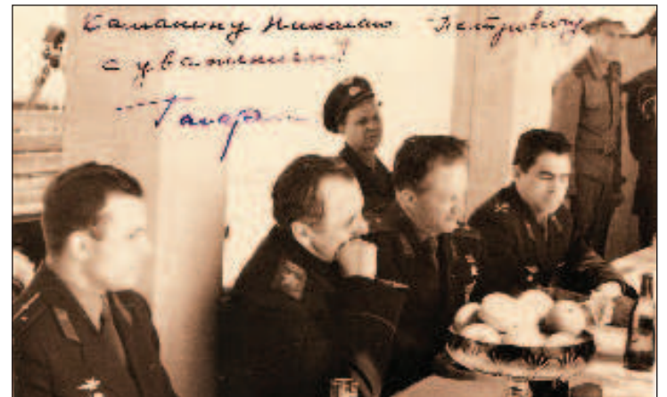
В семье космонавтов (третий слева за столом). Фотография с надписью, подарена Юрием Гагариным

Когда в 1960 г. был создан первый отряд советских космонавтов, состоявший из военных летчиков, отбор и подготовка кандидатов легли на