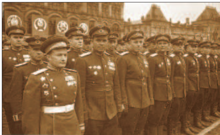
На Параде Победы 24 июня 1945 г. (первый слева)

Конец 1960-х - начало 1970-х годов были не лучшим вре-