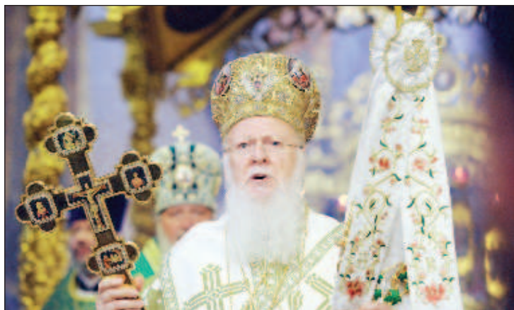
Патриарх Константинопольский Варфоломей I

"Этот путь может очень быстро завершиться и измениться на путь диалога. В этом смысле это расстояние измеряется одним фактором: это осознание ошибочности своих действий и решений Константинопольским патриархатом, его синодом, и принесение извинений за те действия, которые уже нанесли существенный ущерб и всему мировому православию, и бу-