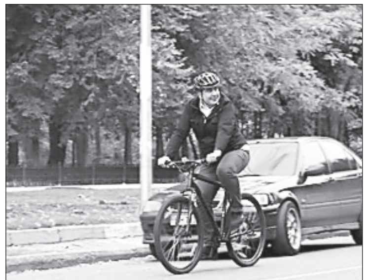
Михаил Саакашвили на велосипеде

Касаясь темы Украины, политик признался, что часто вспоминает эту страну. "Украина сейчас - во-первых,