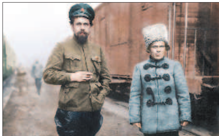
Революционеры Дыбенко и Махно, Украина, 1918 год

ского строя, чтобы вступить самим и ввести других наших братьев на путь нового строя. Организуем его на началах свободной общественности, содержание которой позволит всему не эксплуатирующему чужого труда населению свободно и независимо от государства и его чиновников, хотя бы и красных, строить всю свою социально-общественную жизнь совершенно самостоятельно у себя на местах, в своей сре-