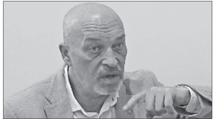
Заместитель министра по вопросам временно оккупированных территорий Украины Георгий Тука

Заявления о строительстве украинской военно-морской базы на Азовском море не соответствуют возможностям страны, заявил в эфире телеканала „Прямой“ заместитель министра по вопросам временно оккупированных территорий Украины Георгий Тука, передает РИА Новости.