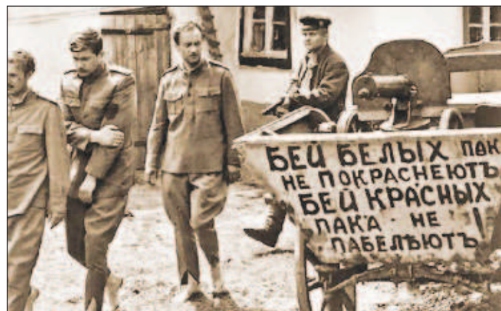
Пленные белые офицеры проходят мимо легендарной тачанки Махно, на которой написано: „Бей белых пока не покраснеют, бей красных пока не побелеют!“