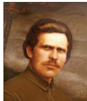
Нестор Иванович Махно

Конечно, большевики были против анархизма Махно и самостоятельности его крестьянской республики. К тому же махновцы требовали от большевистской власти невозможного: "социализации" земли, фабрик и заводов, отмены продрозверстки, свободы слова, печати и собраний всем "левым партиям и группам", отказа от диктатуры коммунистической партии. И вообще, анархисты пользовались в те годы большой популярностью. С их мнением и силой приходилось считаться не только на Украине, но и в Москве, и в Петрограде. Известно, что большевики во время Гражданской войны откровенно заигрывали с анархистами, искали компромиссы. Лишь