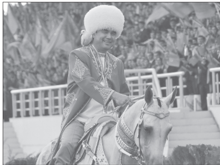
Президент страны Гурбангулы Бердымухаммедов

Причин критической ситуации несколько. Тяжким бременем для бюджета Туркменистана стала страсть руководства страны к масш-