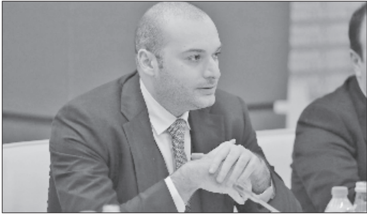
Премьер-министр Грузии Мамука Бахтадзе

Правительство Грузии аннулирует долги более чем 600 тысяч граждан страны накануне Нового года, заявил премьер-министр Мамука Бахтадзе, сообщает агентство „Спутник Грузия“.