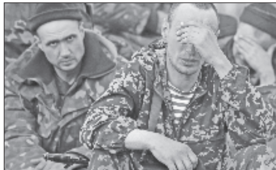
У участников „антитеррористической операции“ Украины в Донбассе нет мотивов воевать и они очень часто впадают в депрессию

Бывший замглавы Генштаба ВСУ Игорь Романенко считает, что российские власти могут закрыть Азовское море для украинских судов, из-за чего возрастет вероятность „большой войны“ между странами. Об этом он рассказал в интервью изданию „Апостроф“.