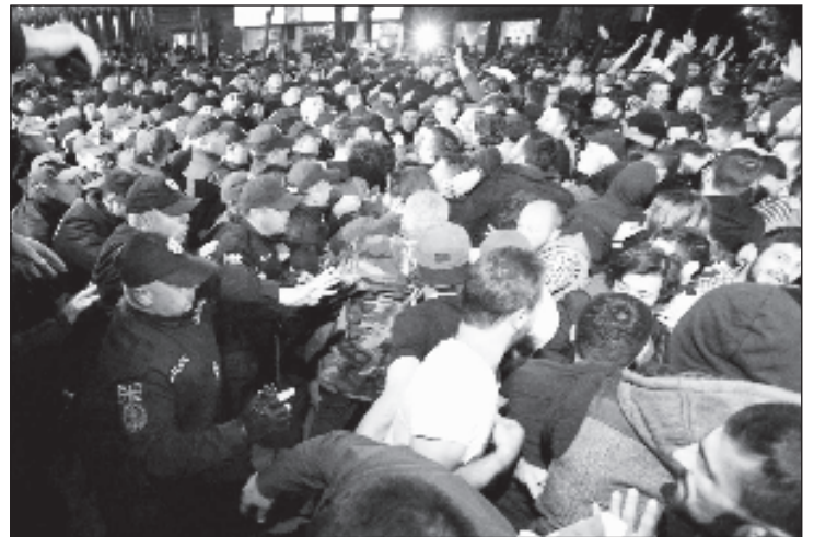
Митинг оппозиции, несогласной с итогами президентских выборов

Особняк на улице Антонели был построен в начале XX века на месте дворца, где раньше жили Орбелиани, однако не имеет отношения к княжеской семье. Президентскую резиденцию там планировалось разместить еще в 2015 году, но тогдашний глава государства Георгий Маргвелашвили отказался покинуть Авлабарский комплекс, построенный при Саакашвили, что вызвало критику со стороны правящей партии "Грузинская мечта".