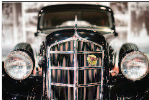
Рузвельт и Черчилль в Тегеране передвигались на автомобилях из Гаража особого назначения Кремля

воров. И, наконец, это была война с неким Гитлером, которого, конечно же, Запад создал, как "дьявола для черной работы" против Советского Союза, но нарвался на него с такой силой, что ужаснулся", - утверждает эксперт. При этом, четвертым важным фактором Тегеранской конференции стал подход СССР и Сталина к ведению переговоров, который был "умным и одновременно гибким". Сталин очень умно вел переговоры о втором фронте, а также гениально выстроил отношения с Ираном, переиграв там всех.