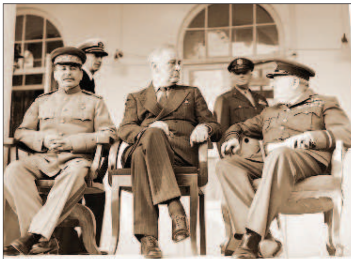
"Большая тройка" в Тегеране, ноябрь 1943 г.

Но помимо крупных личностей Сталина и Рузвельта, принимавших участие в конференции был немало важным, а в чем-то даже решающий фактор двух совершенно разных систем: капиталистического Запада и социалистического СССР. Причем, эта разность систем не только не мешала договариваться, вопреки расхожему мнению, но и помогала договориваться. "Именно баланс двух систем и создавал пространство для дого-