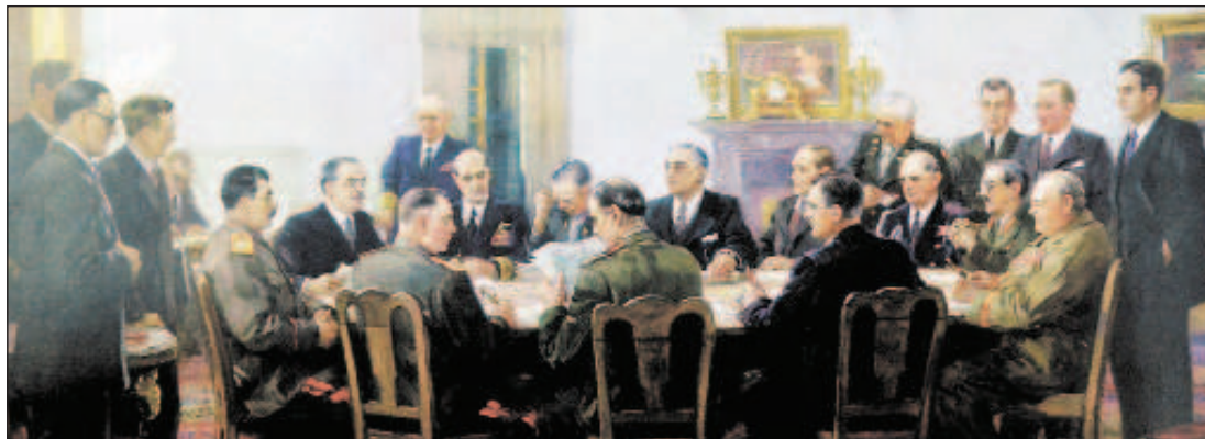
Заседание Тегеранской конференции

форовых статуэток на тему сказок, в том числе сказки Пушкина о золотой рыбке. Вряд ли Черчилль был большим знатоком творчества Пушкина, но специалисты по России, может быть, ему объяснили такой достаточно прозрачный намек на разбитое корыто. До последних дней войны Черчилль прилагал усилия, чтобы остановить наступление Красной армии, но его планы провалились. СССР после войны расширил свое геополитическое