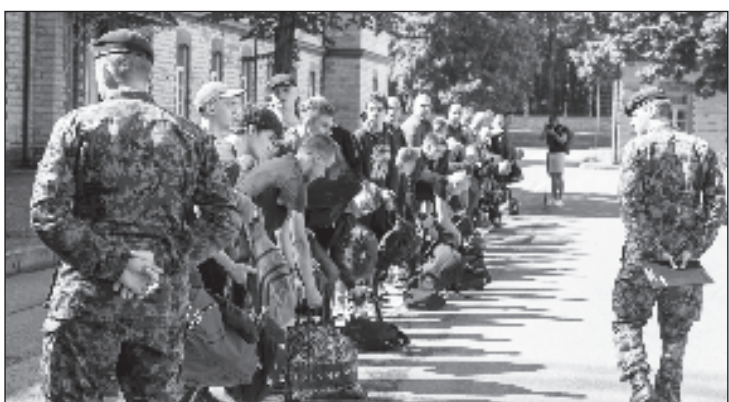
Призывники в Силах обороны Эстонии не очень хорошо знают эстонский язык

Ежегодно службы в Силах обороны Эстонии проходят около трех тысяч человек, с 2013 года в армию принимают добровольцев-девушек. Срок обязательной службы варьируется от 8 до 11 месяцев.