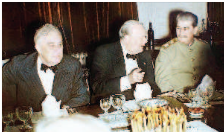
Званный обед в британском посольстве в Тегеране по случаю дня рождения Черчилля