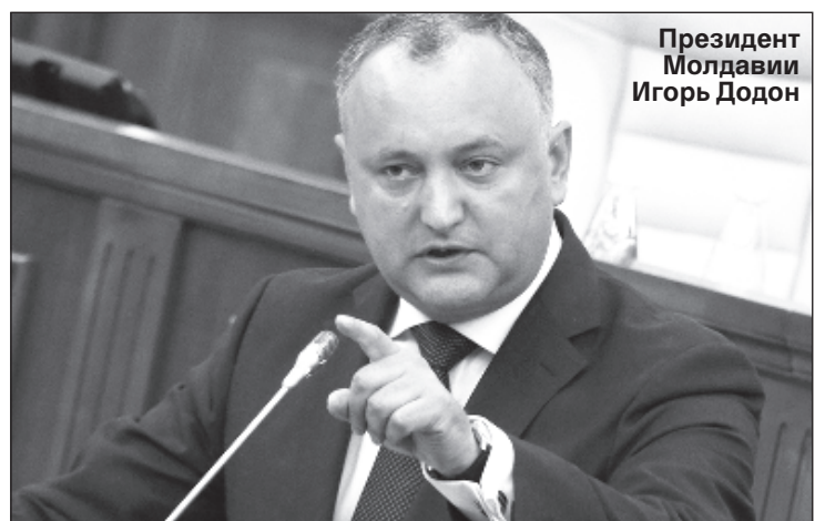
Президент Молдавии Игорь Додон

Кроме того, Канду заявил, что считает Додона незаконным президентом, даже если тот обладает легитимностью. Спикер парламента попросил подготовить информационную записку о том, какова процедура и как составляется обращение в Конституционный суд по поводу отставки главы государства. "Парламент может преподнести сюрприз президенту еще до новогодних праздников", - добавил он.