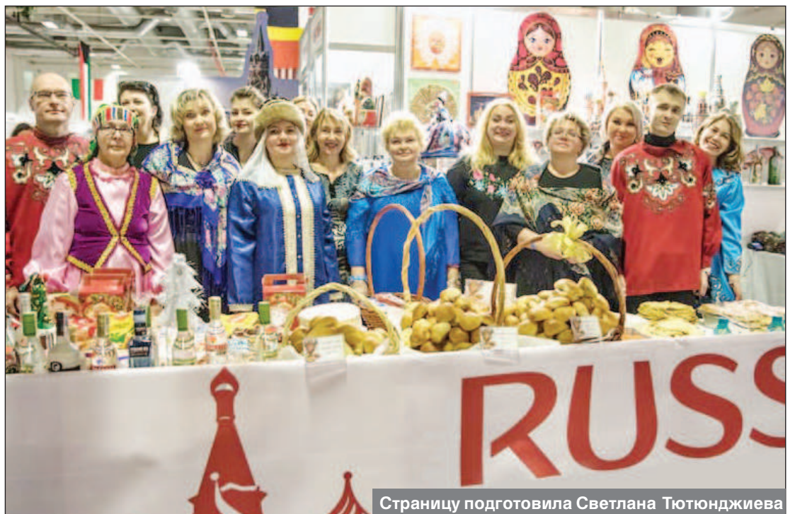
Страницу подготовила Светлана Тютюнджиева

3 декабря 2018 года в Софии состоялся 24-й ежегодный благотворительный Базар, организованный Международным женским клубом. Многочисленные посетители Базара отметили высокий уровень русского участия в событии: Дед Мороз и Снегурочка с коробейниками угощали всех подходящих к русскому стенду, детям предлагали интересные занятия в детском уголке, взрослым - горячительные напитки, а концертная программа собрала всех, кто находился в Экспо-центре. В итоге, благодаря усилиям сотрудников посольства, спонсоров и партнеров было собрано свыше 5 тысяч евро для благотворительных инициатив.