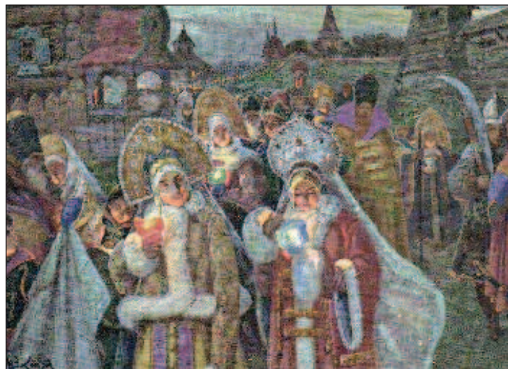
Страстной четверг, картина Василия Эшкичевича

на Страстной неделе в древности относились к пасхальному циклу - цветной Троицы (Троица цветная, или Пятидесятница, - богослужебная книга, содержащая песнопения от Недели Пасхи до Недели Всех святых, то есть следующего воскресенья после Пятидесятницы; название происходит от праздника Входа Господня во Иерусалим - Недели ваий, в переводе - "Цветная Неделя". - Прим. ред.). Собственно, само число 40 - чисто условное, поэтому, как бы вы