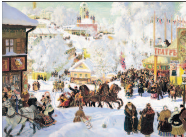
Масленица, картина Бориса Кустодиева