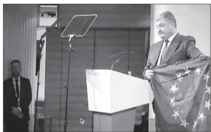
Европеец Порошенко на Мюнхенской конференции по безопасности

Президент Украины Петр Порошенко обвинил Россию в попытках "разрушить демократии" и заявил, что российский флаг не должен развеиваться нигде на планете, сообщает украинский телеканал ТСН.