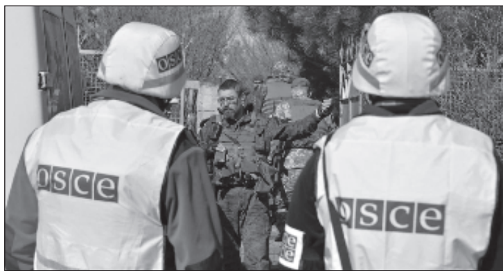
Участники в миссии ОБСЕ в Донбассе

"Несмотря на эту ситуацию, мы организуем участие для голосования в Киеве при посольстве, на территории генеральных консульств в Харькове, Одессе и Львове. Чтобы обеспечить безопасность, в том числе физическую, граждан России, которые захотят прийти и проголосовать, мы не только будем вести диалог со Службой безопасности и МВД Украины, но и обрати-