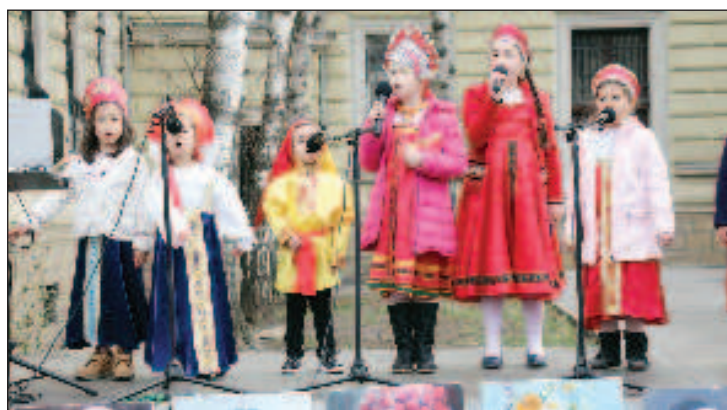
Вокалисты из детского состава "До-ми-солька"

Совпадение по времени проведения не помешало тому, чтобы и в Российском культурно-информационном центре собралось столь же много народу. После концерта перешли к русским на-