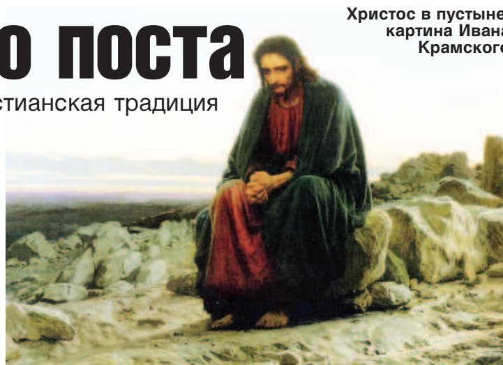
Христос в пустыне, картина Ивана Крамского

на Страстной неделе в древности относились к пасхальному циклу - цветной Троицы (Троица цветная, или Пятидесятница, - богослужебная книга, содержащая песнопения от Недели Пасхи до Недели Всех святых, то есть следующего воскресенья после Пятидесятницы; название происходит от праздника Входа Господня во Иерусалим - Недели ваий, в переводе - "Цветная Неделя". - Прим. ред.). Собственно, само число 40 - чисто условное, поэтому, как бы вы