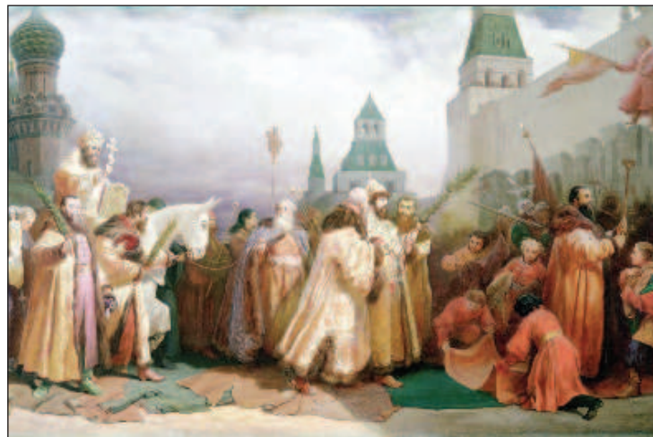
Вербное Воскресенье в Москве в царствование Алексея Михайловича, художник Вячеслав Шварц

В сознании русского православного человека сложилось определенное понимание поста именно как Четыредесятницы, во время которой следует воздерживаться не только от употребления ряда продуктов, но и от греховных помыслов и деяний. Только вот ровно 40 дней пост не длится, ведь есть еще Страстная седмица. Эти дни когда-то относились не к посту, а к Пасхе - в древности она была частью пасхального праздника. Это происходило потому, что в те времена было два представления о Пасхе: как о Пасхе страданий (Пасха крестная) и о Пасхе радости (Пасха воскресения). Поэтому по крайней мере четверг, пятница и суббота