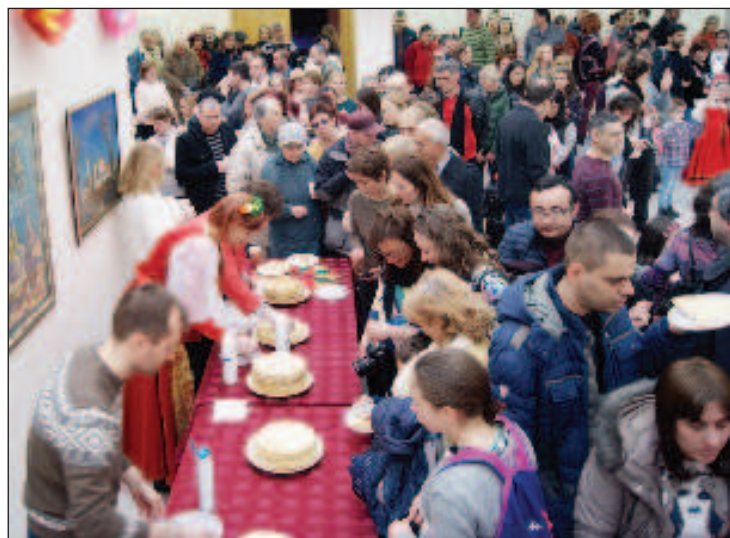
И в РКЦ блинами угощали всех гостей

Совпадение по времени проведения не помешало тому, чтобы и в Российском культурно-информационном центре собралось столь же много народу. После концерта перешли к русским на-