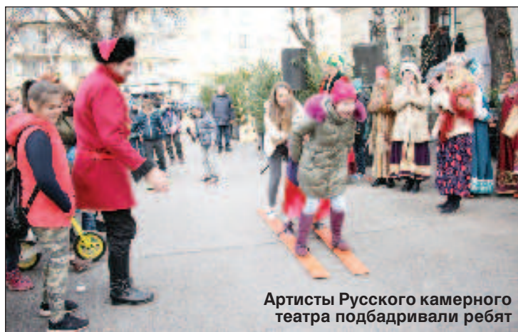
Артисты Русского камерного театра подбадривали ребят