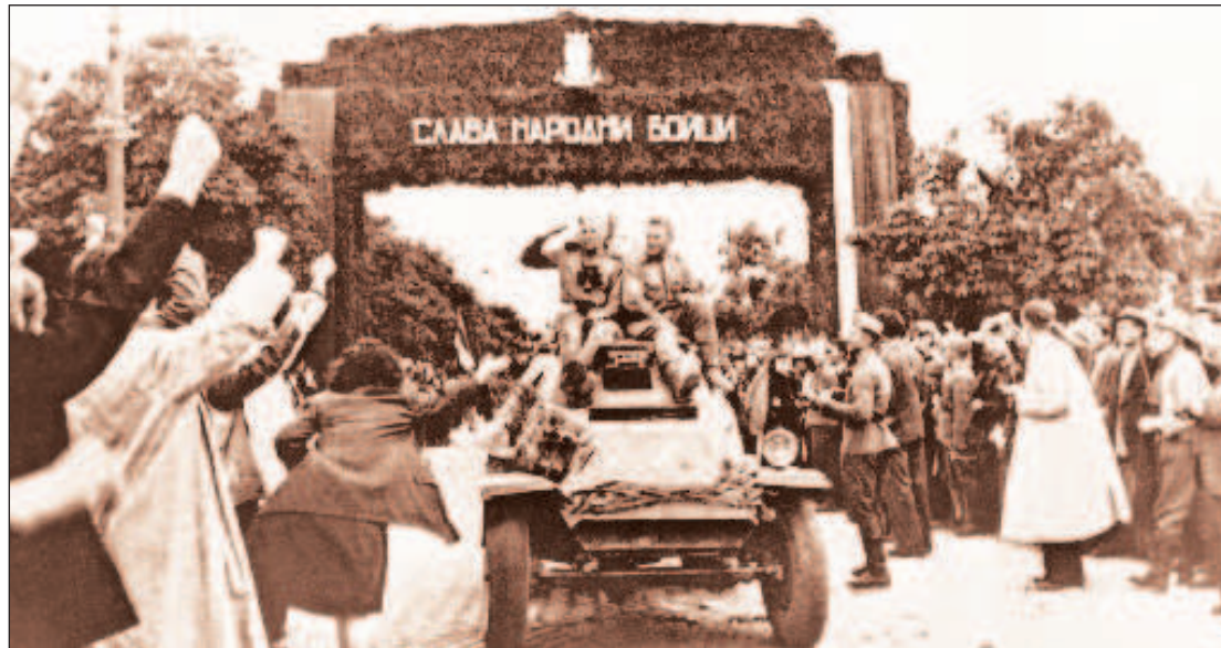
Встреча частей Красной армии в столице Болгарии, 1944 год