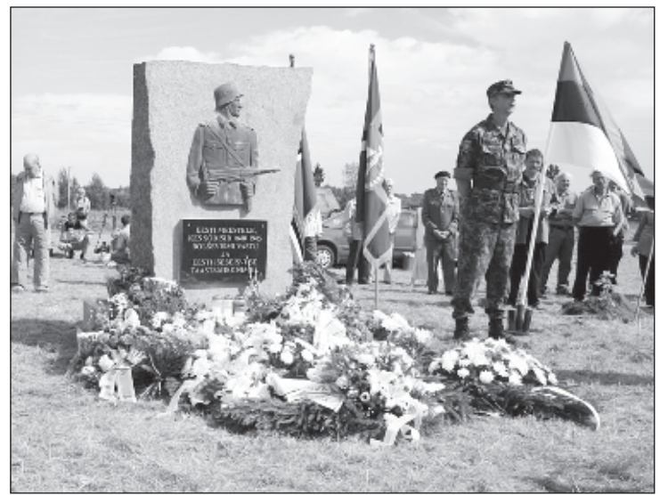
Памятник легионерам 20-й эстонской дивизии СС

Установка памятника вызвала протесты среди русскоязычного населения страны. Соответствующее заявление сделал и МИД России. Правительство