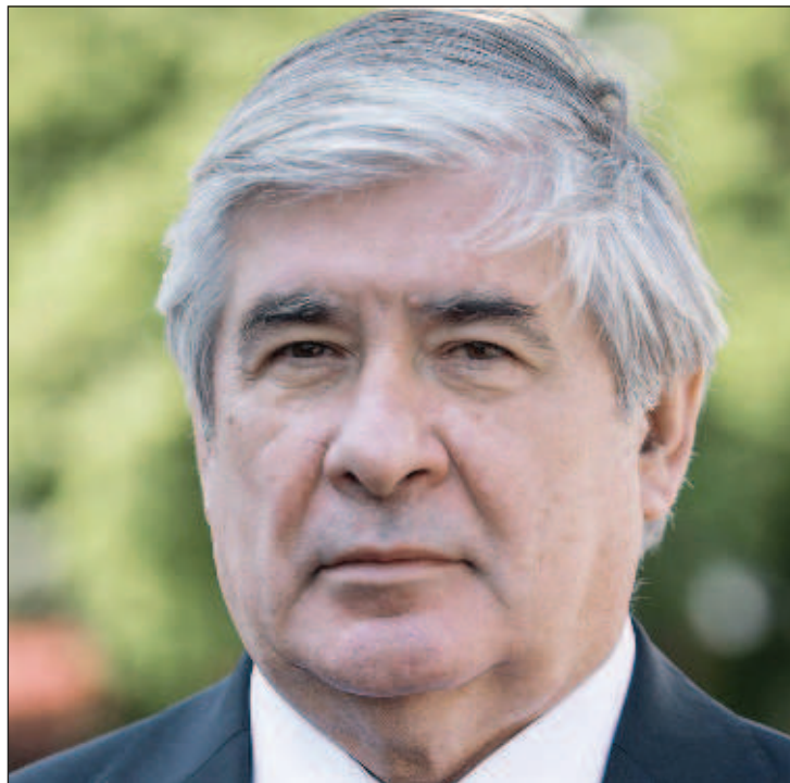
Посол России в Болгарии Анатолий Макаров

Несомненно, вершина в летописи болгаро-российских отношений - освобождение Болгарии. Свобода воскресила к новой жизни болгарское государство и проложила путь современной ев-