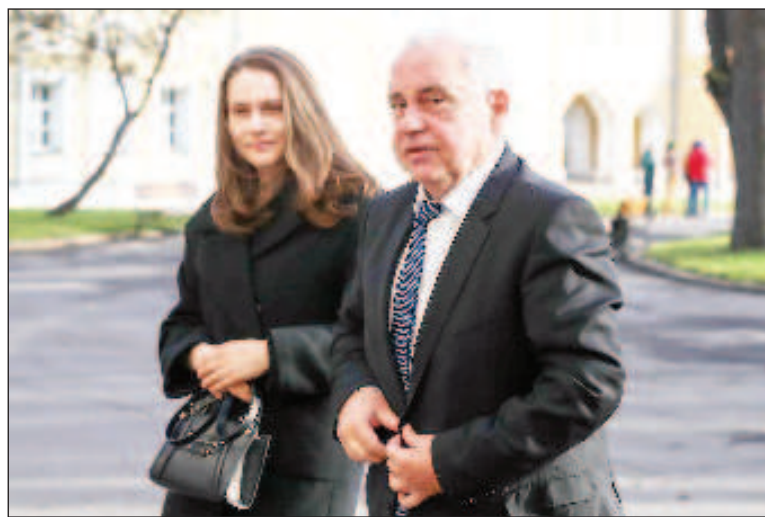
Атанас Крыстин во время визита во Всероссийский музей декоративно-прикладного и народного искусства в Москве

Конечно, важным направлением в двустороннем плане является чествование 140-й годовщины со дня установления дипломатических отношений между Болгарией и Россией.