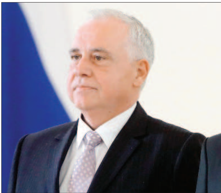
Посол Болгарии в России Атанас Крыстин

В 2017 году был отмечен значительный рост в двухсторонней торговле с Россией, но, к сожалению, в 2018 году эта положительная тенденция не сохранилась и двухсторонний товарооборот уменьшился на 4,1%. Однако, согласно данным за 2019 год, снова наблюдается небольшое увеличение товарооборота. Поэтому наше общее стремление - это