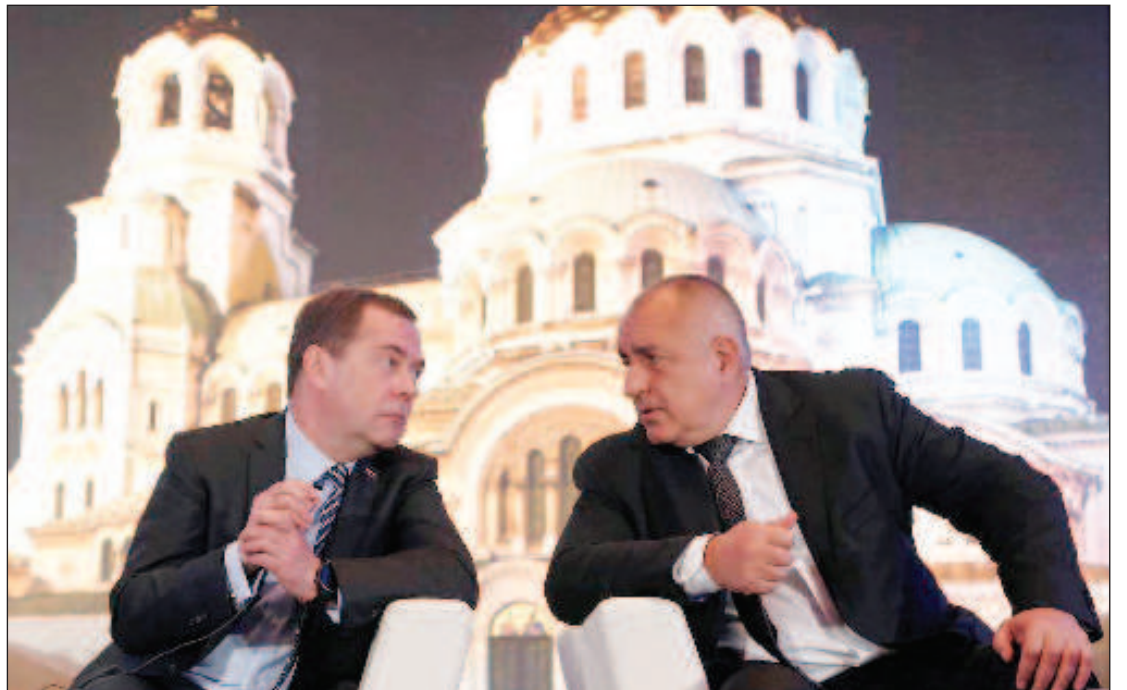
Премьер-министр РФ Дмитрий Медведев и премьер-министр Болгарии Бойко Борисов, 2019 год

- В какой области взаимодействие России и Болгарии идет наиболее ус-