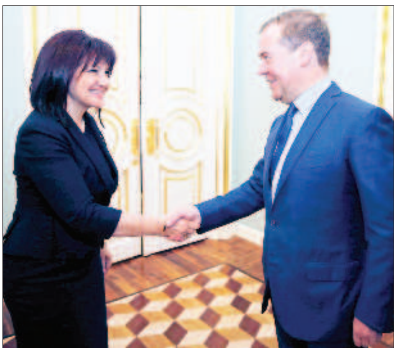
Председатель Народного собрания (парламента) Болгарии Цвета Караянчева и премьер-министр РФ Дмитрий Медведев во время встречи в подмосковной резиденции "Горки"