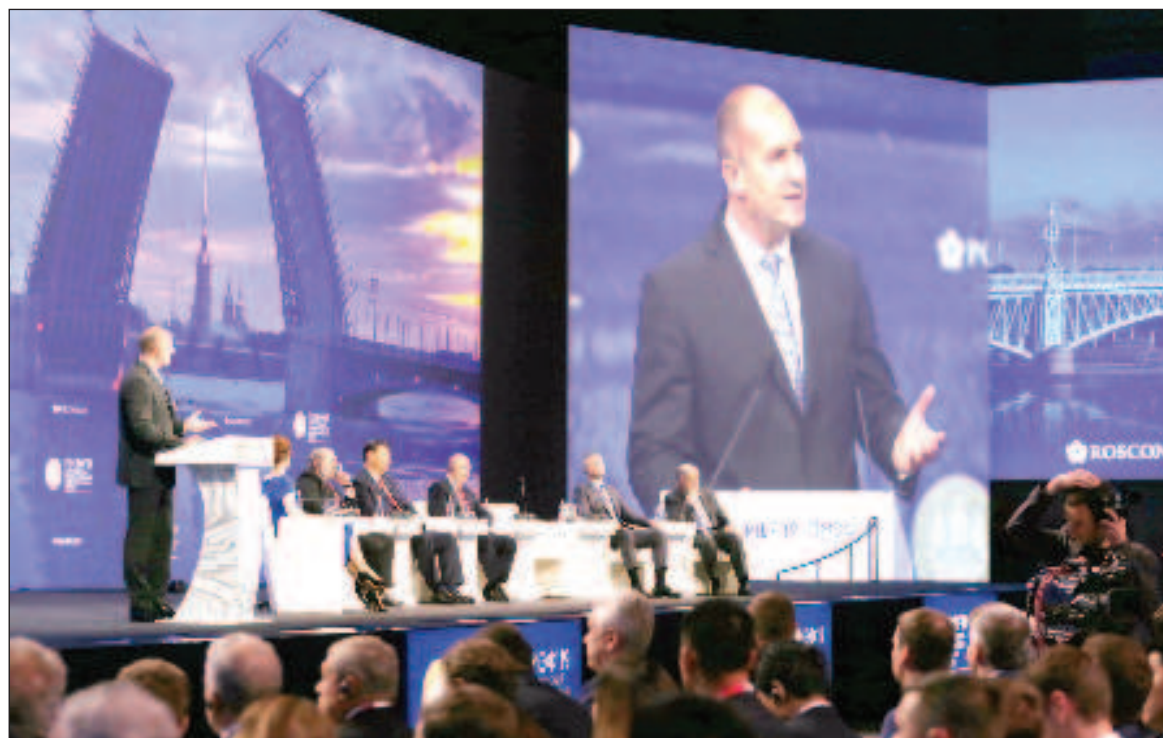
Выступление Президента Республики Болгария перед Международным экономическим форумом в Санкт-Петербурге, 7 июня 2019 г.

Москва - один из самых богатых в культурном отношении городов мира. То же можно сказать и о прекрасных Санкт-Петербурге, Казани и других городах и регионах. Необходимы годы, чтобы посетить все значимые музеи, театры, православные центры и монастыри, привлекающие почитателей со всего мира. Надеюсь, что во время моего пребывания в России у меня будет возможность посетить множество красивых городов и российских регионов. Во время встреч с нашими партнерами здесь я всегда чувствую теплое отношение, связывающее наши народы.