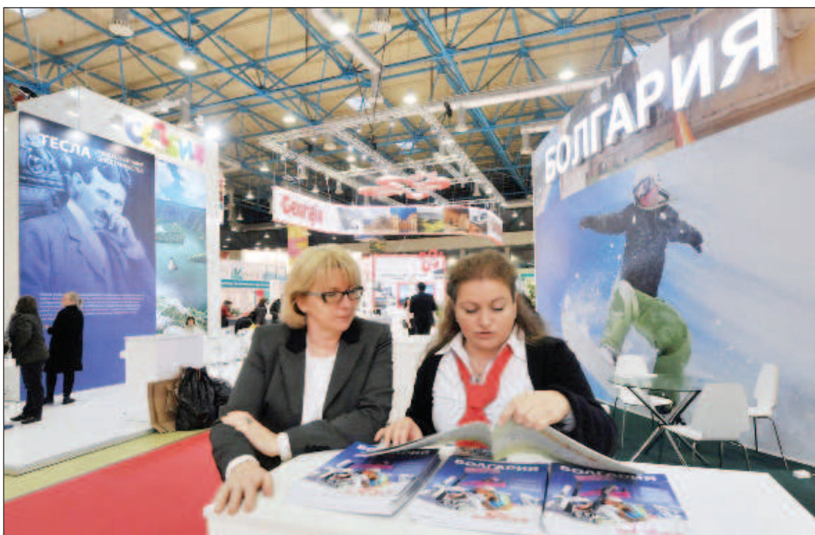
На международном туристическом форуме "Отдых" в ЦВК "Экспоцентр", Москва

Крыстин: В диалоге между нашими странами много тем, которые требуют увеличения динамики и развития. Это ка-