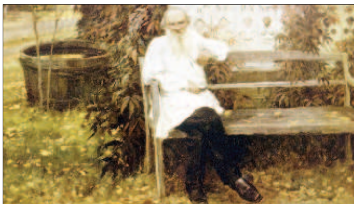
Лев Толстой в своем саду в Ясной поляне

В Гражданскую войну Куприну пришлось уехать из России и покинуть дачу. В эмиграции он с грустью вспоминал о том, что оставил: "Мне не жаль собственности, но мой малый огородишко, мои яблони, мой крошечный благоуханный цветник, моя клубника "Виктория" и парниковые дыни-кantalупы "Женни Линд" - вспо-