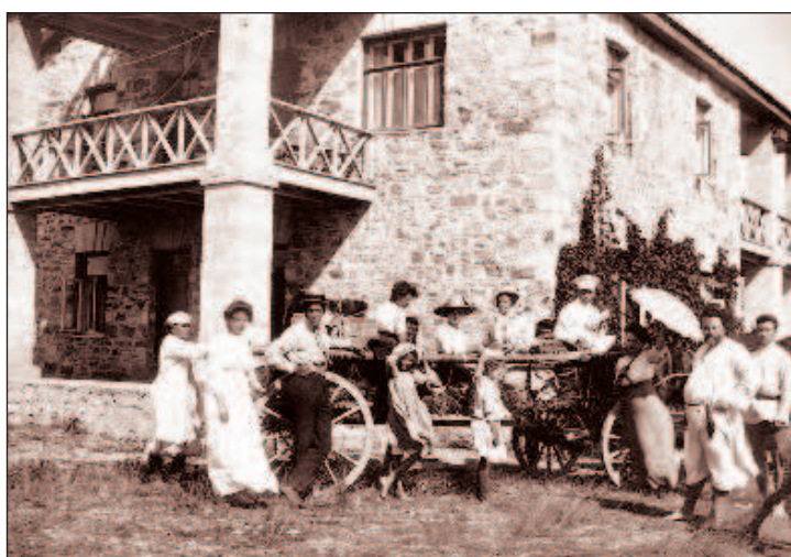
Волошин с гостями у дома в Крыму