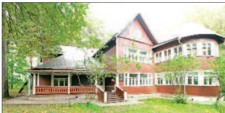
Дача Пастернака в Переделкино