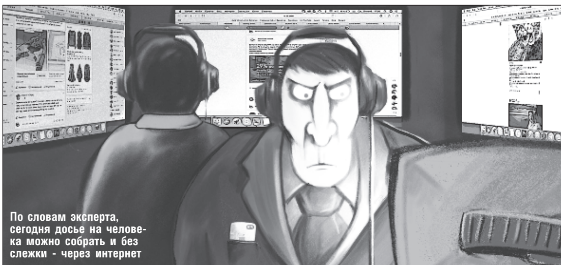
По словам эксперта, сегодня досье на человека можно собрать и без слежки - через интернет

- Семейными проблемами. Они везде одинаковые. Однако в Израиле люди стараются не разводиться, потому что если развод всё-таки случается, то муж должен обеспечить жене и де-