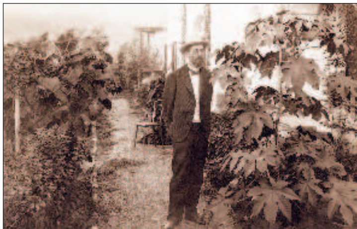
"Садовод" Чехов на "белой даче" в Ялте