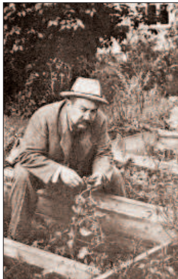
Куприн в Гатчине: полная иллюзия деревни

Писатели, которые занимались садоводством, ухаживали за огородом и просто любили бывать на даче