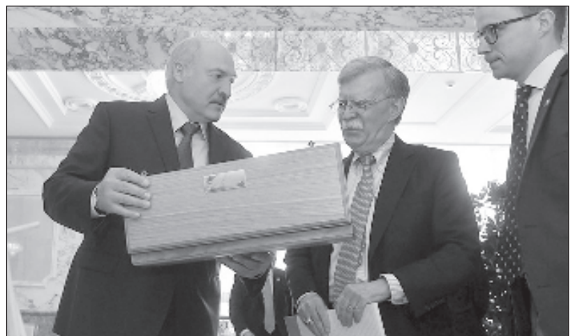
Александр Лукашенко и Джон Болтон

"Президент Белоруссии четко сказал, что мы не идем к США с протянутой рукой, и мы не просим чего-то дать нам и положить на стол, или какую-то крошку забросить в рот. Нет. Мы хотим просто равноправного