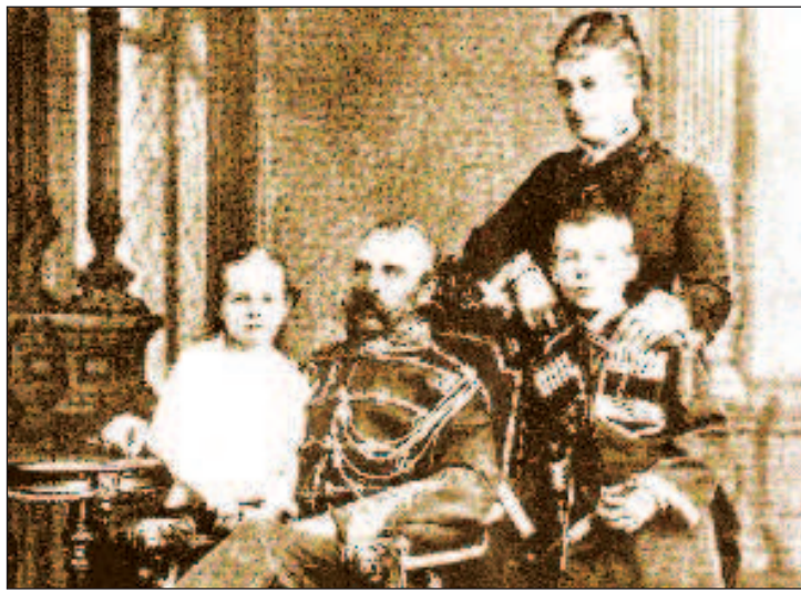
Император и княгиня с двумя старшими детьми

Ради встречи с ней Александр II пренебрегал безопасностью, навещая в беспокойную Францию, куда ее отправили родные в надежде, что вдали она забудет о своем любимом. Разлука несколько не остудила пыл любовников, вернувшись в Россию, Екатерина стала частой гостьей Зим-