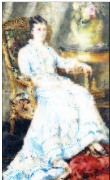
Светлейшая княгиня Юрьевская

С этой поры их променады по аллеям сада приобрели почти ежедневный характер. Ведя беседы, они все больше проникались взаимной симпатией, а 4 апреля 1866 года, когда едва расставшись, она узнала, что у центральных ворот император чуть не пал жертвой террористической атаки, в ее дневнике появилась запись: "Этот день еще сильнее привязал меня к нему; я думала лишь о нем и хотела выразить ему свою радость и благодарность Богу, что он спасает от подобной смерти. Я была уверена, что он испытывает такую же потребность меня увидеть... С