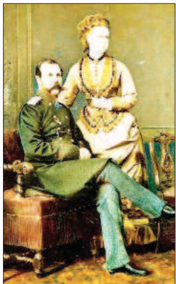
Счастливая жизнь супругов длилась всего восемь месяцев

той минуты я решила, что мое сердце навсегда принадлежит ему".