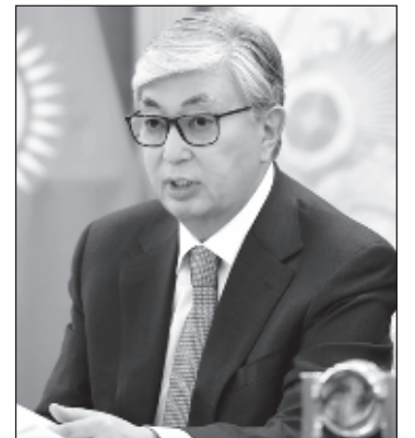
Президент Казахстана Касым-Жомарт Токаев

В 2016 году Назарбаев потребовал показательно увольнять чиновников, отказывающихся говорить с людьми на русском. Однако в феврале прошлого года он заявил, что органы власти - парламент и правительство - должны переи-