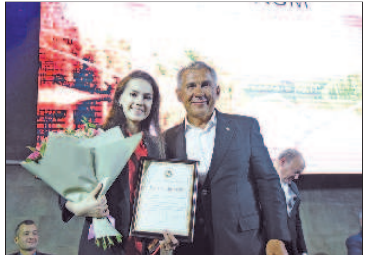
Президент Республики Татарстан Рустам Минниханов и российская фигуристка Олимпийская чемпионка - 2019 Алина Загитова

Главным гостем мероприятия стал президент Татарстана Рустам Минниханов, после выступлений он вручил государственные награды Республики Татарстан.