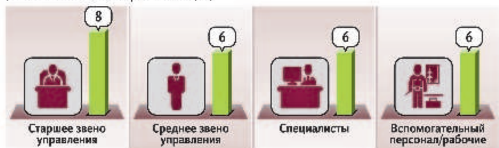
Процент компаний, планирующих изменить численность персонала в ближайшие 12 месяцев