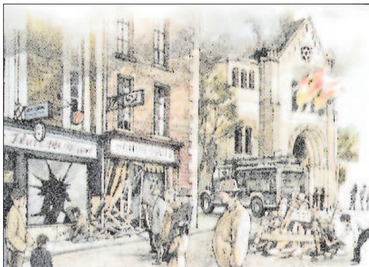
„Хрустальная ночь“ в Берлине - 9 ноября 1938 года

Известие о смерти фом Рата пришло 9 ноября, когда нацисты как раз отмечали очередную годовщину Пивного путча. Именно тогда Йозеф Геббельс заявил, что Национал-социалистическая рабочая партия Германии (НСРПГ) не будет унижать себя организацией каких-то акций возмездия против евреев, но если народ решит предпринять определенные действия, то ни армия, ни полиция вмешиваться в ситуацию и защищать евреев не будут. Эти слова означали только одно - Рейх открыто дает добро на проведение еврейских погромов. По крайней мере, сразу после речи Геббельса руководители территориальных структур НСРПГ приступили к выработке плана действий