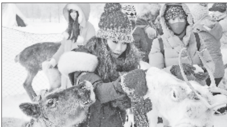
Туристы из Азии любят такие виды развлечений, при которых можно контактировать и фотографироваться с арктическими животными

„После распада СССР по экономическим и политическим причинам у вьетнамцев появились проблемы с получением российских виз. Но, несмотря на все сложности, желание у наших туристов приехать сюда, где многие учились, провели свою молодость, осталось. Для людей моего возраста и старше Россия не чужая страна, мы учились на российской литературе, российской поэзии. Для тех, кто учился в России, важно увидеть и туристические объекты, многие из которых отлично знакомы вьетнамцам, например ледокол „Ленин“. Все эти названия на слуху, и многие люди хотели бы их увидеть своими глазами“, - рассказал директор национального турофиса в Юго-Восточной Азии