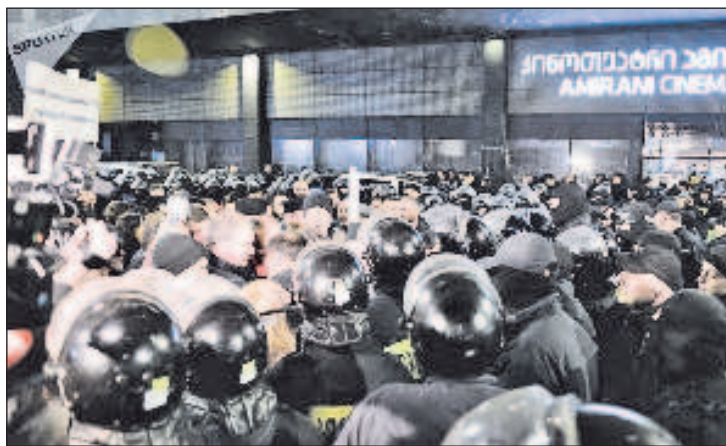
У входа в кинотеатр „Амирани“ был организован полицейский кордон, чтобы не допустить протестующих в здание