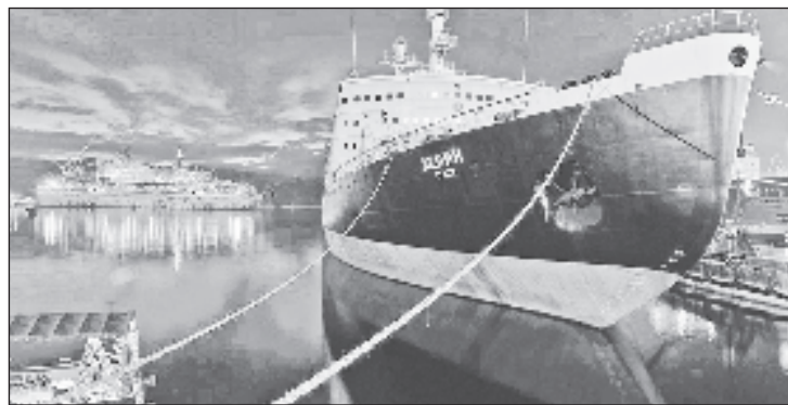
Многие из вьетнамцев, учившихся в России, очень хотят своими глазами увидеть ледокол „Ленин“ у Мурманского морского вокзала

Чтобы сделать отдых для восточных гостей максимально комфортным, мурманские туроператоры позаботились и о тех, кто приезжает в арктические холода неподготовленным и не имеет достаточной теплой одежды. Таким туристам сдают в аренду необходимую зимнюю амуницию,