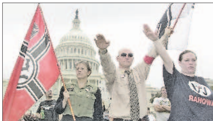
Неонацисты перед Капитолием в Вашингтоне

Штурмовики жгли и громили синагоги в Берлине, и хотя в городе горели десятки зданий, пожарная охрана не предпринимала никаких мер, занимаясь лишь предотвращением распространения огня на другие здания. Вслед за