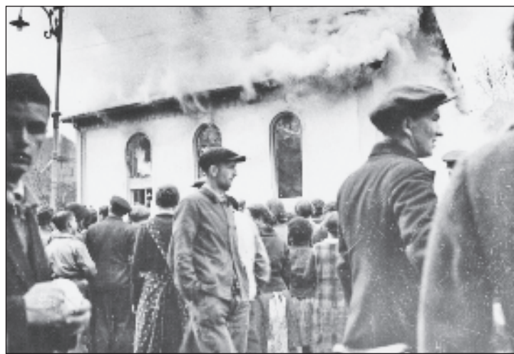
В ту ночь были разгромлены 42 синагоги

Прошло меньше года после „Хрустальной ночи“ и 1 сентября 1939 г. началась Вторая мировая война. Достаточно быстро гитлеровцы оккупировали Польшу, потом настал черед и Франции. В июне 1940 года немецкие войска вошли в Париж. После „Хрустальной ночи“ Европа опасалась, не хотела усложнять отношения с нацистами. Сегодня, кажется, опять опасается. Не хочет усложнять отношения с режимом на Украине, заигрывает с неонацистами у себя дома. То же самое происходит и в США. На днях Третий комитет Генассамблеи ООН принял российский проект резолюции о борьбе с героизацией нацизма. За документ голосовала 121 страна, 55 воздержались и только две - США и Украина - высказались против. Страны ЕС опять трусили и были среди воздержавшихся.