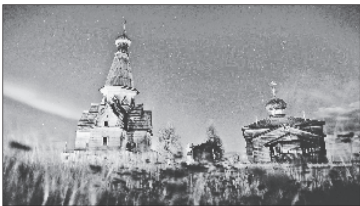
Для большинства азиатских туристов деревянное зодчество северных широт - настоящая экзотика. На фото Успенская и Афанасьевская церкви на фоне полярного сияния. Село Варзуга

„Люди в Малайзии сейчас в поисках новых направлений для путешествий. В основном в России наши туристы приезжают в Москву или Санкт-Петербург, а северный регион - это экзотика. Что касается моих впечатлений, то увидеть северное сияние - это одно из моих больших желаний. Поэтому, когда я получила приглашение в Мурманск, моя первая мысль была: „Вау, мои мечты исполнятся!“ Так что я планирую, что смогу получить этот опыт сейчас“, - рассказывает Хе-