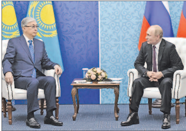
Путин и Токаев встретились в Омске

Во второй половине второго дня форума состоялось пленарное заседание, которое провели президенты Владимир Путин и Касым-Жомарт Токаев. По традиции, в следующем году форум должен пройти в одном из приграничных городов Казахстана.