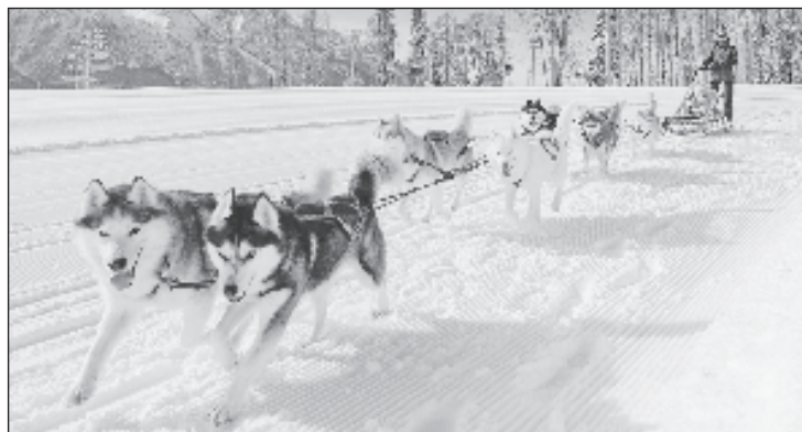
Катание на собачьих упряжках