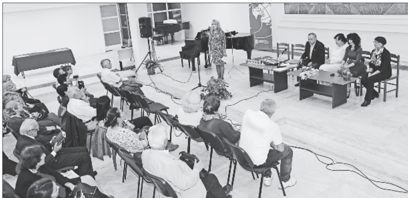
Награждение лауреатов конкурса

III Смуглый отрок бродил по аллеям, У озерных грустил берегов, И столетие мы лелеем Еле слышный шелест шагов. Иглы сосен густо и колко Устилают низкие пни... Здесь лежала его треуголка И растрепанный том Парни.