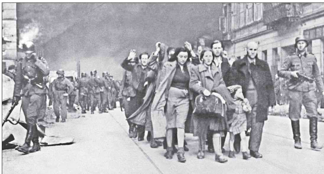
В погромах в „Хрустальную ночь“ погибли от 500 до 2,5 тысяч евреев

по всей Германии начались нападения агрессивно настроенных молодых людей и мужчин на синагоги, магазины и кафе, принадлежавшие евреям, и на квартиры евреев. В Берлине погромщиками руководил лично Гейдрих, а всяческое содействие оказывал граф Вольф-Генрих фон Хельддорф - начальник общей полиции германской столицы. Он был патологическим антисемитом, поэтому не только не стал препятствовать совершению преступлений во время погромов, но и использовал возможности полиции для того, чтобы погромщики смогли причинить еврейской общине города наибольший вред.