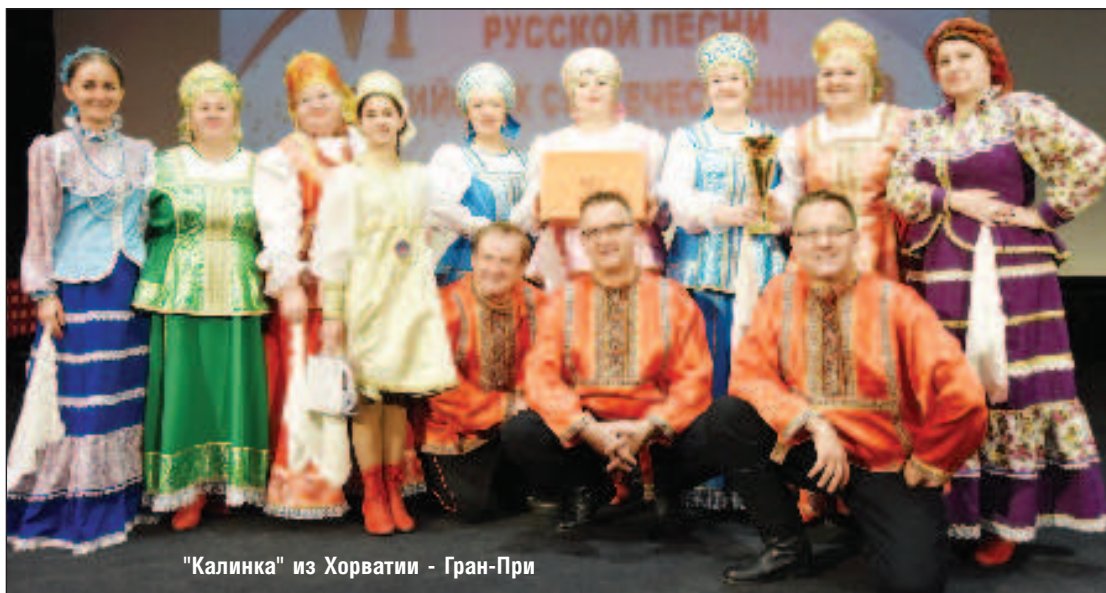
"Калинка" из Хорватии - Гран-При

Жюри предстояла непростая задача, ведь каждый участник исполнял свои композиции не только на высоком профессиональном уровне, но и с душой, с полной отдачей