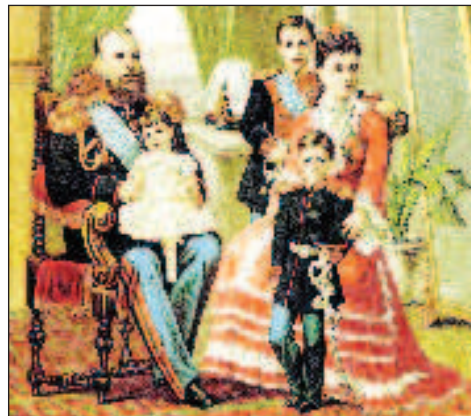
Александр III с семьей

твом себя называла и считала узкая прослойка в паритетной тройке населения. А для царя были важны интересы и проблемы основной массы населения, крестьянства. Критиковали представители более обеспеченных слоев населения, от журналистов до фабрикантов, бунтовали представители национальных меньшинств и городского пролетариата.