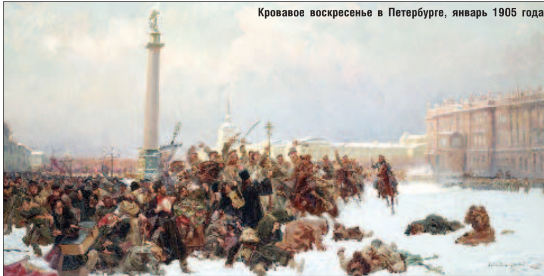
Кровавое воскресенье в Петербурге, январь 1905 года