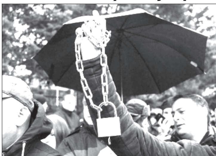
Протестующие к власти в Грузии: "Все равно запрем вас на замок!"