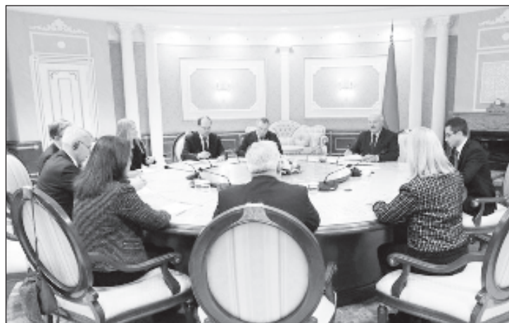
Александр Лукашенко во время встречи с министрами иностранных дел Швеции Анну Линде и Финляндии Пекку Хаависто

В июле этого года Лукашенко призвал ЕС укреплять двусторонние отношения. Белорусский лидер заявил, что в последние годы совместные проекты Бело-