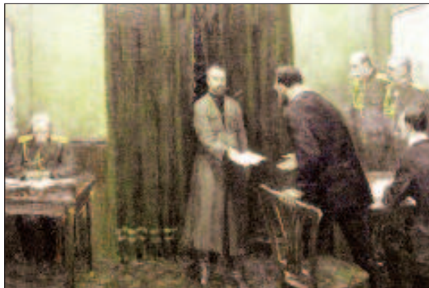
Николай II вручает манифест об отречении от престола