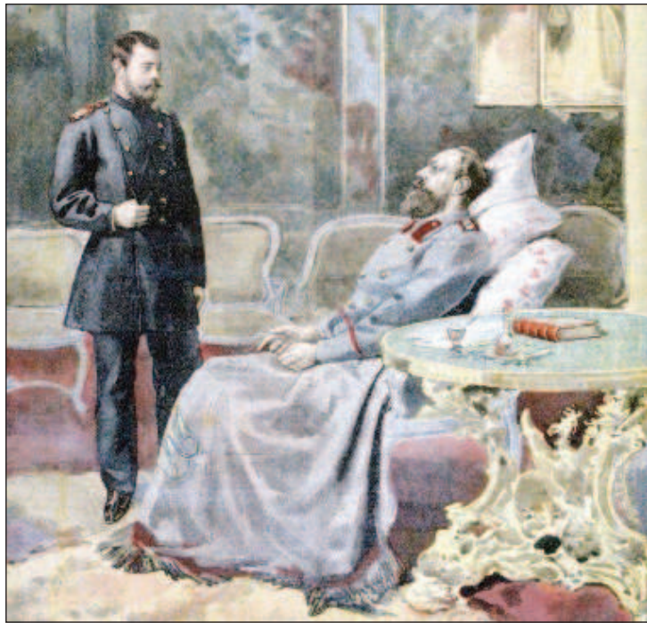
Николай II возле больного отца Александра III

Конечно, на первый взгляд Николай II проигрывает на фоне своего отца, не только ростом и статью, но и характером. Он был куда мягче, им пытались манипулировать, на него давили, его шантажировали. Да, ему досталось более трудное время, но при этом он был умным, знающим правителем, самостоятельно принимавшим решения и очень хорошо чувствующим свою личную ответственность за Россию. Проблема была в том, что общес-