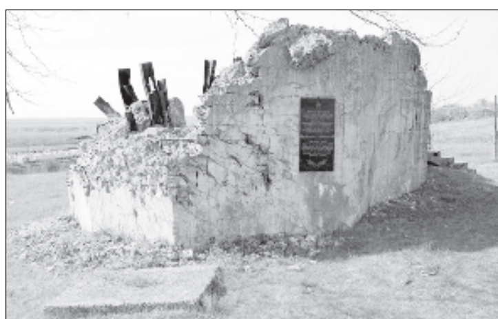
Так выглядела памятная долговременная огневая точка 417 перед действиями вандалов... и после этого

оккупаций, камни в честь оккупаций, депутаты парламента, выгуливающие собак на воинских кладбищах, пока оскорбление памяти на государственном уровне будет оставаться нормой, до тех пор по телу Молдавии