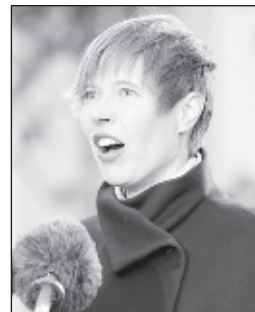
Президент Эстонии Керсти Кальюлайд

При этом президент Эстонии считает, что со стороны России нет непосредственной угрозы, потому что "НАТО на 100 процентов сможет защитить своих союзников". Говоря о диалоге с Москвой, Кальюлайд отметила, что не получала приглашения принять участие в торжественных мероприятиях по случаю 75-й годовщины Победы в Великой Отечественной войне в мае 2020 года. В то же время она напомнила, что в 2020 году Эстония ожидает визит российского президента Владимира Путина. Ранее министр внутренних дел Эстонии Март Хельме заявил, что отношения Прибалтийских республик с Россией всегда будут сложными и в условиях кризиса НАТО и ослабления Евросоюза им необходим запасной вариант для обеспечения собственной безопасности. По словам министра, надежды на защиту стран Балтии со стороны НАТО, ЕС и США слабеют. Хельме отметил, что будущее Североатлантического альянса неизвестно, поэтому Прибалтийские республики должны установить партнерские отношения "с определенными государствами" альянса для сохранения сил обороны.