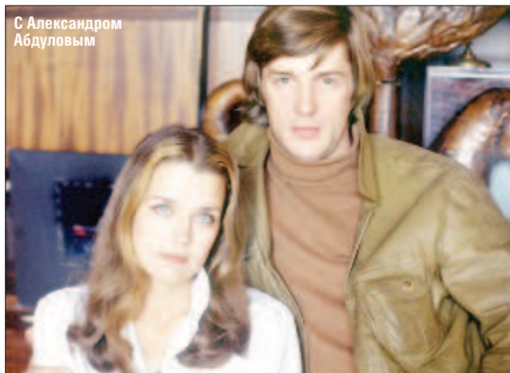
С Александром Абдуловым

настоящим спасением. Но радость вскоре сменилась разочарованием - режиссер давал Алферовой только роли в массовке. Актриса еле сводила концы с концами, и тут ей пришел на помощь коллега по театру - звезда "Ленкома" Александр Абдулов. Он выхлопотал для нее комнату в актерском общежитии, спустя год она стала его женой, а вскоре у супругов появилась и собственная квартира. Алферова вступила в счастливый брак с Александром Абдуловым, который принял Ксюшу как родную дочь. Поклонники оставались уверенными, что девочка - родная дочь Александра. Хотя официальная фамилия Ксении - Гурова, а Алферова - это псевдоним, выбранный девушкой для карьеры телеведущей и актрисы. Казалось, ей наконец улыбнулось счастье, но это счастье не было безоблачным. Конфликты случались и из-за неумеренного темперамента супруга, и из-за его частых и шумных посиделок с друзьями, и из-за разногласий в творчестве. Абдулов был главным претендентом на роль Д'Артаньяна в "Трех мушкетерах", но режиссер Георгий Юнгвальд-Хилькевич в результате остановил свой выбор на Михаиле Боярском. Абдулов ожидал, что его жена, которую он сам привел на кинопробы на роль Констанции, из солидарности уйдет следом за ним. Но она не могла отказаться от этой работы, ведь на тот момент ее единственной звездной ролью была только Даша в "Хождении по мукам". А ее муж воспринял ее участие в съемках как предательство. Между тем роль, которая превратила Алферову в одну