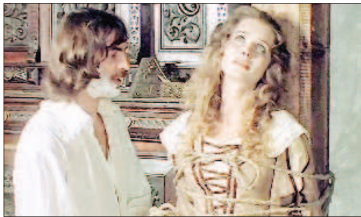
Ирина Алферова в фильме "Д'Артаньян и три мушкетера", 1978

лун" (1983), "Капкан" (2007). Абдулова вряд ли можно было назвать верным мужем, но себе он позволял то, чего не позволял супруге. Она никогда не давала ему поводов для ревности, но когда до него дошли слухи о том, что ее отношения с певцом Александром Серовым на съемках его клипа на песню "Ты меня любишь" вышли за рамки профессиональных, он им поверил. Оскорбленная недоверием, Алферова не стала оправдываться и предложила расстаться. Так и не расставив все точки над "и", самая красивая пара советского кино распалась. Их брак продлился с 1978 по 1990 год.