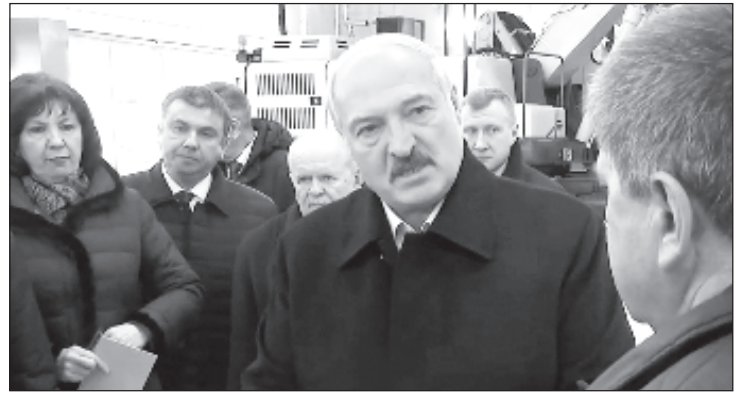
Белорусский лидер Александр Лукашенко готовится к шестому президентскому сроку

Лукашенко бессменно занимает пост президента Белоруссии с июля 1994 года. Сейчас идет его пятый пре-