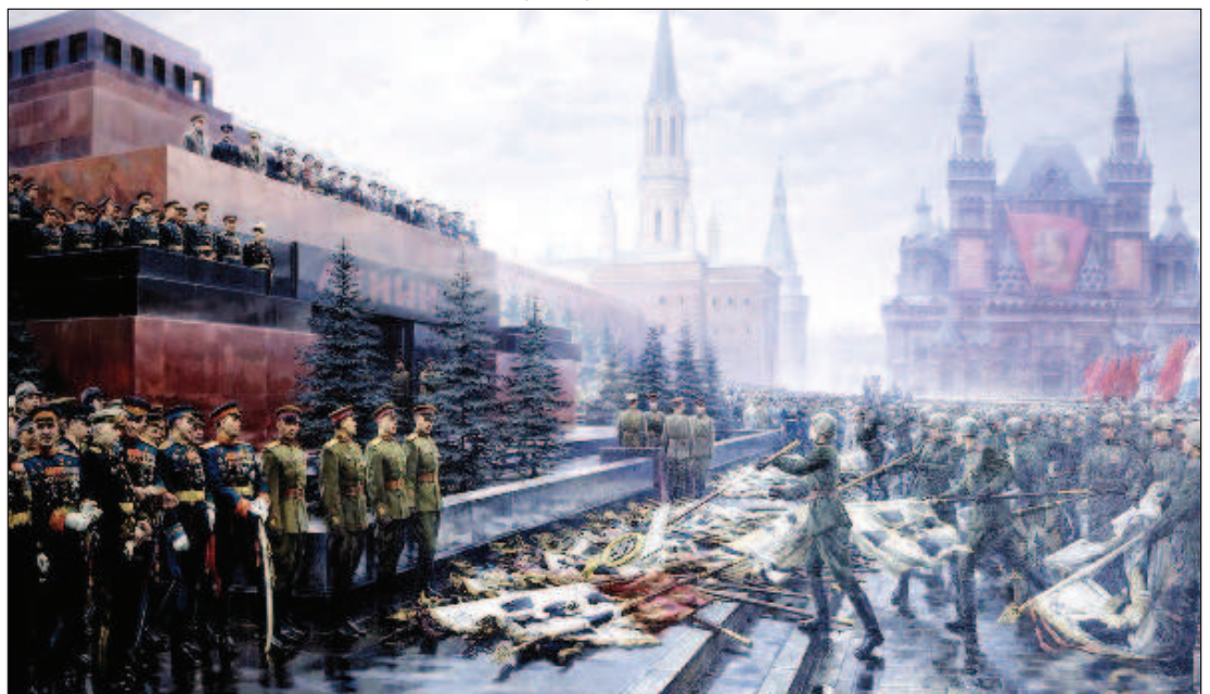
Парад 1945 г. - к подножию Мавзолея были брошены 200 знамен разгромленных немецких войск

На юбилейном параде в честь 70-летия Победы в 2015 г. широкой публике были впервые представлены перспективные модели военной техники - танк Т-14 и тяжелая боевая машина пехоты (БМП) Т-15 на платформе "Армата", колесный бронетранспортер ВПК-7829 (платформа "Бумеранг"), дистанционно управляемые универсальные боевые модули "Эпоха" и другие. В юбилейном параде в 2015 г. было задействовано наибольшее количество техники: 194 единицы колесной и гусеничной техники разных лет, а также 140 самолетов и вертолетов. В параде 2019 г. приняли участие 13 083 человека и 132 единицы боевой техники.