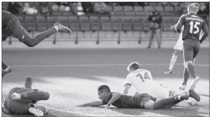
19 марта стартовал чемпионат Беларуси по футболу

"Благодаря" коронавирусу, повлекшем за собой решение УЕФА о приостановке всех соревнований болельщики окунулись в полный футбольный вакуум. Помучавшись неделю, они все же решили полюбопытствовать, а может все таки есть возможность разнообразить свой вынужденный досуг? На помощь пришел чемпионат Беларуси и некоторые другие национальные первенства.