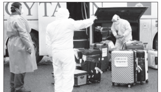
Дезинфекция на автостанции в Бишкеке

"В случае выезда и нарушения норм чрезвычайного положения велосипеды будут изыматься. Советуем не кататься на них