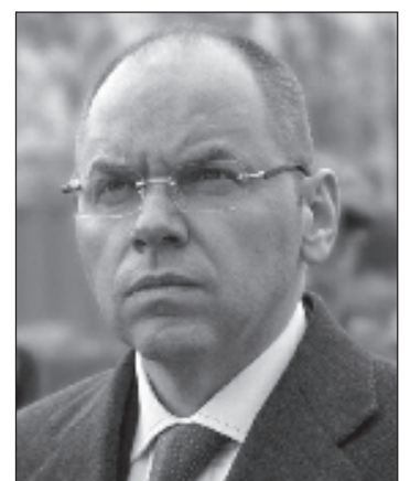
Министр здравоохранения Украины Максим Степанов

Украине коронавирусом заразились 5710 человек, 151 пациент умер.