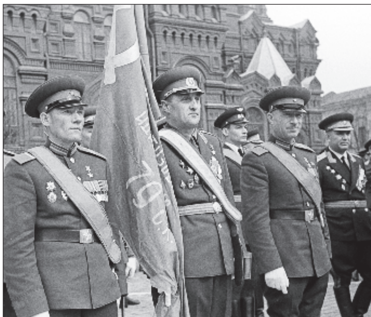
Герои Советского Союза сержант Михаил Егоров и старший сержант Мелитон Кантария на параде 1965 г.

Всего в параде 9 мая 2020 года планируется задействовать 225 единиц вооружения и военной техники, в т.ч. 24 новейших образца боевой техники, которые должны были быть представлены впервые. В авиационной части парада будут представлены 55 самолетов, в т.ч. четыре авиаконструктора "Кинжал" и четыре Су-57, а также 20 вертолетов - то есть всего 75 машин, что символизирует 75-ю годовщину Победы.