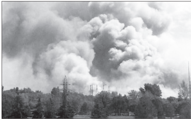
Спасатели борются с лесными пожарами третью неделю

По словам Авакова, спасателям мешал сильный ветер. "По итогам работы утром провели облет зон пожаров. По Чернобыльской зоне: из четырех очагов один локализован. По Житомирской области: из четырех локализовано два. При этом не очень хороший на сегодня прогноз по вет-