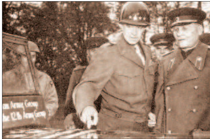
Генерал армии Брэдли дарит джип маршалу Коневу

интенсивно, что командующий американской армией генерал Брэдли приказал всем своим подчиненным перед застольями с русскими обязательно съесть по 50 грамм масла, чтобы сохранить хоть какую-то боеготовность. Там же на Эльбе советские и американские солдаты дали клятву никогда не становиться врагами и сделать все, чтобы войн в мире больше не было.