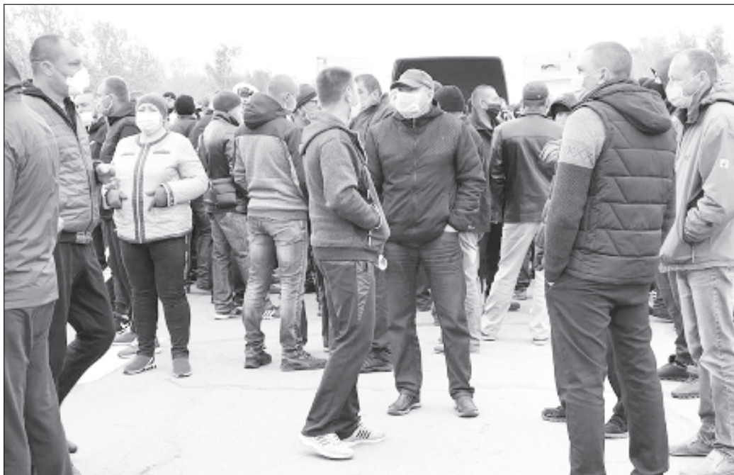
Несколько сотен украинских аграриев перекрыли автодорогу из-за карантина

Глава областной администрации Юрий Гусев заявил, что готов встретиться с протестующими при условии соблюдения карантинных мер, и предупредил, что нарушения ограничений будут фиксироваться. Чиновник также попросил направить ему предложения по поддержке агропромышленной отрасли экономики региона.