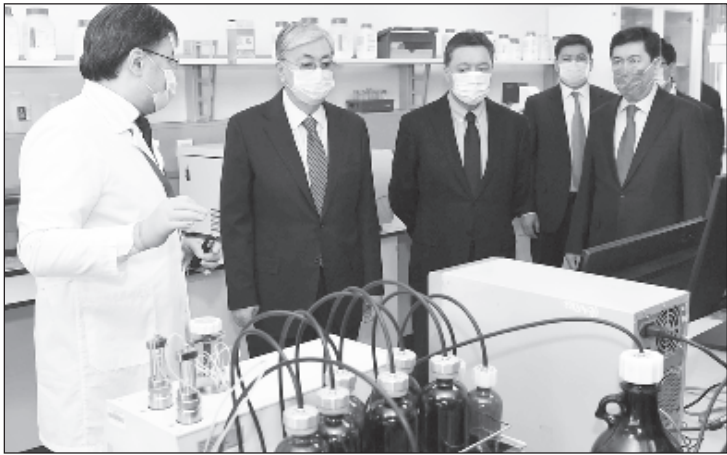
Президент Казахстана посетил Национальный центр биотехнологий