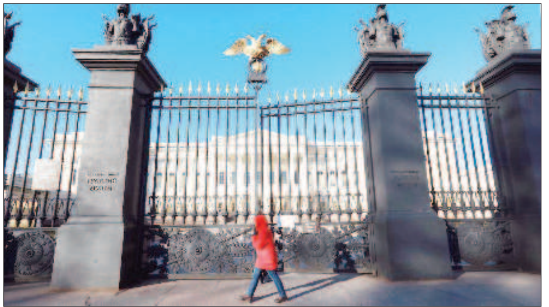
Вход на территорию Михайловского дворца Русского музея

программы развития, которая включала создание уникального музейно-архитектурного комплекса в центре Петербурга. Помимо Михайловского дворца, в котором появился Русский музей, сейчас ему принадлежат Мраморный и Строгановский дворцы, Инженерный замок, Домик Петра I. Также нам передали Летний сад с Летним дворцом Петра I и Михайловский сад. После этого возникла необходимость создать новую службу со специалистами по ландшафту и деревьям. Таким образом, музей осваивает новые сферы. Сейчас для нас закончился процесс мирной экспансии, во время которой мы получили новые здания и музей вырос в несколько раз. Всё это было сде-