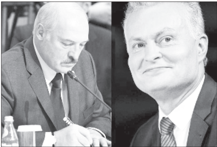
Впервые за десять лет состоялся телефонный разговор президентов Литвы и Белоруссии

На прошлой неделе впервые за 10 лет состоялся телефонный разговор президентов Литвы и Белоруссии. "Руководитель нашей страны предложил Белорусии, в случае необходимости, помощь медицинскими средствами, поскольку Беларусь подала просьбу о помощи Евросоюзу", - сказала Скайсгирите.