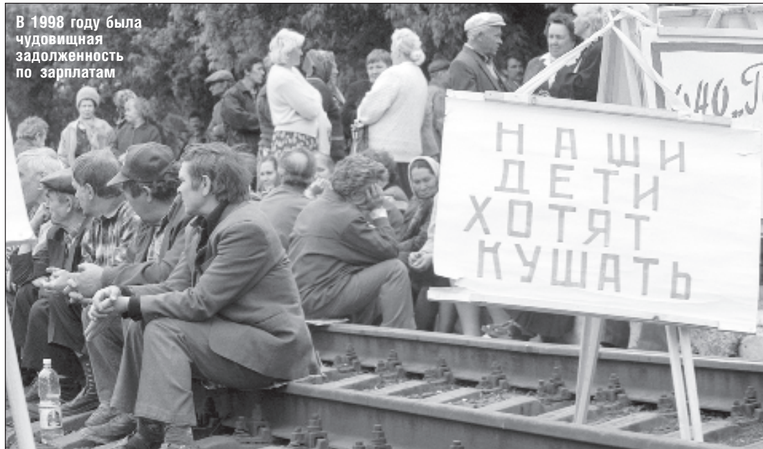
В 1998 году была чудовищная задолженность по зарплатам

- Среди экономистов идет дискуссия. Страны уже торопятся запустить производство. Если по этому пути последуют большинство стран, то выход из кризиса пройдет по U-образной траектории. Это значит, что мировая экономика оживет уже в IV квартале, мы увидим скромную положительную динамику роста мирового ВВП. Если же карантин затянется, придут повторные волны заражений и цепочки поставок будут восстанавливаться дольше, нас ждет более медленный L-образный выход из кризиса. Это значит, что из минуса в плюс мировая экономика выйдет только к следующему лету.