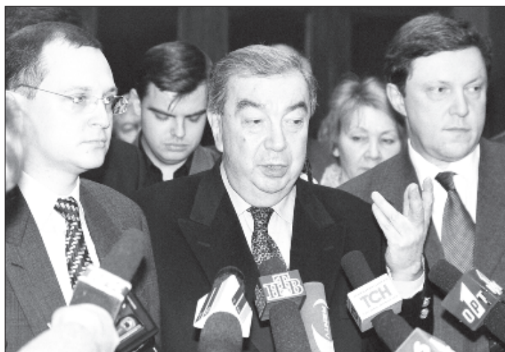
Акад. Евгений Примаков (в центре) отвечает на вопросы журналистов о мерах выхода из кризиса 1998 года

практически не давали кредита - по политическим соображениям. В отсутствие золотовалютных резервов не приходилось рассчитывать и на помощь МВФ. Примаков был хорошо знаком с японским премьером, и тот сначала предложил кредит по ставке плюс 0,5 пункта на 12-14 млрд долларов, а потом отказал. По всей видимости, из Вашингтона настоятельно рекомендовали не торопиться. Сегодня с кредитами не легче, и проблема не столько в санкциях, сколько в напряженной ситуации, в которой оказались экономики ведущих мировых центров.