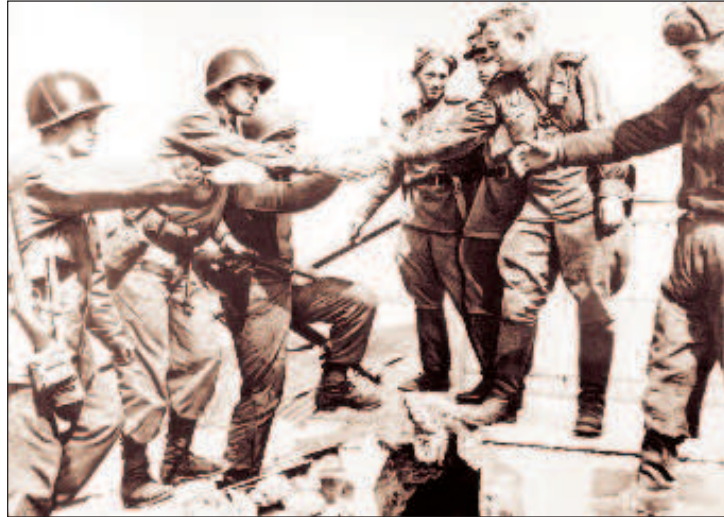
Рукопожатие на разрушенном мосту

разделявшей их немецкой 12-й армии больше нет, она полностью разбита. В сотне километрах еще вовсю кипела битва за Берлин, а в небольшом городке Торгау на Эльбе уже праздновали неминуемую победу. На кадрах военной хроники тех лет отчетливо видно, что между солдатами двух разных армий не было и тени недоверия. Американцы запомнились неумным любопытством к советским воинам и стремлением непременно обзавестись каким-нибудь сувениром. Русские раздавали им звездочки с погон, пилоток и просто пуговицы от гимнастерок. Гуляли несколько дней и так