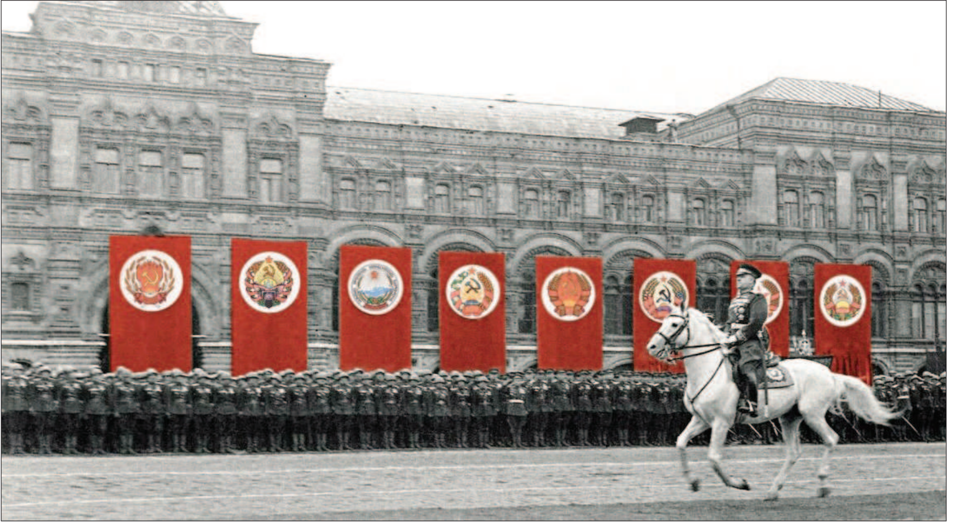
Маршал Жуков принимает Парад победы 24 июня 1945 года

продолжить кропотливую работу по восстановлению имен и судеб всех погибших - бойцов Красной армии, партизан, подпольщиков, военнопленных и узников концлагерей, мирных граждан, уничтоженных карателями. Это наш долг. И здесь особая роль принадлежит участникам поискового движения, военно-патриотическим и волонтерским объединениям, таким проектам, как электронная база данных "Память народа", основанная на архивных документах. И, конечно, в решении такой общегуманитарной задачи необходимо тесное международное сотрудничество.