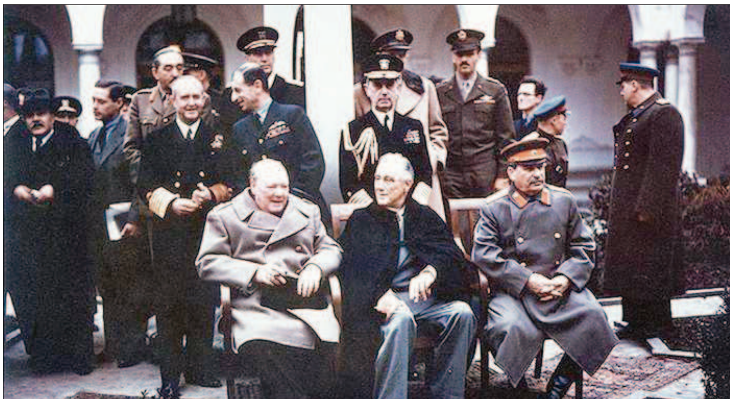
Уинстон Черчилль, Франклин Рузвельт и Иосиф Сталин на конференции союзных стран в Ялте (Крым) с 4 по 11 февраля 1945, где обсуждалось установление послевоенного мирового порядка. Это последняя конференция "большой тройки" в дядерную эпоху

Пишу об этом без малейшего намерения взять на се-