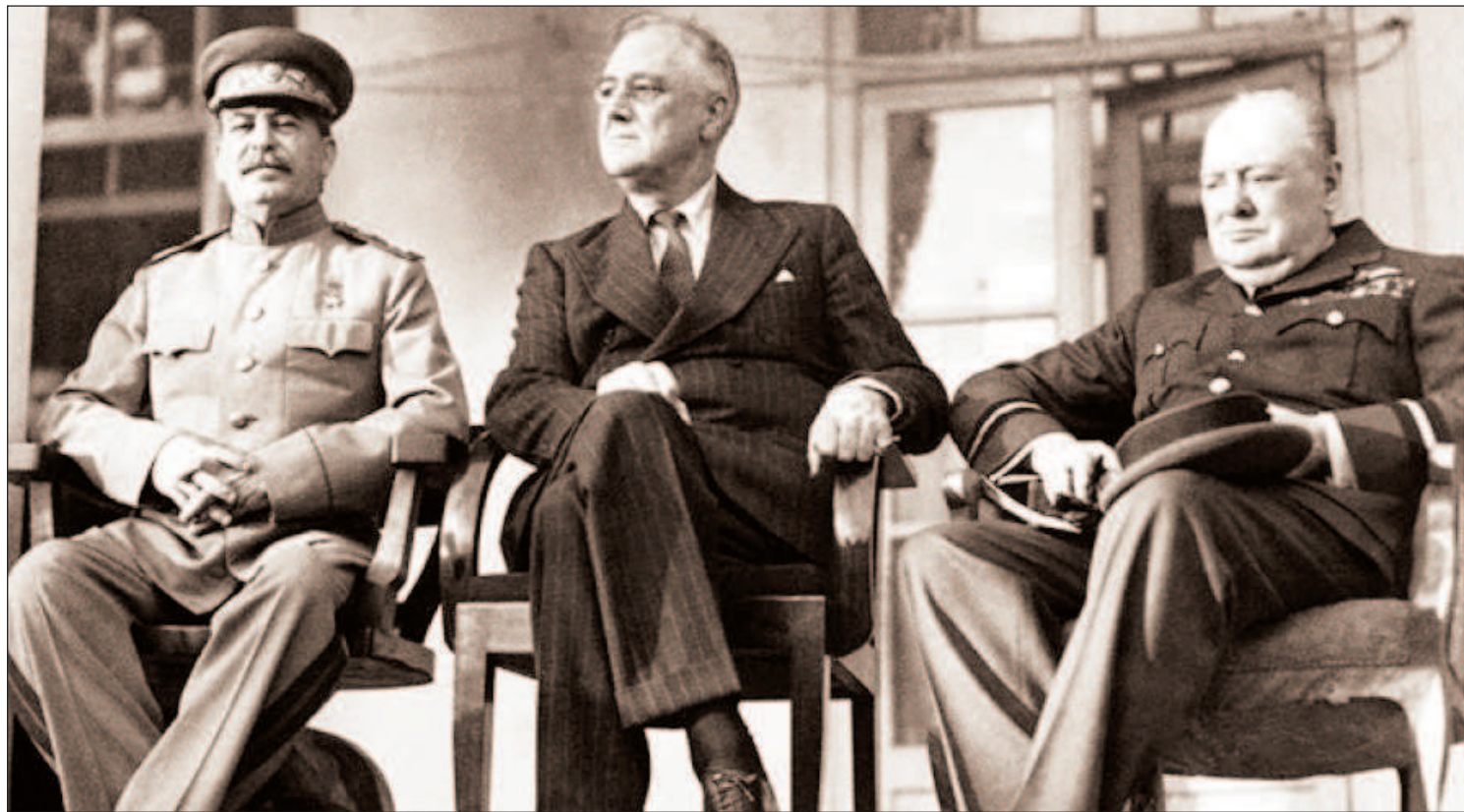
28 ноября - 1 декабря 1943 года в Тегеране (Иран) состоялась конференция руководителей трех союзных государств антигитлеровской коалиции: председателя Совнаркома СССР Иосифа Сталина, президента США Франклина Рузвельта и премьер-министра Великобритании Уинстона Черчилля. В Тегеране впервые в полном составе собралась "большая тройка"

Очевидно, что других вариантов не оставалось. В противном случае риски для СССР возросли бы многократно, поскольку, повторю, старая советско-польская граница прошла всего в нескольких десятках километров от Минска. И неизбежная война с нацистами началась бы для страны с крайне невыгодных стратегических позиций. А миллионы людей разных национальностей, в том числе евреи, жившие под Брестом и Гродно, Перемышлем, Львовом и Вильно, были бы брошены на уничтожение нацистам и их местным приспешникам - антисемитам и ра-