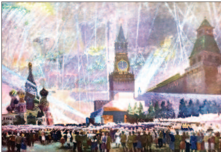
Праздничный салют в небе над Москвой после парада

ких ремнях через левое плечо, с кожаным стаканом, в котором крепилось древко штандарта. А многие сотни орденов лент, венчавших древки 360 боевых знамен, которые нужно было пронести по Красной площади во главе сводных полков, были изготовлены тоже в мастерских Большого театра. Каждое знамя представляло воинскую часть или соединение, отличившееся в боях, а каждая из лент знаменовала коллективный подвиг, отмеченный боевым орденом. Большинство знамен были гвардейскими.