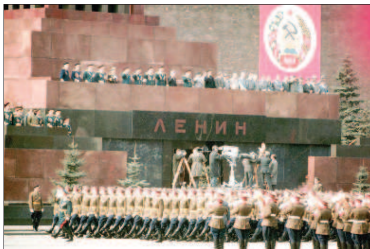
Руководство страны наблюдает парад с трибуны мавзолея