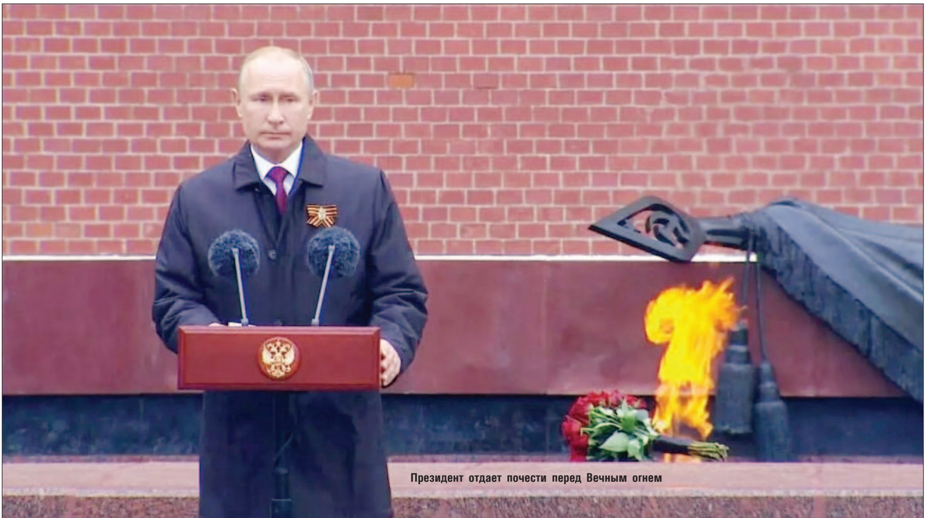
Президент отдает почести перед Вечным огнем

Президент России Владимир Путин предупредил: Забвение уроков истории неизбежно оборачивается тяжелой расплатой