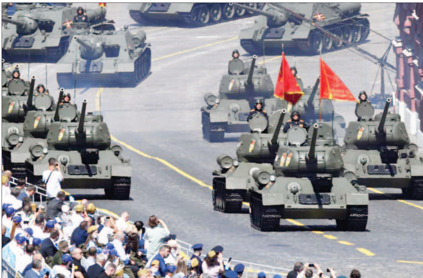
Военная техника на Параде Победы в Москве 24 июня 2020 года

В разделе Чехословакии заодно с Германией действовала и Польша. Они заранее и вместе решали, кому достанутся какие чехословацкие земли. 20 сентября 1938 года посол Польши в Германии Ю.Липский со-