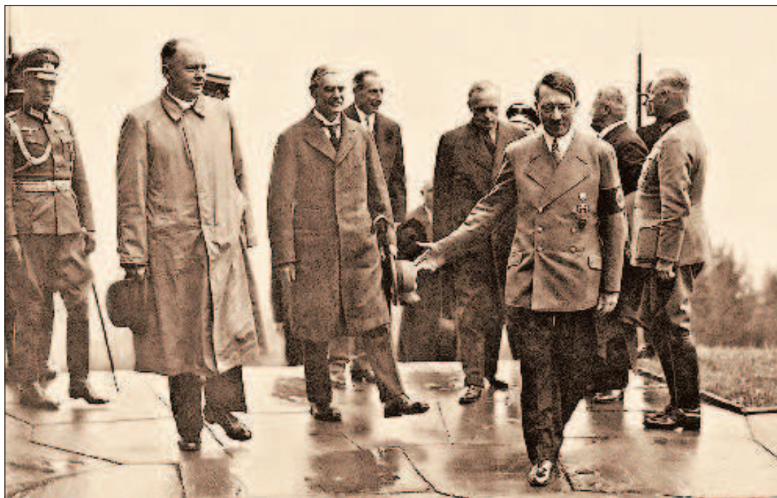
Гитлер с Чемберленом перед подписанием Мюнхенского соглашения, сентябрь 1938 года

Британия, а также Франция, которая была тогда главным союзником чехов и