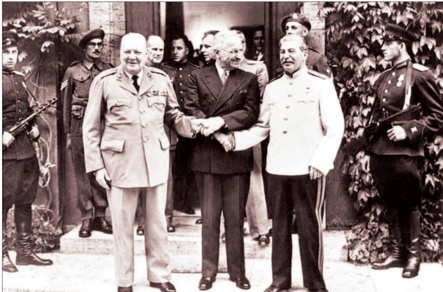
Премьер-министр Великобритании У. Черчилль, Президент США Г. Трумэн и Председатель Совета народных комиссаров СССР и председатель Государственного комитета обороны СССР И. В. Сталин на Потсдамской конференции (с 17 июля по 2 августа 1945 г.) - третья и последняя официальная встреча лидеров "большой тройки"

Сталинградом, Севастополем и Одессой, Курском и Смоленском. Освобождали Варшаву, Белград, Вену и Прагу. Брели штурмом Кенигсберг и Берлин.