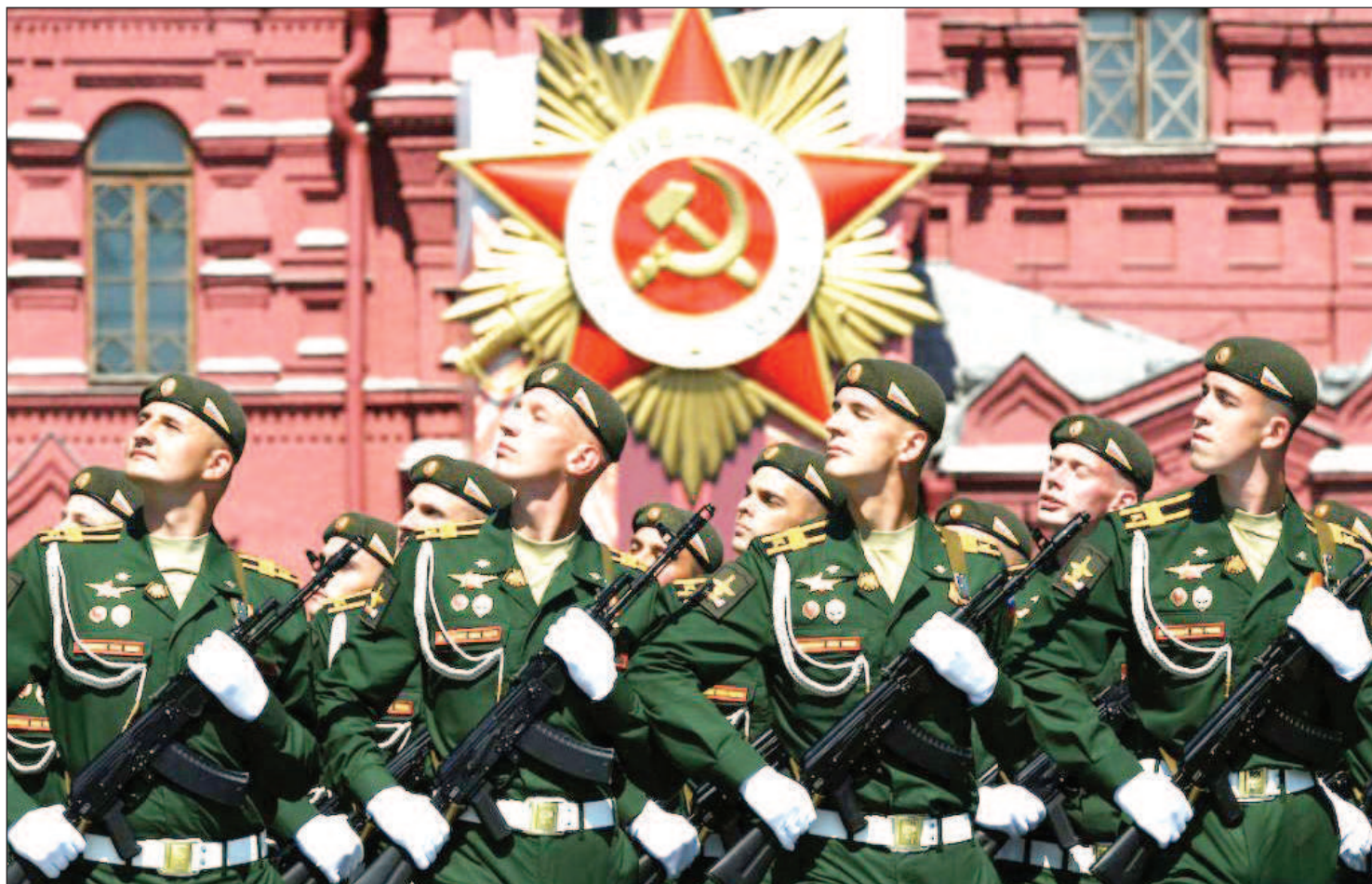
Парад Победы в Москве 24 июня 2020 года

чувствах, строили свою пропаганду, обещая избавить Версаль, восстановить ее былое могущество, а по сути, толкали немецкий народ к новой войне. Парадоксально, но этому прямо или косвенно способствовали западные государства, прежде всего Великобритания и США. Их финансовые и промышленные круги весьма активно вкладывали капиталы в немецкие фабрики и заводы, выпускавшие продукцию военного назначения. А среди ари-