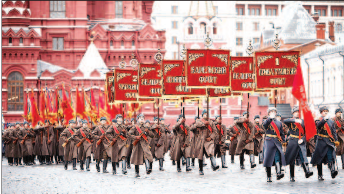
Парад Победы 24 июня 1945 года

Нести штандарты во главе сводных полков поручили луч-