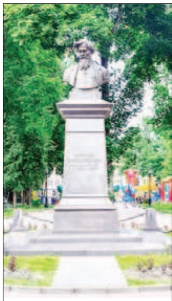
Бронзовый бюст писателя установлен в Брянске у входа в парк с его именем

Как ни странно, воспитанник Жуковского император Александр Николаевич не стал ценителем высокой словесности... О масштабах таланта своего приятеля по детским играм он не имел представления и сожалел, что богатырь Алеша равнодушен к государственной службе. А Толстой и впрямь немало сил приложил, чтобы, вопреки материнской воле, отлынить от служебной рутины, хотя долгое время ему "автоматом" шли чины и придворные звания, от камер-юнкера до действительного статского советника (соответствовавшего генерал-майору). Благодаря близости ко двору Толстому иногда удавалось вызывать своих приятелей из беды. Так, например, он хлопотал о смягчении наказания Тургенева, осужденного за статью в память Гоголя. Наказание смягчили, за что Тургенев был безмерно благодарен Алексею