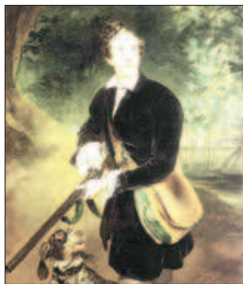
Художники любили писать портреты Толстого. Кисть приложил и Репин, а Брюллов нарисовал юного графа на охоте