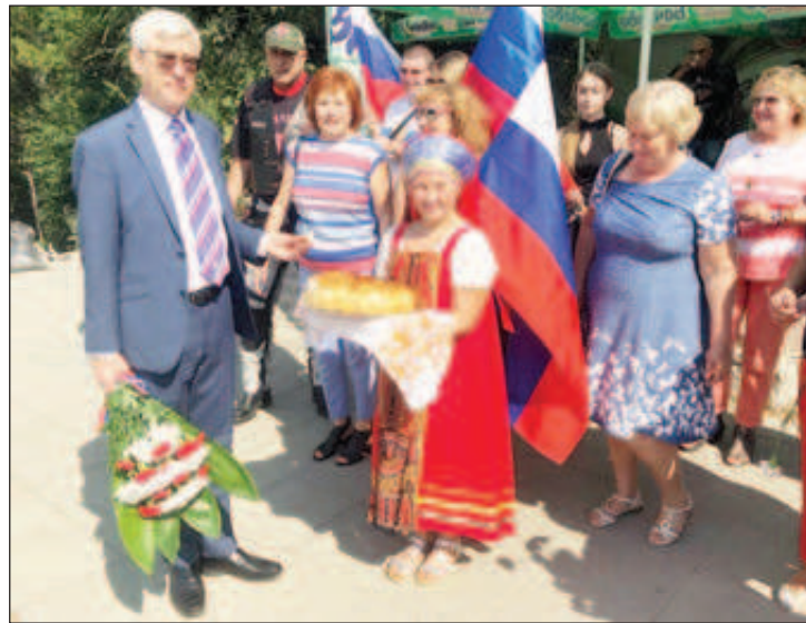
Хлеб да соль. Встреча с соотечественниками в г. Плевен

- Основная наша помощь и задача - это стать своего рода рупором, связующим звеном между соотечественником, оказавшимся в сложной жизненной ситуации, и его исторической Родиной на основе действующих законодательных актов обеих стран.