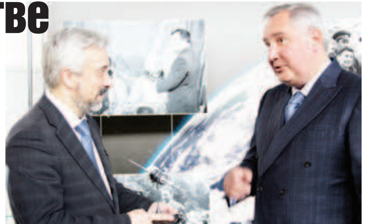
Евгений Примаков и Дмитрий Рогозин

"Центры Россотрудничества могут стать тем самым магнитом для людей, кто с интересом смотрит не только в прошлое России, ищет в этом прошлом ответы на вопросы сегодняшнего дня и будущего", - отметил Дмитрий Рогозин.