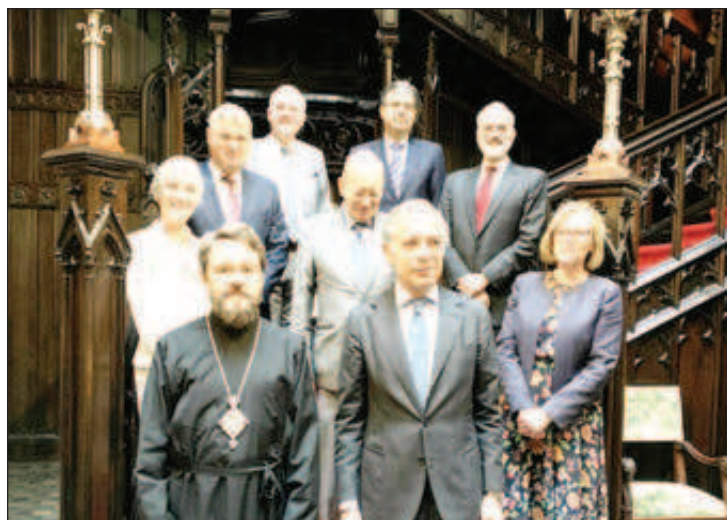
Пьер Луи Леви, Чрезвычайный Полномочный посол

В мероприятии приняли участие Чрезвычайный и Полномочный посол Италии в России Паскуале К. Терраччано, Чрезвычайный и Полномочный посол Великобритании в России Дебора Джейн Броннерт, Чрезвычайный и Полномочный посол Франции в России