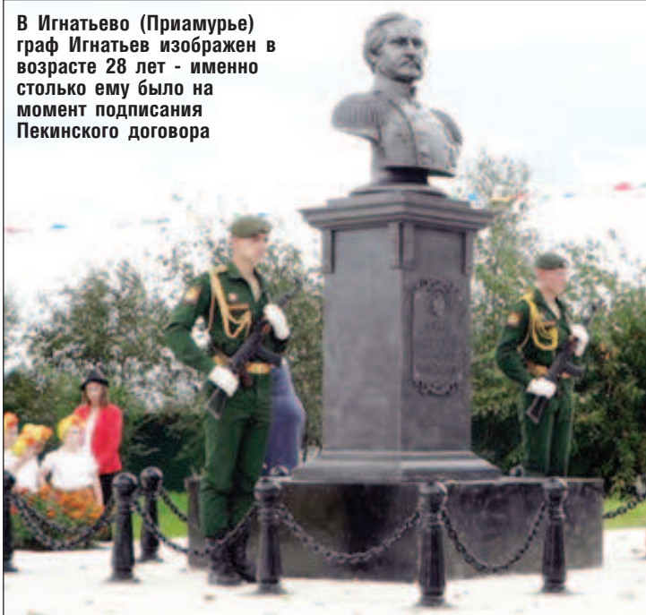
В Игнатьево (Приамурье) граф Игнатьев изображен в возрасте 28 лет - именно столько ему было на момент подписания Пекинского договора

вечения памяти графу Игнатьеву. Один из вариантов предполагал установку бюста-памятника на набережной амурской столицы. Другой - в аэропорту Благовещенска. Третий - в селе, которое носит имя Николая Павловича. В итоге решено было остановиться на последнем.