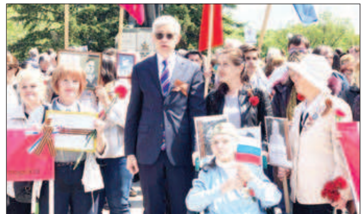
Празднование с соотечественниками Дня Победы в г. Русе, 9.05.2019 г.

Хочу еще раз отметить, что приоритет моей и всей совместной работы Генконсульства - сделать так, чтобы причин для проблемных моментов для наших граждан в Болгарии было бы как можно меньше. Регулярно получая от наших соотечественников обратную связь, проводя совместные рабочие (а порой и неформальные праздничные) встречи, мы лучше