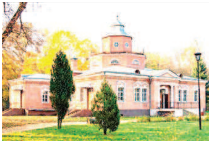
Дом-усадьба Алексея Толстого в селе Красный Рог, Брянской области

Как ни странно, воспитанник Жуковского император Александр Николаевич не стал ценителем высокой словесности... О масштабах таланта своего приятеля по детским играм он не имел представления и сожалел, что богатырь Алеша равнодушен к государственной службе. А Толстой и впрямь немало сил приложил, чтобы, вопреки материнской воле, отлынить от служебной рутины, хотя долгое время ему "автоматом" шли чины и придворные звания, от камер-юнкера до действительного статского советника (соответствовавшего генерал-майору). Благодаря близости ко двору Толстому иногда удавалось вызывать своих приятелей из беды. Так, например, он хлопотал о смягчении наказания Тургенева, осужденного за статью в память Гоголя. Наказание смягчили, за что Тургенев был безмерно благодарен Алексею