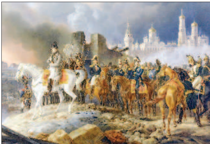
Наполеон в подожженной Москве

пании 1812 года в качестве лейтенанта наполеоновской армии. Тюно поделился собственной версией судьбы похищенных сокровищ. По его словам, они были сброшены французами в другое озеро, а в какое именно, министр затруднялся ответить. Но он вспомнил, что озеро нахо-