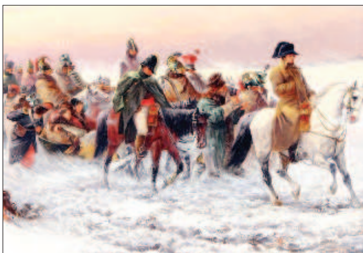
Армия Наполеона рассыпалась в снежных полях России

Но и эти поиски не дали кладоискателям никаких результатов. Сокровища наполеоновской армии так и не были найдены. Разумеется, история умалчивает о "кустарных" поисках сокровищ, которые в любом случае предпринимались местными жителями и всевозможными авантюристами в теч-