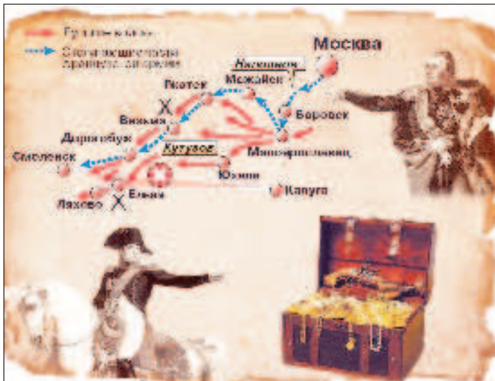
Путь золотого обоза

Версию де Сегюра о кладе в Семлевском озере подтверждает и другой французский генерал Луи-Жозеф Вьонне, участвовавший в Русской кампании 1812 года в звании майора наполеоновской армии. В своих мемуарах он вспоминает: "Армия Наполеона собирала все алмазы, жемчуг, золото и серебро из московских соборов". Таким образом,