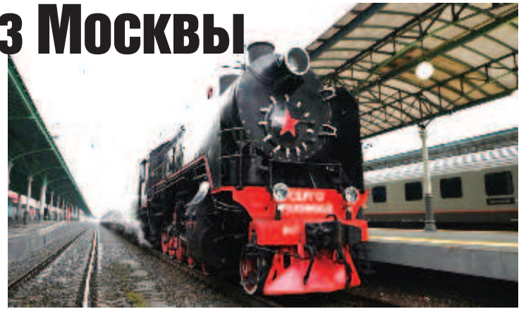
"Поезд Победы" поехал по городам России

С октября по ноябрь Поезд Победы проедет через 13 городов-героев и городов воинской славы, среди которых Псков, Мурманск, Архангельск, Санкт-Петербург, Керчь, Феодосия и Севас-