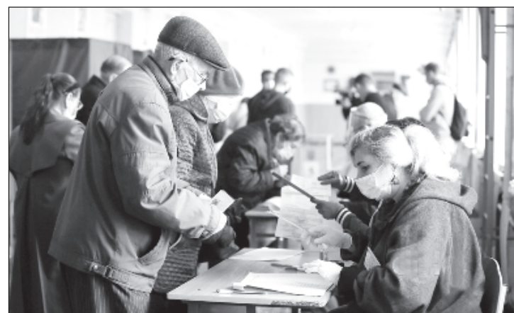
Явка на местные выборы на Украине составила 37 процентов

ный политический тренд сезона понятен - страна возвращается к противостоянию двух полярных сил - партии войны и партии мира, представленных сейчас "Европейской солидарностью" и ОПЗЖ". При этом он не считает, что перспективы у "третьей силы", которая представлена сейчас "Слугой народа", нулевые. "Но для того, чтоб "слугам" вернуть доверие, нужно много чего сделать и поменять. Но в это верится с трудом. И не исключено, что нишу займет уже другая политическая сила с другими лидерами", - предполагает Гужва.