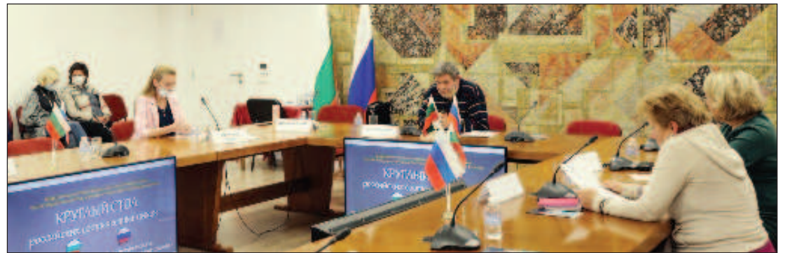
Участники круглого стола

Также участники круглого стола отметили ряд лингвистических явлений, с которыми им пришлось столкнуться на практике: при общении на двух языках доминирующий оказывает влия-