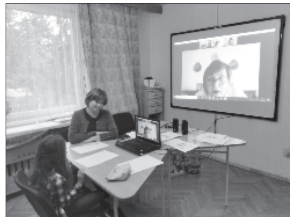
В "Маленькой школе" детям интересно

Маленькая школа - единственное место в Бол-