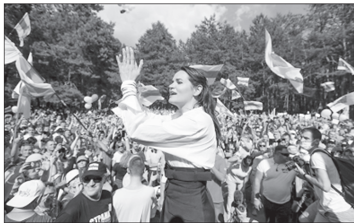
Светлана Тихановская объявила о начале общенациональной забастовки

Комментируя прошедший в конце прошлой недели марш оппозиции, Тихановская отметила, что жители Белоруссии готовы давать слово и отвечать за него.