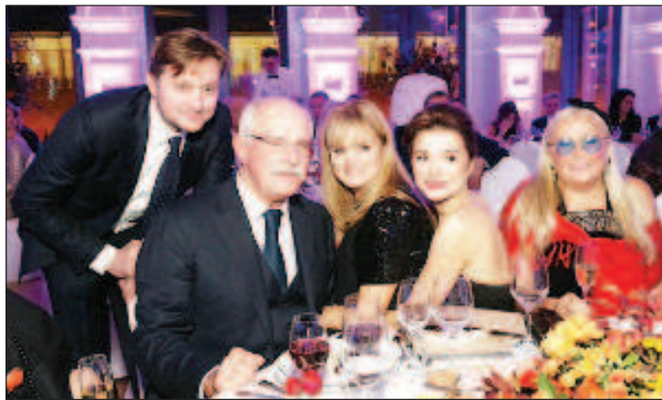
Никита Михалков с семьей

- Вообще Европарламент - это удивительная организация... Это потомки великих людей - и Данте, и Микеланджело, и Гете... Это страны, которые создали великую европейскую культу-