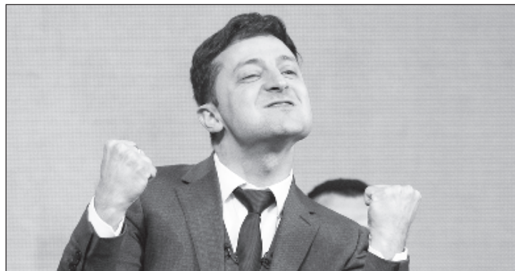
Зеленский заверил международных партнеров Украины в том, что его правительство даст отпор надвигающейся контрреволюции

"Те, кто возглавляет эту кампанию, хорошо известны. Это коалиция российских ставленников и известных украинских олигархов, которые считают угрозой деятельность антикоррупционных институтов. Они противятся интеграции в ЕС и НАТО, сотрудничеству Украины с МВФ и созданию основанного на правилах общества, что будет соответствовать интересам 99 процентов, а не одного процента жителей страны", - от-