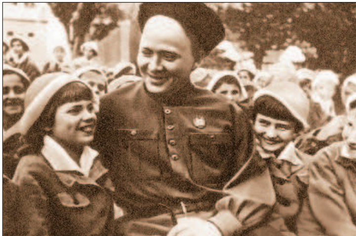
Гайдар с юными читателями повести "Тимур и его команда"