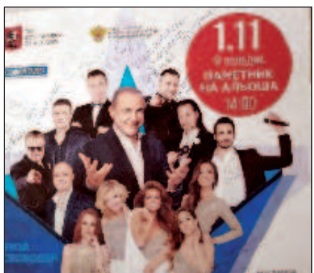
Автографы специально для наших читателей

Михаил Турецкий. По его мнению, музыке под силу навести мосты и укрепить связи между странами, вопреки разногласиям в политике и экономике и в этом состоит подлинная народная дипломатия.