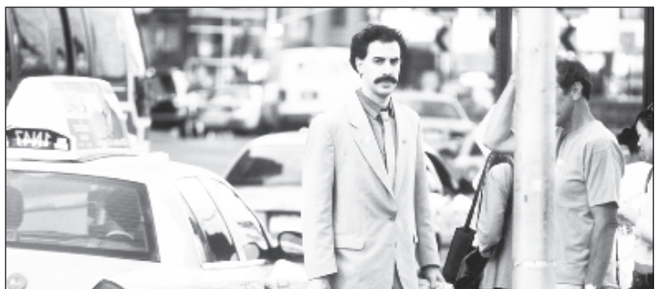
Эпизод из фильма "Борат-2"

Авторы продолжения фильма о Борате пытаются спровоцировать официальный протест властей Казахстана, так это поможет создать дополнительную шумиху вокруг ленты и повысить продажи билетов. Таким образом МИД Казахстана ответил на обращения возмущенных жителей страны, пишет Tengrinews.