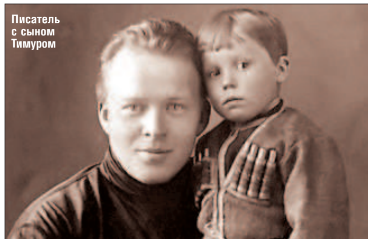
Писатель с сыном Тимуром

В 1947 г. писателя торжественно захоронили в городе Каневе. Правда, не все знают, что изначально последним пристанищем Гайдара должно было стать Новодевичье кладбище столицы. Однако в дело вмешался Центральный комитет Компартии Украины, настоявший на захоронении писателя в республике. Сколько раз предали Аркадия Петровича Гайдара, не сосчитать. Предали мальчики и девочки, выросшие на "Чуке и Геке" и "Тимуре и его команде" - став взрослыми, они не сохранили страну, за которую погиб писатель. Предал родной внук Егор, поживший жизнь на разрывание политических и экономических институтов советской власти. Предали журналисты и писатели, годами зарабатывавшие статьями о "палаче Гайдаре", о психически больном Гайдаре, об "изменнике" Гайдаре. Сегодня могила Аркадия Петровича находится на территории государства, которым правят идейные наследники тех, в боях с кем Гайдар погиб в октябре 1941 г.