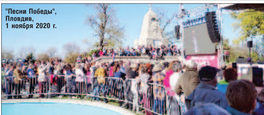
"Песни Победы", Пловдив, 1 ноября 2020 г.

"Песни Победы - это не просто слова, положенные на музыку. Это наша история, наша память, которая объединяет несколько поколений. День Победы всегда был и остается для нас священным праздником. Это не только дань уважения павшим и живым участникам войны, но и победа над новыми историческими вызовами", - считает