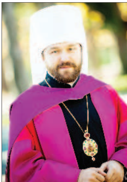
Митрополит Волоколамский Иларион

- Во Франции произошла целая серия атак, которые уже назвали террористическими актами. К чему может привести это религиозное противостояние двух цивили-