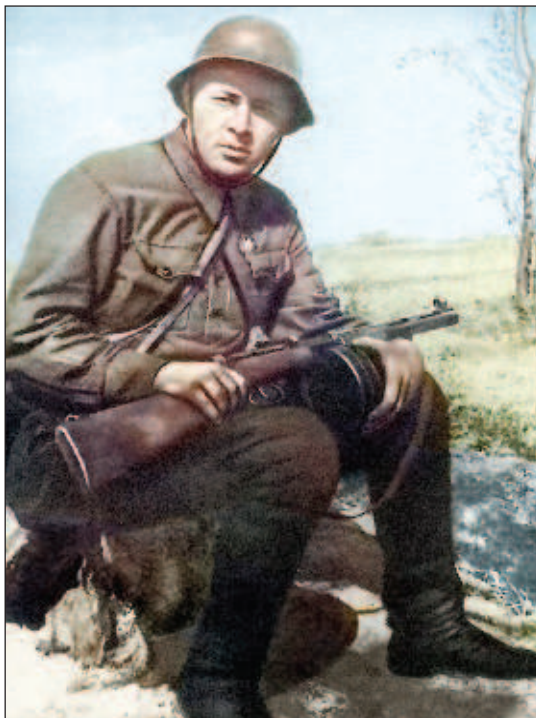
На фронте Отечественной войны

В 1940 году в СССР вышел фильм "Тимур и его команда" по сценарию Аркадия Гайдара. Не все знают, но популярная повесть создана на основе сценария, который автор написал раньше. Интересно, что "Тимур и его команда" тоже не всем понравился. На Гайдара написали донос - мол, автор подменяет пионерскую организацию какими-то подпольщиками. Дело дошло до самого Сталина, который произведение одобрил. Аркадий Петрович, похоже, импонировал Иосифу Виссарионовичу своей независимостью. Когда остальные лезли из кожи вон, славя вождя, Гайдар Сталина не упоминал вообще, говоря в