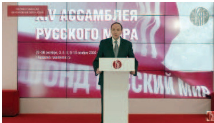
Открывая торжественную церемонию, председатель правления фонда "Русский мир", председатель Комитета Госдумы по образованию и науке Вячеслав Никонов подчеркнул, что она неслучайно проходит в таком удивительном месте на Поклонной горе, которое свято для каждого русского человека

"Ваши форумы давно уже стали значимым, ожидаемым событием в жизни