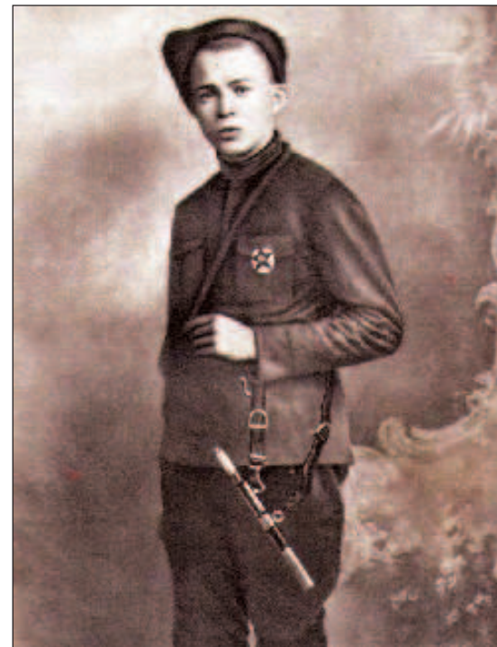
16-летний командир в Гражданской войне

Оборона Киева закончилась для Красной Армии тяжелым поражением, окружением и разгромом огромной