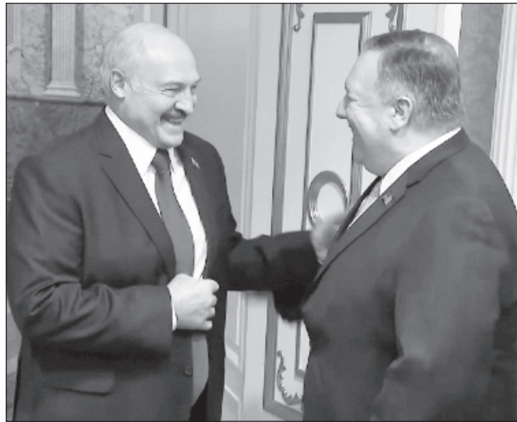
Лукашенко не скрывал радости от встречи с Помпео

тин Скоркин отметил, что главная его цель - демонстрация позитивной двусторонней повестки - достигнута. "Госсекретарь показал, что, независимо от импичмента, Белый дом дорожит отношениями с Украиной и от помощи Киеву не отказывается. Для Зеленского главной задачей на переговорах было выпутаться без потерь из истории с отношением к импичменту и сохранить поддержку американцев", - пояснил РИА Новости эксперт.