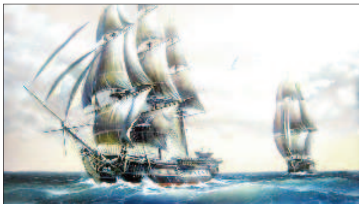
Шлюпы "Мирный" и "Восток"