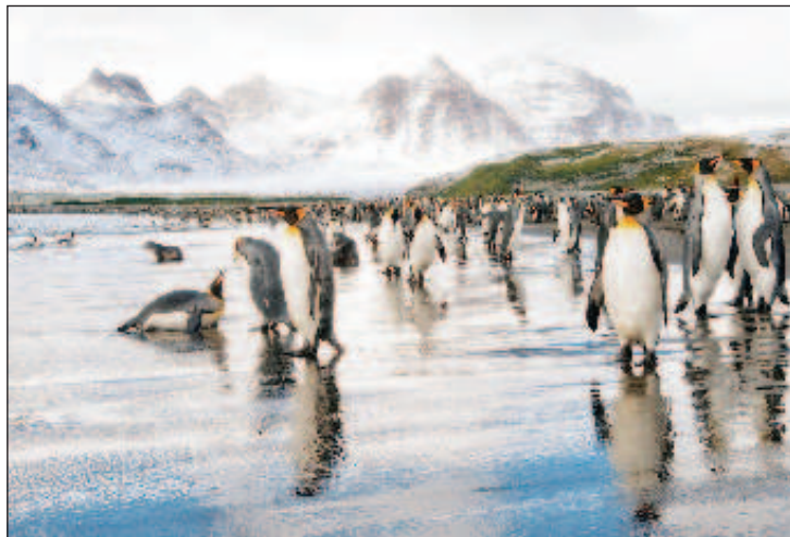
Императорские пингвины - хозяева Ледяного материка