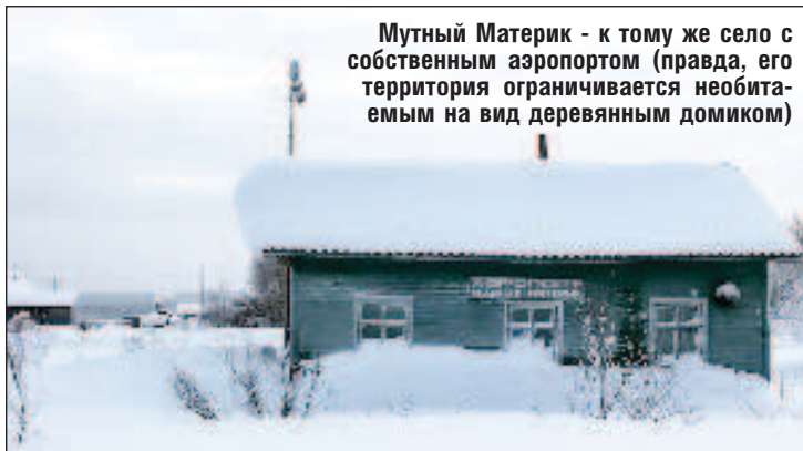
Мутный Материк - к тому же село с собственным аэропортом (правда, его территория ограничивается необитаемым на вид деревянным домиком)

"Мы плыли на теплоходе. По иронии судьбы теплоход назывался "Светлый" и плыл к Мутному! Когда высадились на берег, моему взору открылась великолепная картина. Село расположилось на берегу реки. Поразила пестрота и яркость сельских домов: они были разноцветные: желтые, голу-