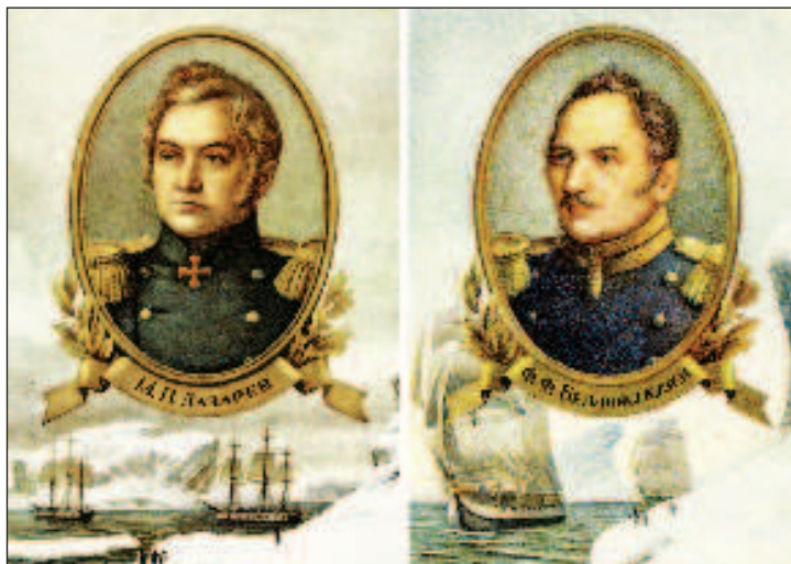
Михаил Лазарев и Фаддей Беллинсгаузен

Получив высочайшее одобрение, Крузенштерн незамедлительно приступил к подготовке экспедиции. Он действительно торопился, потому что знал, что через полвека после путешествий Кука Европа снова готовилась к исследованию южнополярных морей - и нужно было спешить, чтобы завоевать приоритет. Крузенштерн писал: "Славу такого предприятия не должны мы допускать отнять другим у нас, она в продолжение