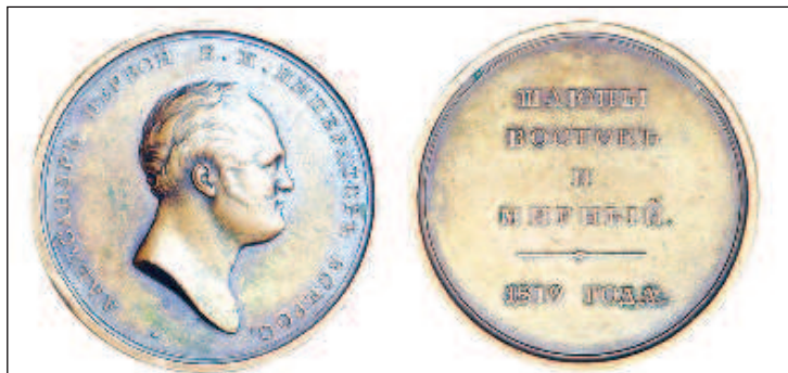
Памятная медаль с образом Александра I в честь открытия Антарктиды

краткого времени достанется непременно в удел англичанам или французам. Более дерзкого замысла история русских морских путешествий не знала. Это была первая крупная корабельная экспедиция, снаряженная за государственный счет.