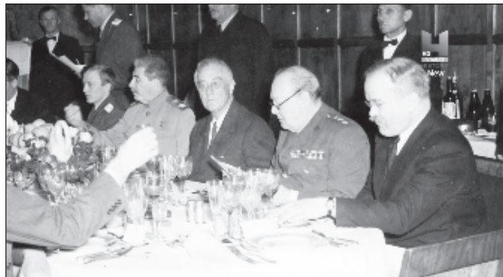
Трое лидеров за щедрым обеденным столом