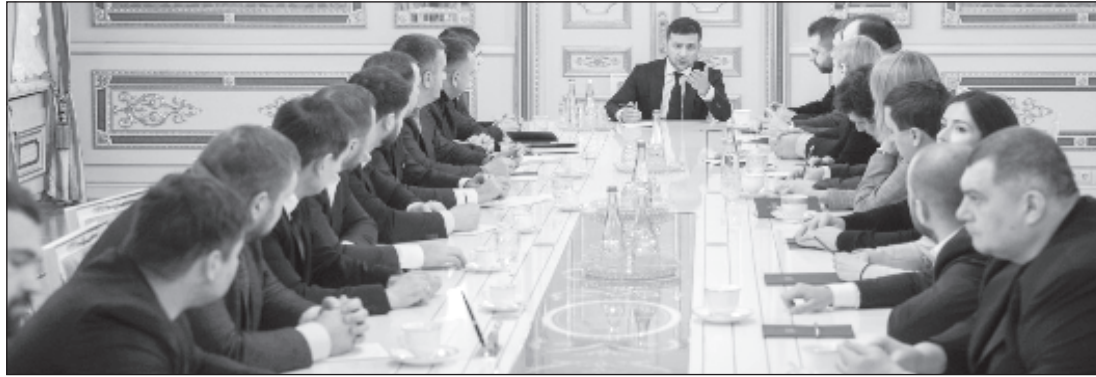
Заседание правительства Украины с участием президента Владимира Зеленского

В команде Зеленского зреет раскол. Как в нем замешаны американские и украинские миллиардеры?