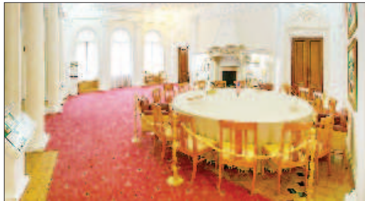
Зал роковых переговоров