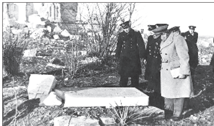
Черчилль на Английском кладбище в Крыму, разрушенном бомбардировками