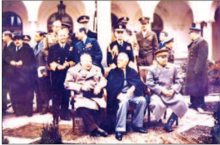
Черчилль, Рузвельт и Сталин в парке Ливадийского дворца

Сталин понимал, что добрые отношения с Западом могут прекратиться вслед за исчезновением общего врага. А значит, к этому моменту растаковка сил в Европе должна быть максимально комфортной для Советского Союза. Когда коллеги стали предлагать место для проведения новой встречи на высшем уровне, вождь народов находил обоснования для отклонения вариантов. Говорят, что на идею провести встречу в Шотландии Сталин даже съезвил, что не слыш-