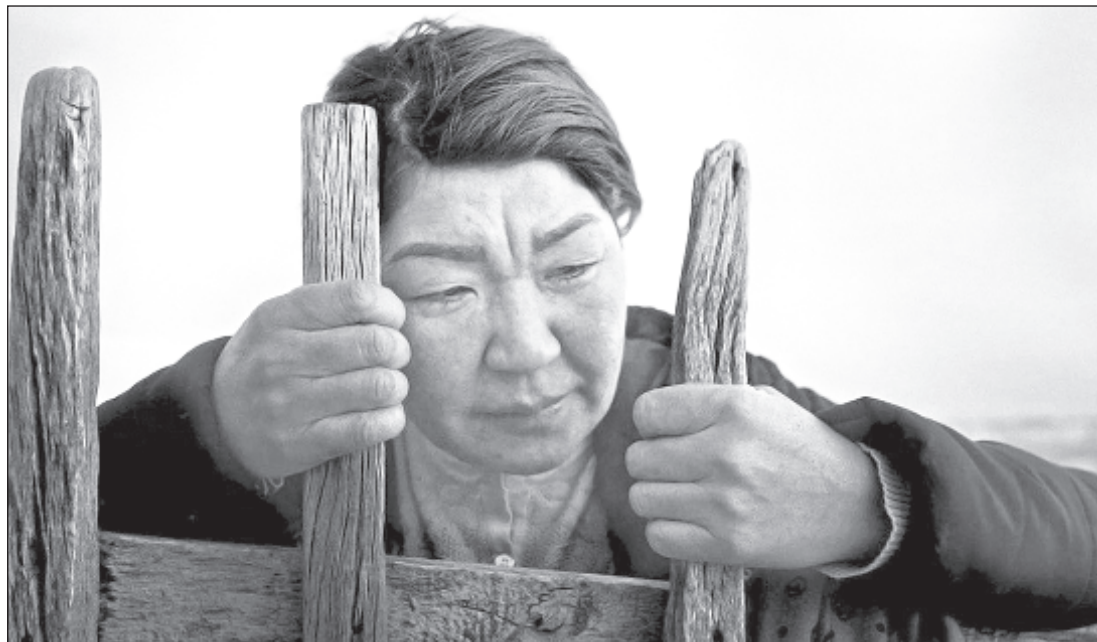
Кадр из фильма "Марьям"