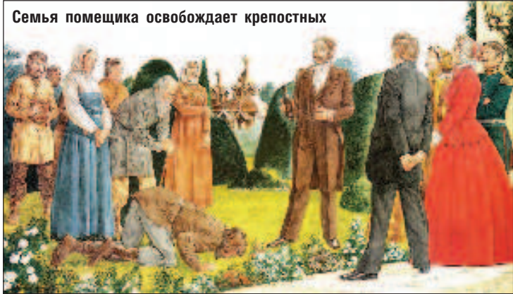
Семья помещика освобождает крепостных

лючается в том, что не только крестьяне были зависимы от помещиков, но и дворянство несло определенные повинности по отношению к крепостным. Нельзя было морить крестьян голодом, в случае неурожая помещик был обязан помогать крепостным хлебом и посевным зерном. Домашнюю прислугу в старости требовалось содержать за счет хозяина, даже если эти люди уже не могли работать так, как раньше. После пожаров, бывших нередкими в русских деревнях, помещик должен был дать пострадавшим крестьянам лес на строительство нового дома. Множество проявлений недовольства крестьянства после отмены крепостного права были связаны не с мифическими революционными настроениями, а с потерей привычного покровительства, на которое крестьянин мог рассчитывать в трудную минуту. Ведь, став свободным, он одновременно лишился защиты и отныне мог надеяться только на себя. ("Взгляд")