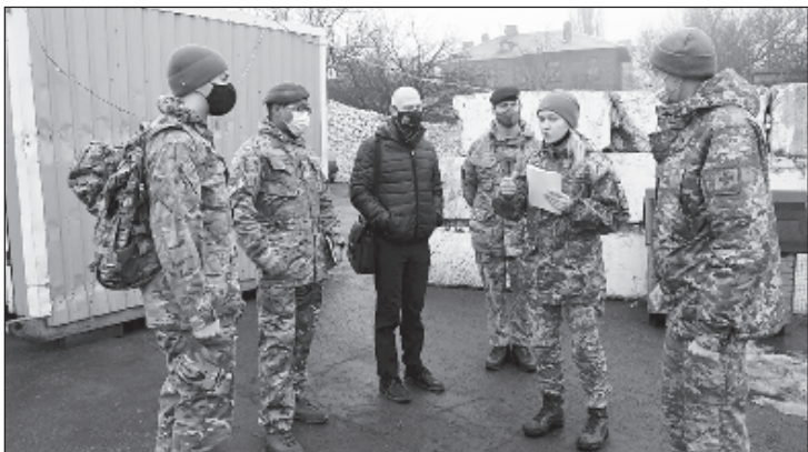
Британские военные засветились в Донбассе

Она создана на основе аденовируса, в который встроены гены коронавируса. При попадании в клетки он образует в них белки - они вызывают реакцию иммунитета и способствуют развитию антител.