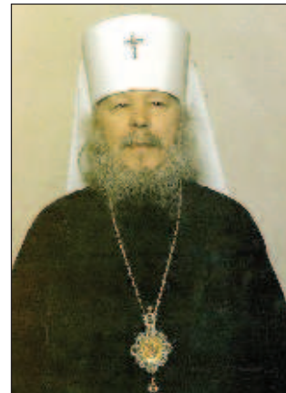
Санкт-Петербургским и Ладозским, постоянным членом Священного синода, публицистом, одним из основателей Петровской академии наук и искусств и историком Церкви.

...Цветы духа - и душистый небесный мёд, питающий душу, прохладные рощи православной мысли, но и сила, позволяющая сокрушать клеветующих и злокозненных: многое да-