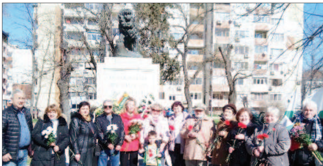
Стара-Загора. Чествания 3 марта

3-го марта - в День освобождения Болгарии от турецкого рабства СНЦ "Русский клуб - Стара-Загора" ежегодно участвует в официальной городской церемонии и возлагает цветы признательности к подножию величественного мемориала "Защитники Стара-Загоры" и к памятнику подп. Калитину, русским солдатам, офицерам и болгарским ополченцам. Этот памятник был построен в 1927 году к 50-летней годовщине сражений за город 31 июля 1877 года. Он выполнен в форме саркофага, на котором стоит бронзовый лев, символизирующий гордый болгарский народ. Монумент хранит память о небывалом героизме