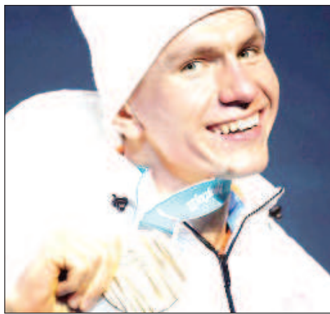
Александр Александрович Большунов на Олимпиаде в Пхёнчхане. Трехкратный серебряный призер Олимпийских игр (2018). Чемпион мира (2021). Четырехкратный серебряный призер чемпионата мира (2019). Двукратный чемпион мира по бегу на роликовых лыжах. Заслуженный мастер спорта России

Александр Большунов родился 31 декабря 1996 года в деревне Подвыотье Севского района Брянской области. На лыжи Александра поставил его отец, который сам хорошо на них бегал. Именно Большунов-старший лично проложил и самую пер-