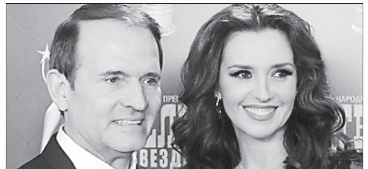
Виктор Медведчук и его жена телеведущая Оксана Марченко

Совет национальной безопасности и обороны ввел санкции против главы Медведчука и его жены телеведущей Оксаны Марченко. Секретарь ведомства Алексей Данилов заявил, что данные меры были приняты из-за расследования Службы безопасности Украины о финансировании терроризма. Также санкции были введены против телеканалов "112 Украина", ZIK и NewsOne, принадлежащих