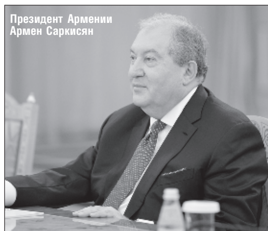
Президент Армении Армен Саркисян

10 марта Пашинян заявил, что Гаспарян считается уволенным, несмотря на отказ президента утвердить решение. Он подчер-