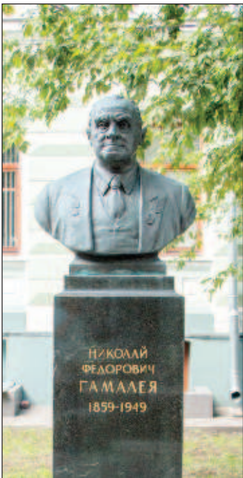
НИКОЛАЙ ФЕДОРОВИЧ ГАМАЛЕИ 1859-1949

Альберто Фернандес напомнил, что российская вакцина позволит защитить людей от пандемии. Он обратился с призывом к жителям страны последовать его примеру.