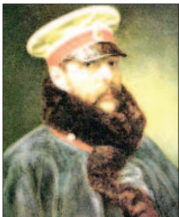
Александр II - Царь Освободитель

Ровно 160 лет назад произошло одно из величайших событий в истории России - было отменено крепостное право. 3 марта 1861 г. император Александр II подписал документ, к которому русская история шла на протяжении всего XIX столетия - Манифест об отмене крепостного права. С этого дня началась одна из самых значительных реформ Александровской эпохи, а главным вдохновителем реформы Александр II получил имя "Освободитель". На этой же дате, 17 лет позже, после победоносной Русско-турецкой войны, и Болгария назовет его своим Освободителем.