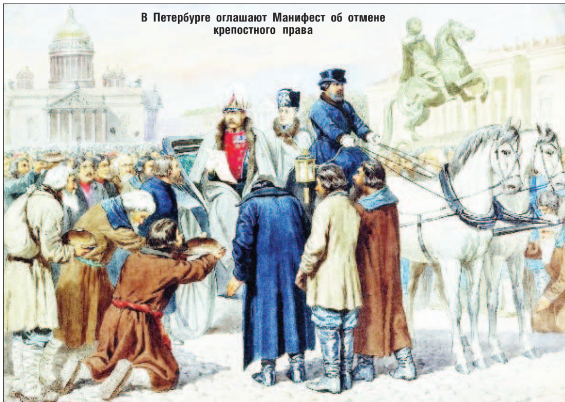
В Петербурге оглашают Манифест об отмене крепостного права

крепостничество продолжает преследовать нас по сей день. Вспоминая о крепостном праве, важно понимать, что за последние двести лет оно превращено в клеймо, которое любят ставить на Россию и русский народ, приписывая власти неизменное стремление к угнетению, а народу - "извечные рабские чувства". Крепостничество не было уникальной русской особенностью. Его аналоги существовали в Центральной и Восточной Европе, в Азии, а избавление от них случилось примерно в тот же исторический период, что и освобождение русского крепос-