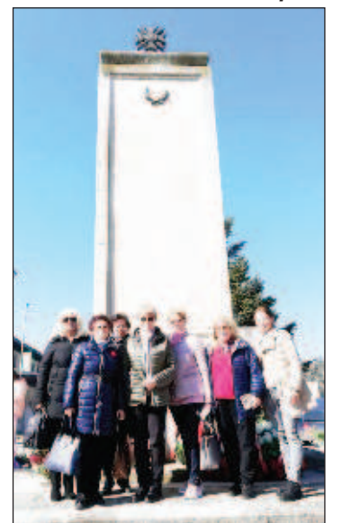
Русский клуб г. Свиленграда почтил память героев в Освободительной Русско-турецкой войне 1877 -1878 гг.