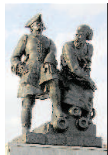
Памятник Петру I и Никите Демидову в Невьянске