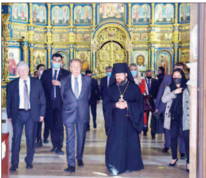
православным храмом в Центральной Азии.