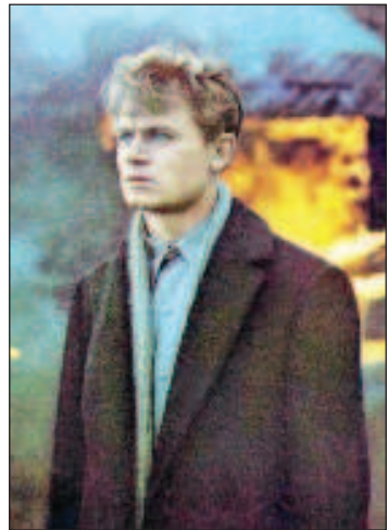
В роли Есенина

тались по булыжной мостовой переулка Сивцев Вражек на тупых коньках, привязанных к валенкам. Цеплялись за бампера проезжающих машин. Иногда за такой машиной катился целый паровозик ребят, уцепившихся друг за другом. Порой такой кортеж мог доехать до Гоголевского бульвара. Играли в ножички. Дрались. Любили с ребятами бегать по крышам. Однажды даже попробовал стать парашютистом. Стянул дома две простыни, сшил их