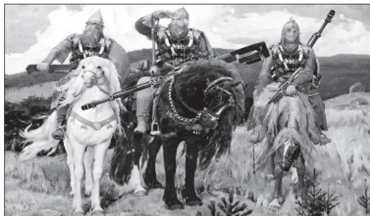
Три русских богатыря оказались украинцами

Добрыню исследователи сравнили с воеводой и дядей князя Владимира Вели-