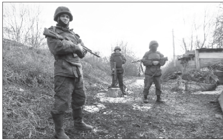
Обстановка в Донбассе остается сложной

Арестович добавил, что сценарий, по которому сейчас идет Украина, согласован с ее партнерами. Это - политико-дипломатический путь при всей его сложности и "даже частично, как кажется, призрачности", а также "прокачка" сектора национальной безопасности и обороны, чтобы быть гото-