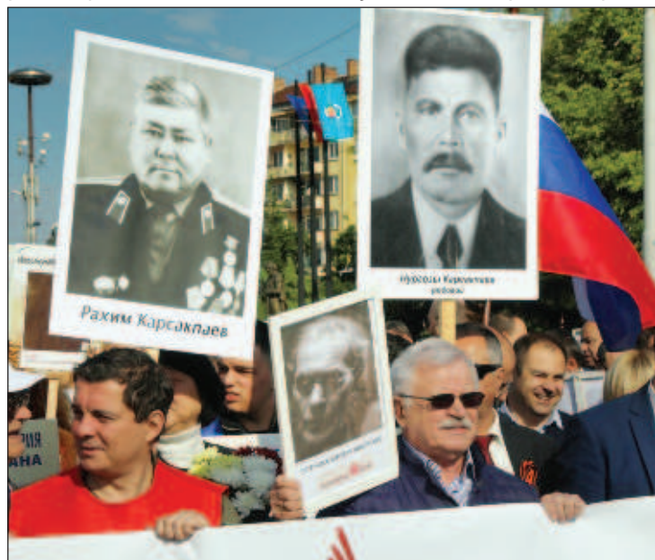
В акции "Бессмертный полк" в Софии, 9 мая 2017 г.

На вопрос журналистов: как планируете отмечать юбилей, отвечает: "Утром в день рождения должен прилететь из Крыма, где проходят съемки одного проекта. А вечером буду играть спектакль "Калина красная" в театре Надежды Бабкиной "Русская песня". Это не традиция встречать день рождения на сцене - просто так совпало по датам". Приятно отметить тот факт, что Сергей Петрович неоднократно бывал в Болгарии и здесь его знают не только по фильмам. Как отмечают те, кто его хорошо знает: он - простой русский парень, которому веришь как на экране, так и в жизни. Присоединяемся к поздравлениям!