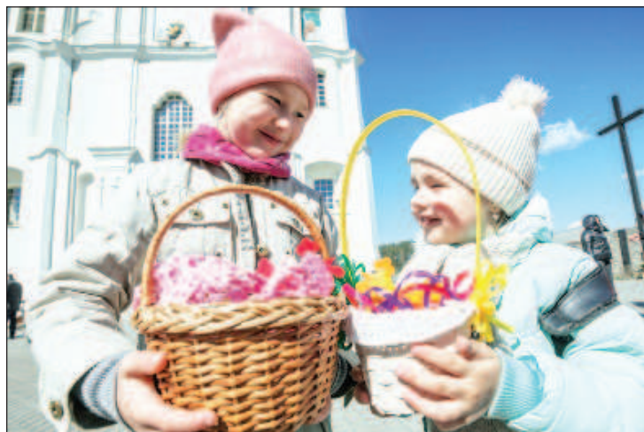
В Великую Субботу в продолжение всего дня в храмах совершается освящение куличей, пасок и яиц

верг совершается служба, которую можно было бы назвать "Моление в Гефсимании". Мы выходим на середину храма, точно в Элеонский сад. Мы читаем двенадцать Страстных Евангелий, вспоминая как Христа