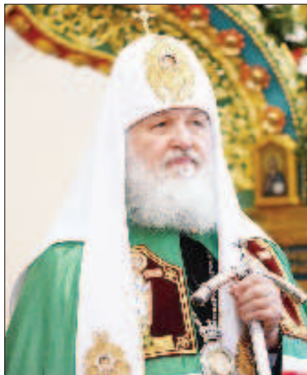
Святейший Патриарх Московский и всея Руси Кирилл

- Старшее поколение помнит, какой реальный гражданский конфликт разворачивался вокруг Белого дома. Тогда ко мне - а я был постоянным членом Священного Синода и председателем Отдела внешних церковных связей, которому было поручено взаимодействие и с Правительством, и с общественными организациями, - пришла делегация депутатов с просьбой возглавить политическую борьбу, - рассказал Первоверховный.