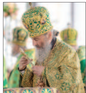
Блаженнейший Митрополит Онуфрий

18 апреля 2021 года пресс-секретарь Президента Украины Юлия Мендель в программе "Взгляд с Банковой" (телеканал "Дом") прокомментировала результаты встречи президентов Украины и Франции. Рассказывая о видении ближайших шагов по урегулированию конфликта на Донбассе, она выразила надежду на проведение обмена пленными в формате "всех на всех" на Пасху.