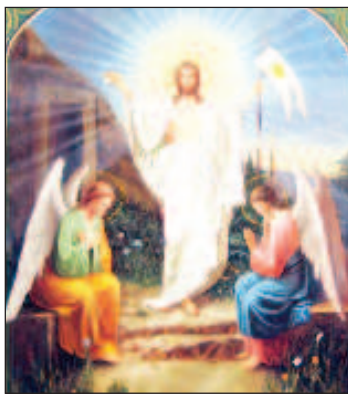
Воскресение Христово (Пасха) - это самый главный христианский праздник, установленный в воспоминание Воскресения Иисуса Христа из мертвых

верг совершается служба, которую можно было бы назвать "Моление в Гефсимании". Мы выходим на середину храма, точно в Элеонский сад. Мы читаем двенадцать Страстных Евангелий, вспоминая как Христа