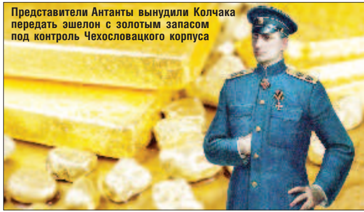
Представители Антанты вынудили Колчака передать эшелон с золотым запасом под контроль Чехословацкого корпуса

Парламентским запросом Лодгманна заинтересовался лондонский журнал Economist (30.05.1925), который обвинил чехословацкий "Легионбанк" в том, что своим богатством он обязан именно русскому царскому золоту. Этот банк был учрежден в 1919 г., как банк Чехословацкого легиона. "В одном из документов штаба 1-й дивизии говорится о тайной перевозке на корабле "Шеридан" из Владивостока в Триест 750 ящиков. Данная перевозка была осуществлена летом 1920 г. Из Триеста груз был перевезен в Чехословакию в санитарном эшелоне - под койками солдат, в диагнозе которых было указано психическое расстройство".