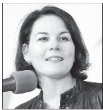
Кандидат в канцлеры ФРГ Аннелена Бэрбок

"К сожалению, имеем отказ как по предоставлению Киеву оборонного вооружения, так и по НАТО. Это разочаровывает", - написал он. Также Мельник добавил, что настало время отбросить "иллюзии об изменении политики Берлина" после выбо-