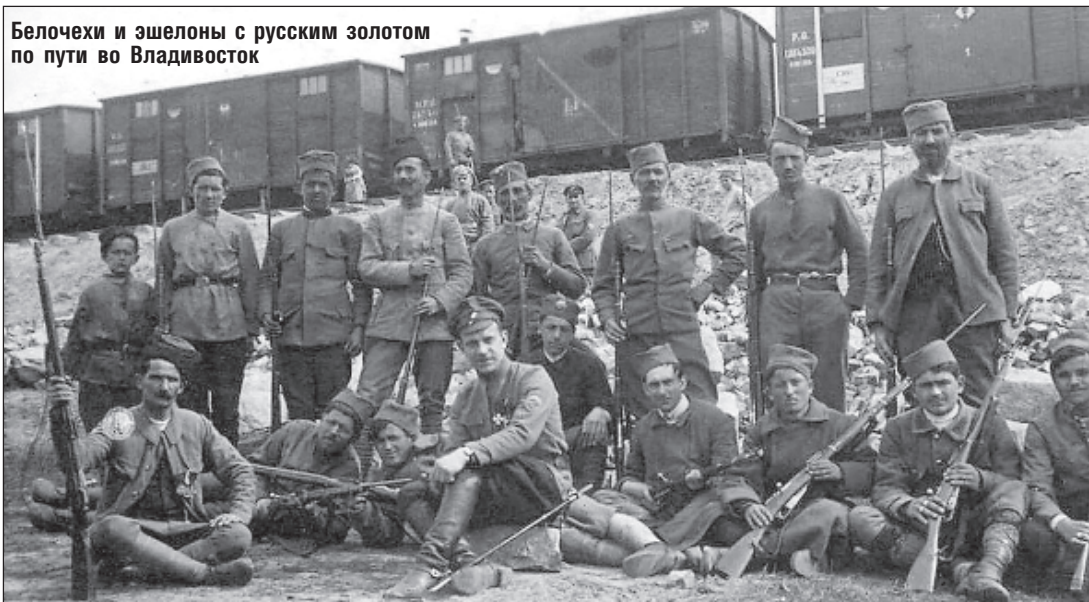
Белочехи и эшелоны с русским золотом по пути во Владивосток

дней передали адмирала большевикам, которые его казнили.