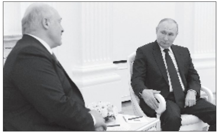
Переговоры лидеров России и Белоруссии продолжились около четырех часов

Лукашенко отметил, что во время встречи с главой России Владимиром Путиным не