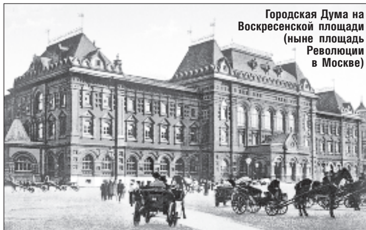
Городская Дума на Воскресенской площади (ныне площадь Революции в Москве)

Столь сложную систему придумали по предложению главы правительства Сергея Витте, опасавшегося, что "в крестьянской стране, где большинство населения не искушено в политическом ис-