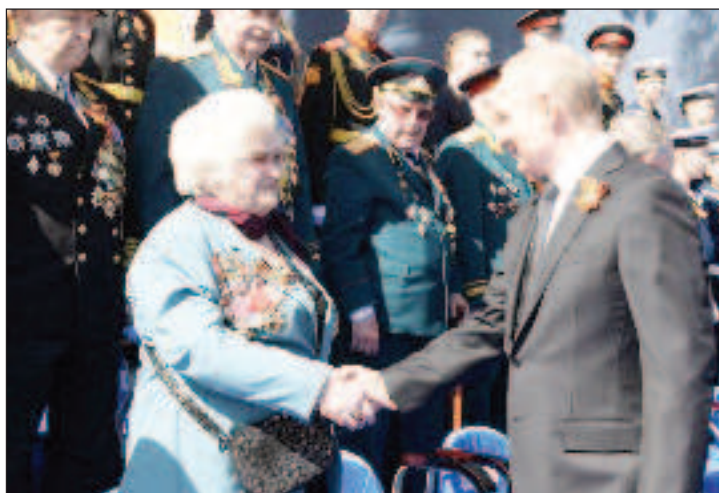
На параде Победы на Красной площади в 2018 году