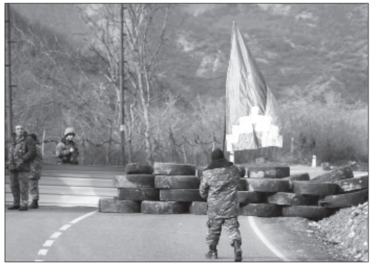
Армянский пост по линии соприкосновения Азербайджана и Армении

27 мая власти Азербайджана заявили о задержании на приграничной терри-