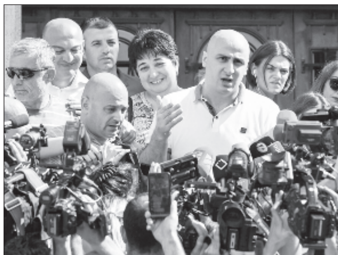
Никанор Мелия объявил перед журналистами решение ЕНД прекратить бойкот парламента

подпишет документ о выходе из политического кризиса в Грузии, который поддержали правящая партия и другие оппозиционные силы.