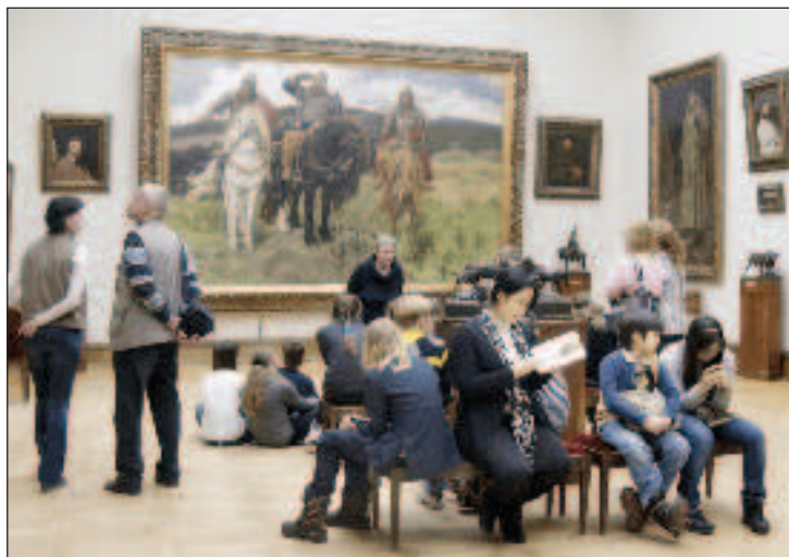
Зал художника Васнецова в галерее

ние современному искусству, коллекционер упорно отслеживал и щедро приобретал все лучшее, что появлялось на художественном рынке. Со временем его безупречный и тонкий вкус, безошибочный выбор и благородство намерений принесли ему особый авторитет и особую привилегию, которой не имел больше никто из коллекционеров: Третьяков получил право первым смотреть новые работы художников до их публичных показов. И, конечно же, каким волнующим событием был визит Павла Михайловича к художникам, с каким трепетом они - начинающие или опытные, ждали его тихой фразы: "Прошу Вас картину считать за мной". И для каждого из них это было равнозначно общественному признанию. Художники довольно часто шли на уступки коллекционеру, снижали свои цены, а Третьяков, как настоящий купец, никогда не покупал, не торгуясь. Таким образом их поддержка была обоюдной. Нельзя не сказать, что у собирателя совсем не было просчетов, отнюдь, делая упор на творчество передвижников и связывая с ними будущее русской школы живописи, Третьяков почти не приобретал работы художников академического направления, а также недостаточно внимания уделил и Айвазовскому.