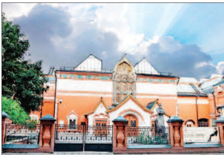
Знаменитая Третьяковка в Лаврушинском переулке в Москве

Примечательно, что специально живописи или искусству братьев не учили, они получили домашнее образование и воспитание, преимущественно практического характера. И тем не менее, Павел обладал широкими познаниями в области литературы, живописи, театра и музыки. Как отмечал в 1873 художник Иван Крамской: "Я должен сознаться, что это человек с каким-то, должно быть, дьявольским чутьем". И если сначала Третьяков покупал работы старых голландских мастеров, находясь в поиске своего направления, стиля, то после того, как увидел у питейского коллекционера Прянишникова полотно Венецианова, Тропинина, Кипренского, его решение обрело отчетливые формы. На свой интересный путь Павел Михайлович вступил, когда