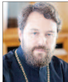
Митрополит Волоколамский Иларион