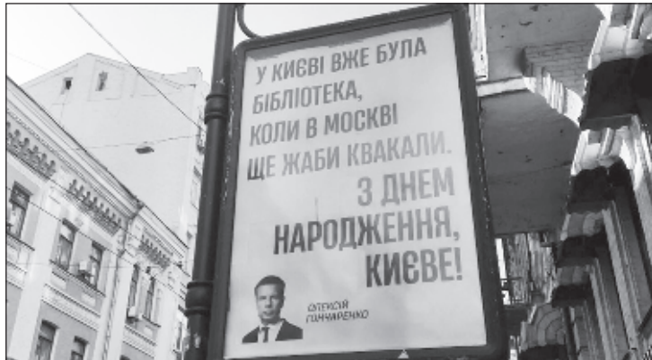
Один из "шедевров" Гончаренко

Ранее депутат Верховной Рады Алексей Гончаренко опубликовал в социальных сетях свое фото в боксерских перчатках и заявил, что таким образом готовится