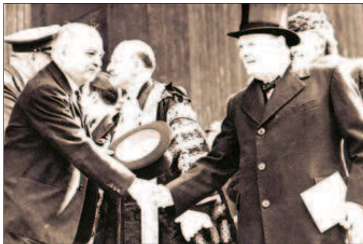
При встрече с Черчиллем в 1940 г. посол СССР в Лондоне Иван Майский уже знал о планах бомбить Баку