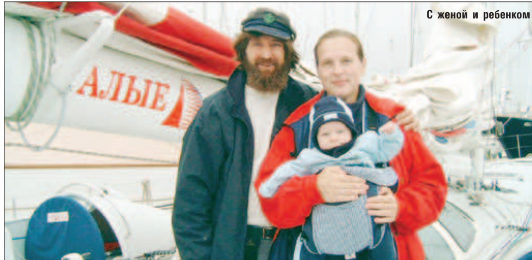
С женой и ребенком

- Так, наверное, у него не было семьи, - предположил один мой приятель, услышав мой восторженный рассказ о Конюхове.