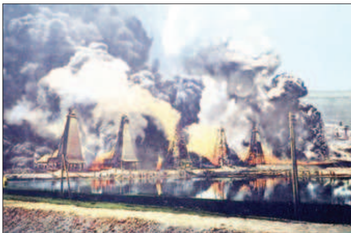
Добыча нефти в Азербайджане в довоенные годы

Несмотря на это, представители правых кругов как во Франции, так и в Великобритании выступали за то, чтобы рассматривать СССР как военного союзника Германии и использовать против него военную силу. Начиная с ноября 1939 года советская резидентура в Европе докладывала в Москву, что во Франции и Великобритании ведется проработка конкретных шагов в этом направлении. Активность подготовки была резко увеличена после начала советско-финской войны. В январе 1940 года премьер-министр Франции Эдуард Даладьё поручил главнокомандующим сухопутными и морскими силами Франции Морису Гамелену и Франсуа Дарлану подготовить план удара по советским нефтепромыслам, дабы