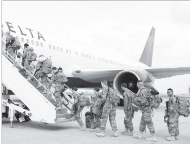
Лето 2014 года. Солдаты армии США покидают аэропорт "Манас"

База США была открыта в бишкекском аэропорту Манас в 2001 году. Она предназначалась для поддержки операции "Несокру-