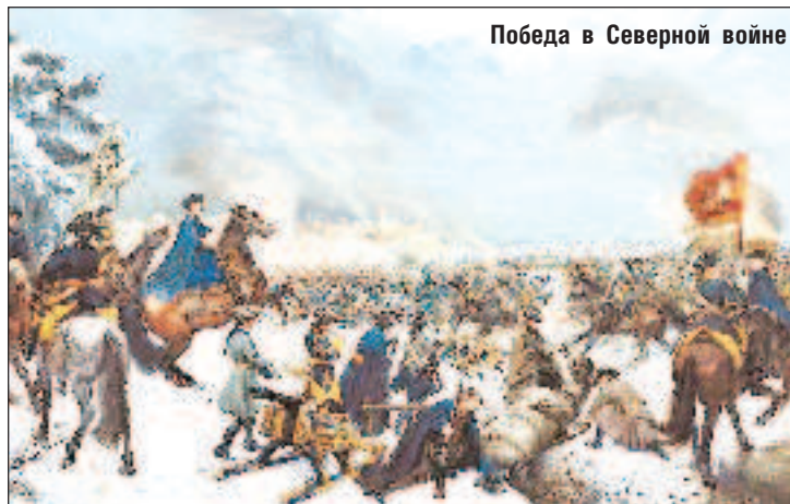
Победа в Северной войне

Введение рекрутской повинности, создание военно-морского флота, учреждение Военной коллегии, ведавшей всеми военными делами. Введение с помощью "Табели о