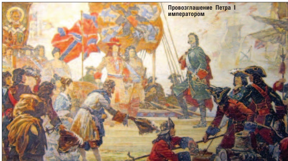
Провозглашение Петра I императором

Казанскую, Ингерманландскую (впоследствии Санкт-Петербургскую), Архангелогородскую, Смоленскую, Азовскую, Сибирскую. Они управлялись губернаторами, ведавшими войсками, расположенными на территории губернии, а также обладавшими всей полнотой административной и судебной власти. На втором этапе реформы губернии были поделены на 50 провинций, управляемых воеводами, а те делились на дистрикты, руководимые земскими комиссарами. Петром I были образованы новые судебные органы. Была установлена самостоятельность процесса и не-