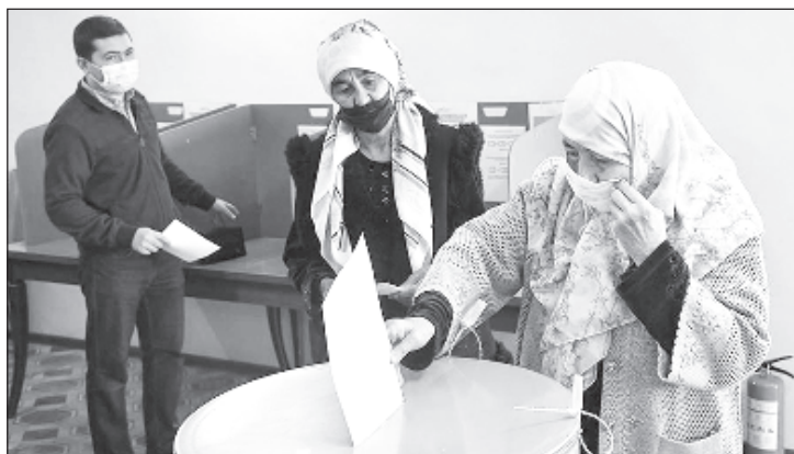
На выборах президента Узбекистана

Президентские выборы в Узбекистане проводятся раз в пять лет. Фаворитом нынешнего голосования считается действующий глава государства Шавкат Мирзи-еев.