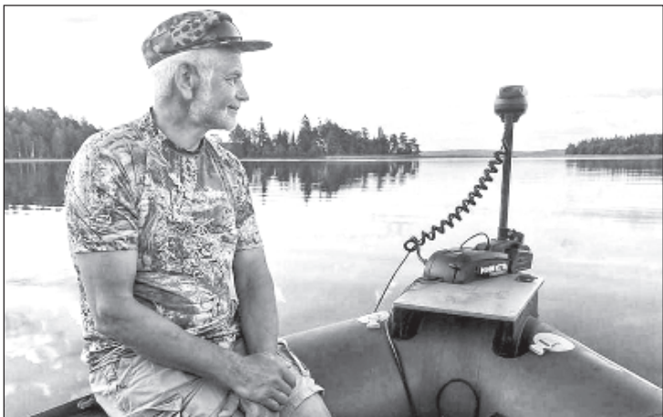
Российские пограничники задержали мэра Клайпедского района Литвы Бронюса Маркаускаса и двух его друзей в Куршском заливе и обвинили в нарушении российской границы

Мэр Клайпедского района Литвы Бронюс Маркаускас подтвердил, что нарушил российскую границу в Куршском заливе во время рыбалки. Об этом он напи-