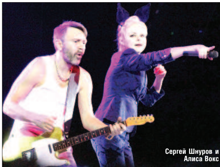
Сергей Шнуров и Алиса Вокс

Алиса отметила, что сейчас у кого больше подписчиков, тот и прав. "Шнуров воспользовался своим медиапреимуществом и практически уничтожил меня. Я не смогу этого ему простить,