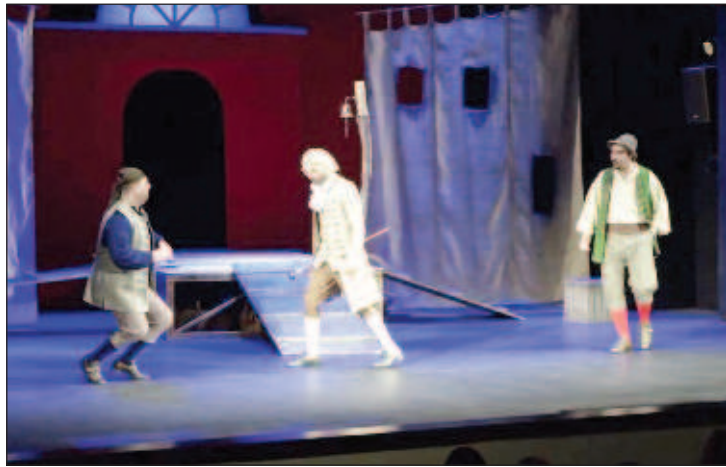
В первый фестивальный вечер гости из Армении порадовали искромётной постановкой мольеровской пьесы "Плутни Скапена"

В 15-й раз в столице Мордовии проходит XV Международный Фестиваль русских драматических театров стран ближнего и дальнего зарубежья "Соотечественники". Его участниками стали актерские коллективы из четырех государств: России, Армении, Абхазии, Казахстана. Организованный в режиме COVID-free театральный форум впервые проходит без аншлага: в соответствии с санитарными предписаниями зал заполнен наполовину, а зрители на входе вместе с билетами предъявляют QR-коды. Юбилейный фестиваль открылся лишь с третьего раза: он должен был состояться еще в апреле 2020-го, но из-за пандемии дважды переносился. Хозяева фестиваля - актеры Государственного русского драматического театра Мордовии - представят свою работу "Васса" по пьесе Горького. Ульяновский театр им. Гончарова привез спектакль