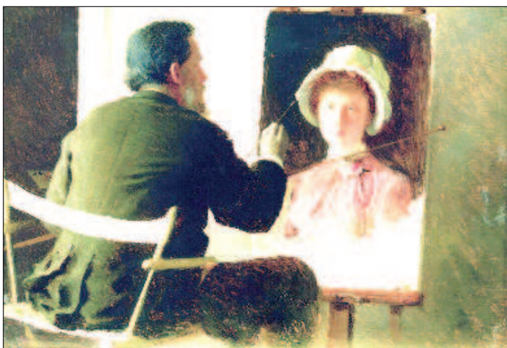
Картина Крамского "Отец, пишущий портрет своей дочери"

пехом принимала участие в выставках художественных выставках самого высокого уровня - в Академии художеств, в Обществе живописцев-акварелистов, в художественном отделе Всероссийской ярмарки в Нижнем Новгороде и др. Была она известна и как книжный иллюстратор, оформляя, например, издания к юби-