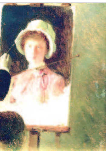
Картина Крамского "Отец, пишущий портрет своей дочери"