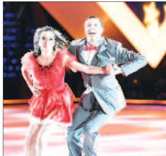
Ксения Бородина и Дмитрий Соловьев