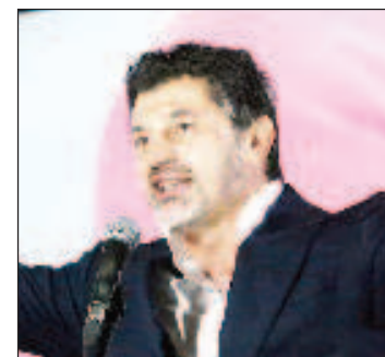
Действующий мэр Тбилиси Каха Каладзе набрал 55,6 процента голосов

Протестующие против итогов второго тура муниципальных выборов, на которых в 19 из 20 муниципалитетах