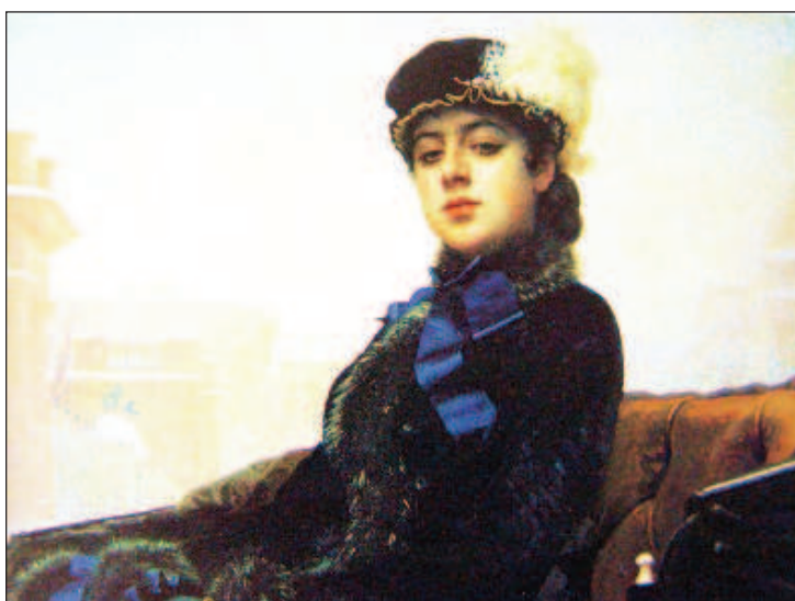
Самая известная картина Ивана Николаевича Крамского "Портрет незнакомки"