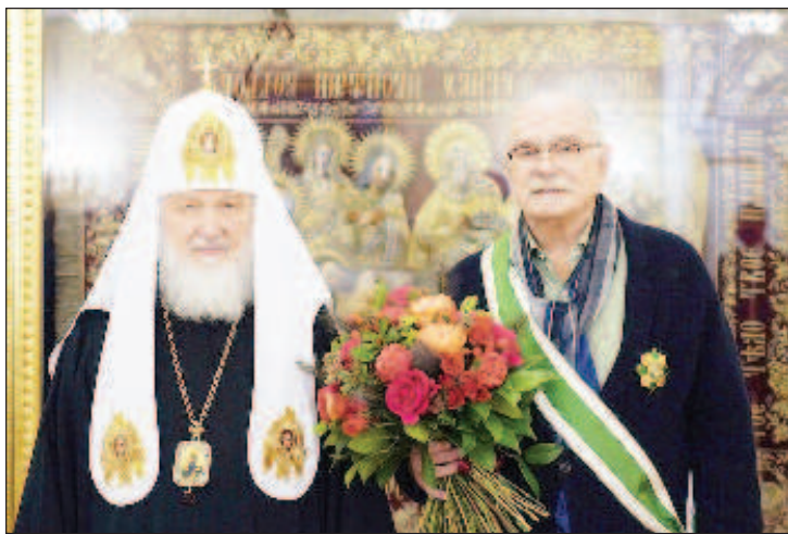
Патриарх Кирилл и Никита Михалков

Вручая Н.С. Михалкову награду, Святейший Патриарх Кирилл сказал: "Кроме личных добрых отношений я очень ценю тот вклад, ко-