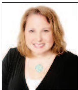
Посол США в Белоруссии Джулия Фишер

Отношения между Минском и Вашингтоном обострились после событий лета 2020 года, когда белорусские власти подавили митинги против результатов президентских выборов в стране. Американская сторона осудила действия Минска и ввела санкции, направленные против действующего президента Александра Лукашенко.