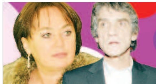
Лариса Гузеева, Валерий Гаркалин

"Официально заявляю: я никогда и нигде не говорила, не писала постов о том, что Гаркалин покупал сертификат о вакцинации. И уж тем более, не заявляла о том, что он поделился со мной такой информа-