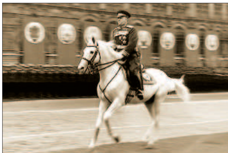
Маршал Жуков принимает Парад Победы на Красной площади

па армий "Север" исчерпала свои наступательные возможности. Жуков сохранил за Ленинградом шанс на дальнейшую борьбу и в конечном счете - шанс на будущую победу.