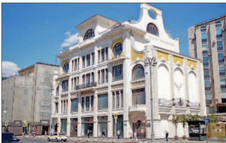
Так выглядит сегодня дом Ивана Сытина на Тверской улице, где до революции располагались газета "Русское слово" и книжный магазин, в первые годы советской власти - редакция газеты "Правда", а потом - газеты "Труд"