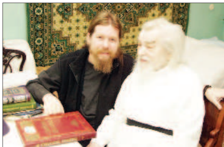
Митрополит Псковский и Порховский Тихон (Шевкунов) и Архимандрит Иоанн Крестьянкин

Напомним, что в сталинские лагеря за веру воспитанник Московской духовной