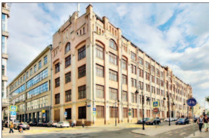
В типографии Ивана Сытина на Пятницкой улице в центре Москвы работали Лев Толстой, Сергей Есенин, Максим Горький и Владимир Маяковский

В 1887 году - к 50-летию со дня смерти Александра Пушкина, Иван Дмитриевич издал 900-страничный том славного поэта невиданным по тем временам огромным тиражом - в один миллион экземпляров, и книга разошлась! Вслед за внушительным фолиантом Пушкина Сытин выпустил такой же объемистый том произведений Николая Гоголя - и тоже