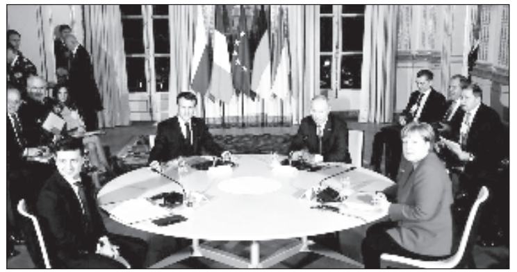
Последние переговоры лидеров четырех стран в "нормандском формате" состоялись в Париже 9 декабря 2019 года

Территориальный конфликт в Донбассе длится более шести лет. В апреле 2014 года власти Украины начали силовую операцию против Донецкой и Луганской народных республик, провозгласивших независимость от Киева после смены власти в стране. В 2015 году были подписаны Минские соглашения, которые подразумевают предоставление региону особого статуса и проведение местных выборов.