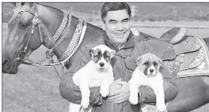
Президент Туркмении написал и книгу об алабаях

По его словам, причина стагнации в культурной сфере страны - плохая организация работы детских школ искусств и художественных заведений. Он поручил министру пересмотреть все учебные планы и составить новые. "Мы отпраздновали 25-летний юбилей постоянного нейтралитета нашего государства, однако не было организовано каких-либо заметных культурных меро-