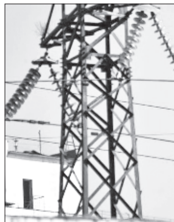
В центральных регионах Украины возник острый дефицит электроэнергии

Телеканал также отмечает, что 2-3 февраля из-за аварий были остановлены украинские Запорожская и Кураховская ТЭС, в связи с чем в центральных регионах Украины возник ощу-