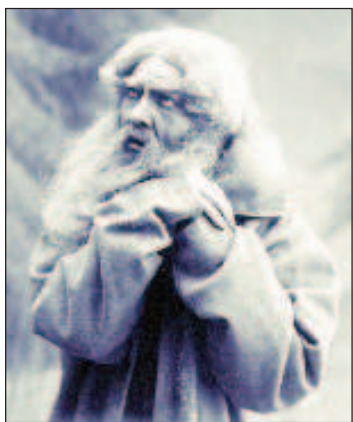
Шаляпин в роли Сусанина в опере Глинки

Почему же легенда об Иване Сусанине оказалась необходимой? Дело не только в том, что сельский староста стал образцом жертвенной, самозабвенной преданности государю. Яркий (хотя и загадочный) эпи-