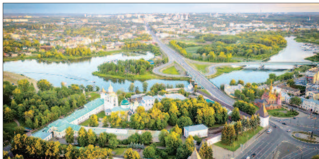
"Флоренцией русского севера" называют Ярославль искусствоведы за яркое смешение архитектурных стилей и направлений. Туристы со всего мира приезжают сюда любоваться храмами и монастырями - шедеврами и зодчества XVII века - "золотого века" Ярославля. Уникальными по красоте считаются церкви Ильи Пророка и Иоанна Предтечи, Волжская набережная с ее великолепными беседками. Широкую известность и мировое признание получила ярославская школа иконописи, монументальной росписи и изразечного дела. В 2005 году исторический центр города Ярославля включен в Список всемирного наследия ЮНЕСКО. Ежегодно регион посещают более миллиона туристов. В 2010 году Ярославль отметил свое 1000-летие

Регион - субъект Российской Федерации, расположен в центре европейской части России, в центре Восточно-Европейской равнины. Административный центр - город Ярославль - основан в 1010 году князем Ярославом Мудрым. Численность населения области по данным Росстата составляет 1 194 535 чел. (2023). Область занимает 61-е место по территории и 39-е - по количеству жителей.