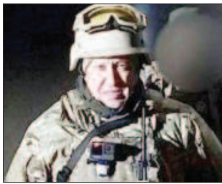
Пригожин: "Юридически Артемовск взят"

В центре бои шли вдоль улиц Независимости, Василия Першина, Благовещенская и Бахмутская, на севере - вдоль улиц Александры Кол-