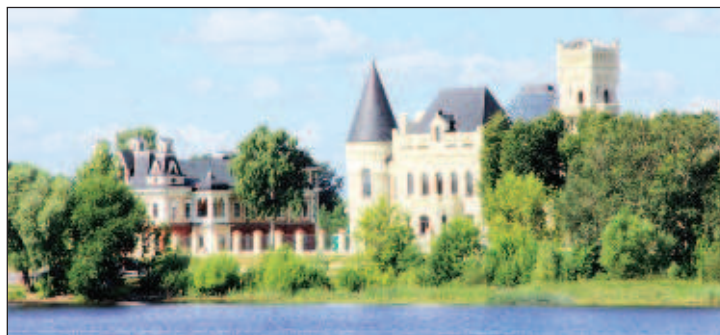
Замок Пониозовкина - недалеко от Вятского. В поселке Красный Профинтерн раньше была большая крахмало-паточная мануфактура, принадлежавшая Никите Пониозовкину. Он был выходцем из крестьян и сам сделал себе состояние. Заодно построил небольшой замок на берегу Волги рядом со своим заводом. Очень долгое время замок был в руинах, сейчас его отреставрировали

Городище Усть-Шексна. В конце XX века начались раскопки на правом берегу Шексны, в месте, где она впадает в Волгу. Археологи с удивлением обнаружили,