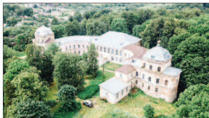
Усадьба Смоленское находится недалеко от Переславля-Залесского. Сейчас там находится школа, а ведь раньше это была самая большая усадьба Ярославской области. Строительство началось во XVIII веке по заказу генерала Петра Сергеевича Свинына. Огромный дворец, своей формой напоминающий подкову, расположился на вершине холма, а рядом был разбит прекрасный парк с прудом. На пруду - островок в форме сердца и перекинутый на него кованый мостик, который и сейчас является изюминкой этого места

в Великим. Примечательный факт: местные крестьяне настолько хорошо зарабатывали на продаже дичи, рыбы, ягод и трав, что могли позволить себе строить каменные дома. Местные жители даже организовали строительство большой колокольни, "скинув" свои деньги, а недостающую сумму попросили взаймы у графа Орлова. Строение получилось высотой 93,7 метра! Для сравнения: храм Христа Спасителя в Москве имеет высоту около 100 метров, Петропавловский собор в Санкт-Петербурге - 122 мет-