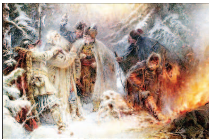
Поляки пытали и казнили Ивана Сусанина

Обратим внимание: Сусанин назван не Ивашкой, а Иваном - с почтением. А его зять - Богдашкой. В те годы самодержцы редко оказы-