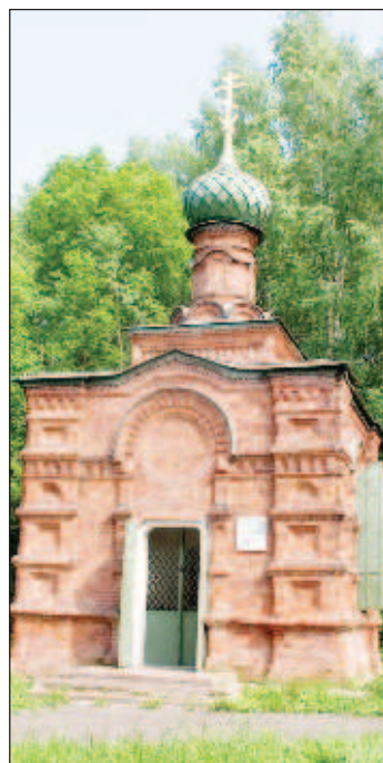
Часовня установлена на месте бывшей деревни Деревеньки, где по преданию стоял дом Ивана Сусанина

Сегодня нам известно, что воцарение Романова в конце концов завершило трагический период Смуты. Но для живших тогда россиян новый царь был одним из многих, успевших промелькнуть за считанные годы кровавых событий на троне. И все-таки Иван Сусанин предпочел умереть, нежели помочь злейшим врагам своей Родины, полякам, тем самым, в значительной мере поспособствовал наступлению страстно ожидаемой миллионами простых людей политической стабильности.