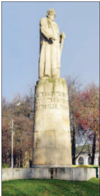
Памятник Сусанину в Костроме

Более известна другая трактовка событий. Неподалеку от Домнина поляки встретили сельского старосту Ивана Сусанина и приказали ему показать дорогу до села. Сусанин успел послать в Домнино своего зятя - Богдана Сабина - с указанием следовать по дороге до села. Сусанин успел послать в Домнино своего зятя - Богдана Сабина - с указанием следовать по дороге до села. Сусанин успел послать в Домнино своего зятя - Богдана Сабина - с указанием следовать по дороге до села.