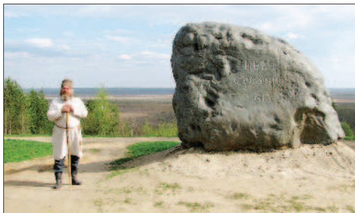
Камень Сусанина - популярное место в Костромской области. Огромный булыжник появился в честь 375-летия его подвига

Подвиг Сусанина предотвратил разграбление монастыря и пленение будущего царя. Царь, поклонившись мощам преподобного Макария, решил наградить родственников павшего героя. Тогда-то и составил государь жалованную грамоту зятю