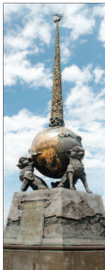
Обелиск "Центр Азии" - часть архитектурно-скульптурного комплекса, в его оформлении использованы мотивы искусства древних кочевников территории Урянхия - Танну-Тувы - скифов, хунну и тюрков

нию государств. Началась Великая Отечественная война. Уже в первой половине дня 22 июня 1941 года Тувинское правительство выразило протест, но объявила войну Германии, став первой официальной союзницей СССР. Всё население республики в тот момент составляло 90 тысяч человек. Существует легенда, что Гитлер не отреагировал на этот вызов, так как не смог найти нового врага на карте мира. На уничтожение врага Тува передала СССР весь свой золотой запас, а это более 30 млн рублей. Промышленность республики стала на военные рельсы: на лесозаводе освоили производство лыж, а кожевенное предприятие увеличило выпуск полушуб-