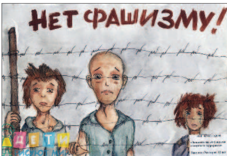
"Защитите нас от фашизма и мирового терроризма". Рисунок Виктории Вакулиной, 12 лет, ЛНР

Нацистской свастикой, или кельтским крестом, который также стал символом нацизма, были помечены практически все страны Европы: от Норвегии на севере, где управляла плечи фашистская