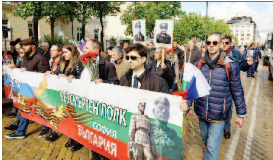
София. 9 мая 2023 года

О проведении "Бессмертного полка" в Софии российские СМИ сооб-