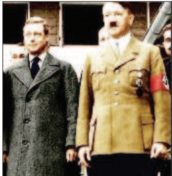
Британский король Эдуард VIII с Гитлером

От Британии на западе, где заметным в мировом масштабе явлением политической жизни явился основатель Британского союза фашистов Освальд Мосли, идеям которого симпатизировали даже члены королевской семьи. До "лидера венгерской нации"