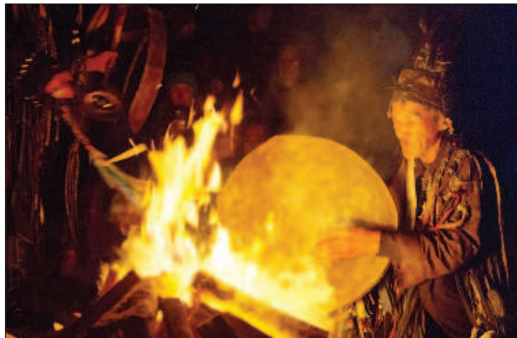
Шаман - очень важный человек в Туве. К нему ходят, если нужно поправить здоровье, найти потерянную вещь, узнать прошлое и будущее, пообщаться с умершими родственниками и даже заказать погоду на определённый день

Тувинцы разработали свои законы, за два десятилетия независимости Тувинская Народная Республика поменяла шесть конституций. И это несмотря на то, что тувинскую письменность изобрели только в 1930 году! Столицу - Хем-Белдыр - переименовали в Кызыл ("Красный"). Несмотря на то, что Тува не была административно частью Советского Союза, однако зависела от него целиком и полностью. Дело шло к объеди-