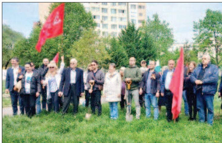
Участники акции "Сад памяти" в Софии

В софийском районе "Дружба", прошла международная акция "Сад памяти". В парке у Школы №108 высажены десятки саженцев деревьев. Инициатива состоялась в День храбрости и болгарской армии и в канун 78-й годовщины Победы в Великой Отечественной войне. Цель акции, превратившейся из общероссийской в международную, - высадить 27 миллионов деревьев в память о каждом погибшем в борьбе против "коричневой чумы". В ней приняли участие: представители дипломатических миссий России, Кубы, Федерация "Союз соотечественников", Молодежная организация "Союз соотечественников", руководители Союза болгарских журналистов, молодежного крыла Болгарского антифашистского союза, сотрудники представительства Россотрудничества, других общественных организаций и жители микрорайона.