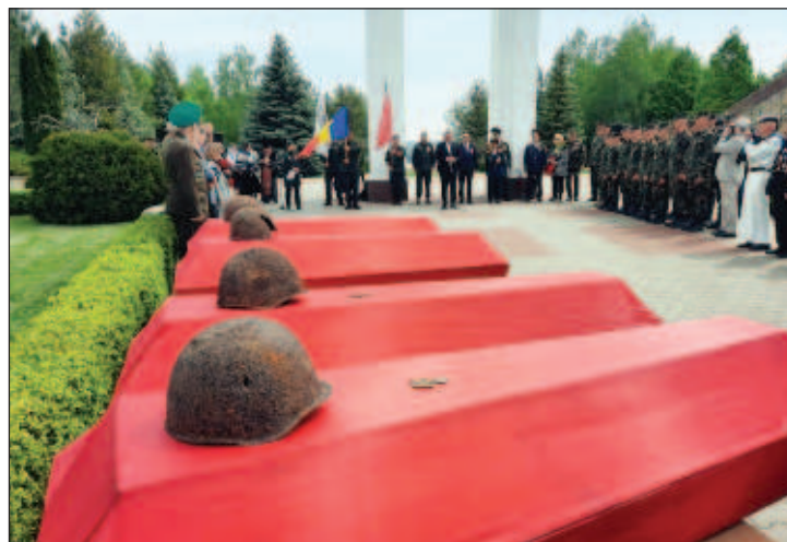
Восстановили воинский памятник в селе Кондратешты Унгенского района

Гуцул сообщил, что почти за 30-летнее существование организации "Вече" было ре-