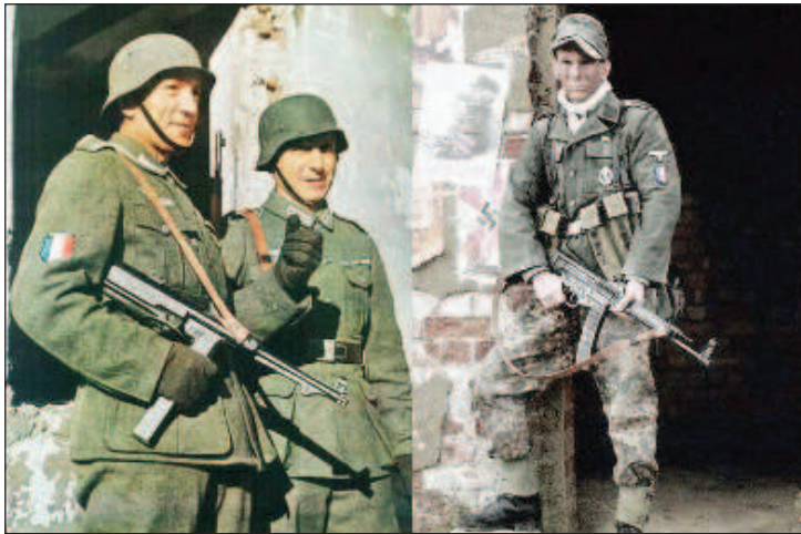
Бойцы французской дивизии СС "Charlemagne", которая до последнего дня защищала Рейхстаг

Лагеря с жестким режимом содержания и скудной кормежкой, отчего в них наблюдался крайне высокий уровень смертности заключенных, были сугубо американским изобретением времен Гражданской войны 1861 - 1865 годов. Самыми ужасными из них считаются Андерсонвилль в Джорджии и "Дуглас" близ Чикаго, где