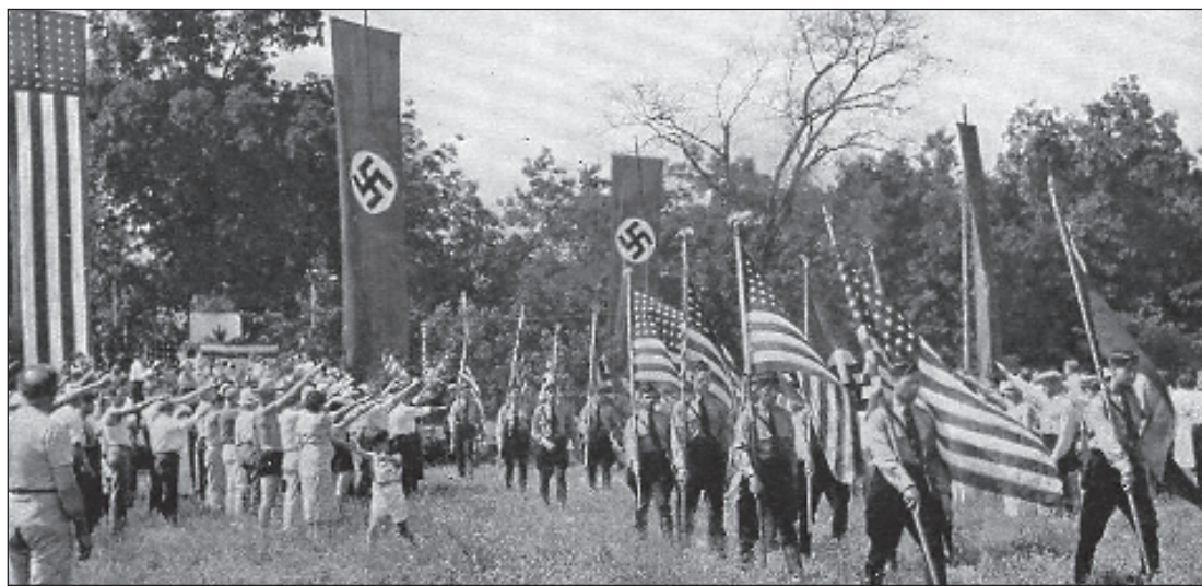
Парад нацистов в Нью-Йорке, толпа их встречает с гитлеристским приветствием "Sieg Heil"

Запад рукоплескал приходу к власти Гитлера, ставшего воплощением его мечтаний устройства общества, которые страны, рядящиеся в тоги режимов "демократических", "либеральных" и так далее, по тем или иным причинам не могли у себя внедрить. Стоит ли