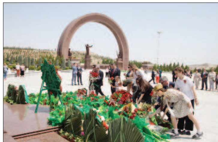
Сотрудники российского посольства возложили цветы к Вечному огню на мемориале "Народная память" в Ашхабаде

"От имени посольства РФ поздравляю вас всех с этим великим праздником, с Днем Победы. <...> Эта акция - благодарность тем, кто сейчас живет, тем ветеранам, кто сейчас в строю, тем труженикам тыла, которые сейчас вместе с нами. Они сейчас находятся здесь, на этой площади, огромное им спасибо. Также хотел бы выразить благодарность руководству страны, президенту Туркменистана Сердару Гурбангулыевичу Бердымухамедову за то, что память о нашем общем подвиге, о наших предках, историческая память в этой стране сохраняется", - сказал на открытии акции советник посоль-