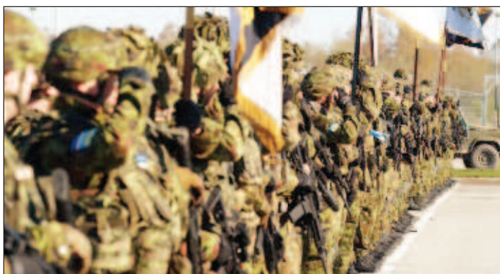
Эстония хочет почти в два раза увеличить личный состав армии в случае объявления мобилизации

Военное ведомство подчеркнуло, что объявление мобилизации необходимо для доведения численности личного состава до этой границы. В соответствии с решением правительства в состав армии могут включить, помимо Сил обороны численностью 6,4 тысячи человек, членов военизированного ополчения Кайт-