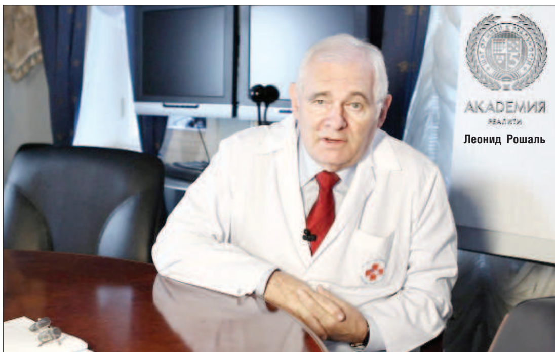
АКАДЕМИЯ РЕАКТИВНОЙ МЕДИЦИНЫ ЛЕОНИД РОШАЛЬ