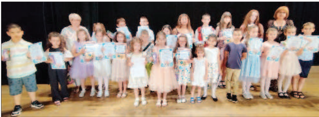
Участники заключительного концерта школы русского языка и школы игры на синтезаторе, пения и музыки

В июне подготовили видео клипы учеников двух школ для конкурса "Пусть всегда будет солнце". Надеемся результаты будут очень хорошие. Началось лето, пора отпусков и каникул. Но группа будет подолжать свои репетиции. Ведь осенью предстоят новые конкурсы и необходимо хорошо к ним подготовиться. Да и предстоят еще совместные поездки, ведь мы как одна семья! Посещение г. Котел с его замечательным фестивалем ковров, а так же с. Минеральные бани. Отдых в Турции. Планы намечены, желание работать сохранилось! Главное всем здоровья!