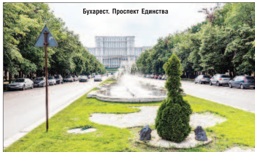
Бухарест. Проспект Единства

Как сообщил "Русский мир", Бухарест объявил о высылке российских дипломатов из Румынии. Послу России 8 июня заявили, что страну должны будут покинуть более 50-и человек. Среди них 21 дипломат и 30 представителей технического персонала. Они должны уехать из Румынии не позднее чем через месяц.