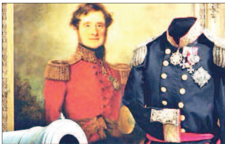
Лорд Реглан, командующий английскими силами в Крыму