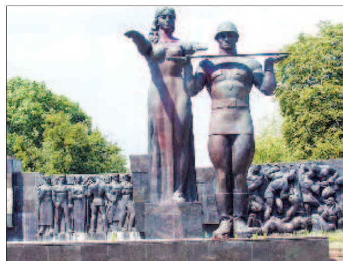
На Украине объявлена война советским памятникам. Монумент воинской славы во Львове давно разрушен

В Львовской области до конца года намерены демонтировать все памятники советской эпохи, сообщил глава областной военной администрации Максим Козицкий в своем Telegram.