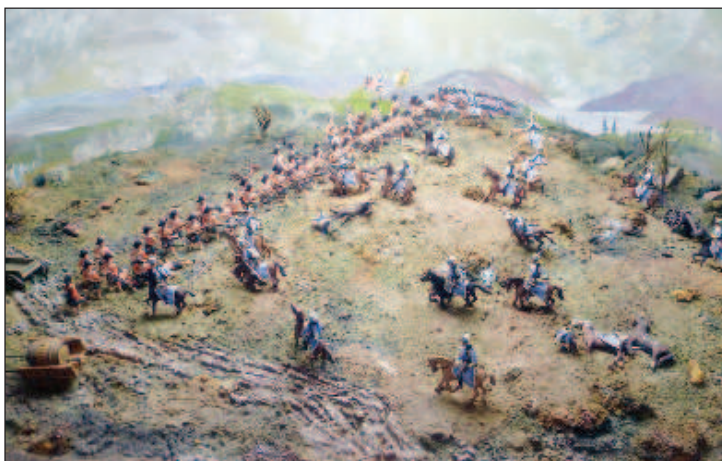
Тонкая красная линия шотландцев

Прибыв к месту боя, когда уже наступило затишье, командующий, указав рукой на русских солдат, увозивших пушки с захваченных редутов, приказал - орудия отбить во что бы то ни стало. Приказ атаковать пози-