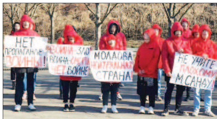
Перед посольством Украины в Кишиневе прошел антивоенный пикет

"Либо мы будем нейтральными, либо будем разорваны на куски. Страна очень маленькая, часть может уйти в Румынию, часть еще куда-то", - добавил Додон.