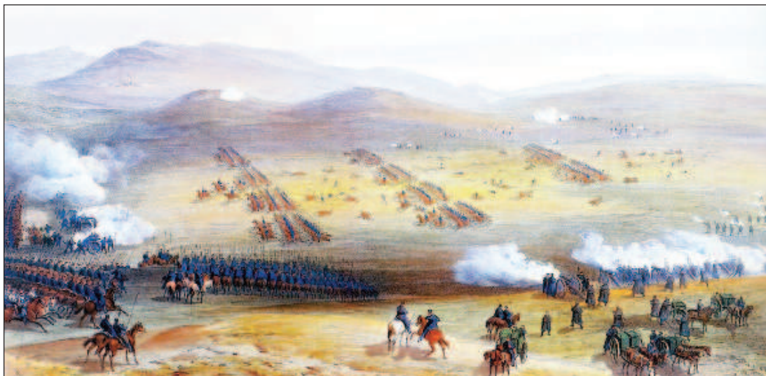
Легкая английская кавалерия лорда Кардигана

Ярким примером этого является Балаклавское сражение, обогатившее английскую