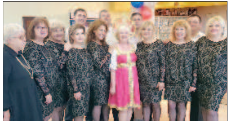
Празднование 9-го мая в г. Елхово

В этом году наша группа, впервые, совместно с вокальной группой "Виолина" при Доме культуры "Пробуда" приняла участие в Национа-