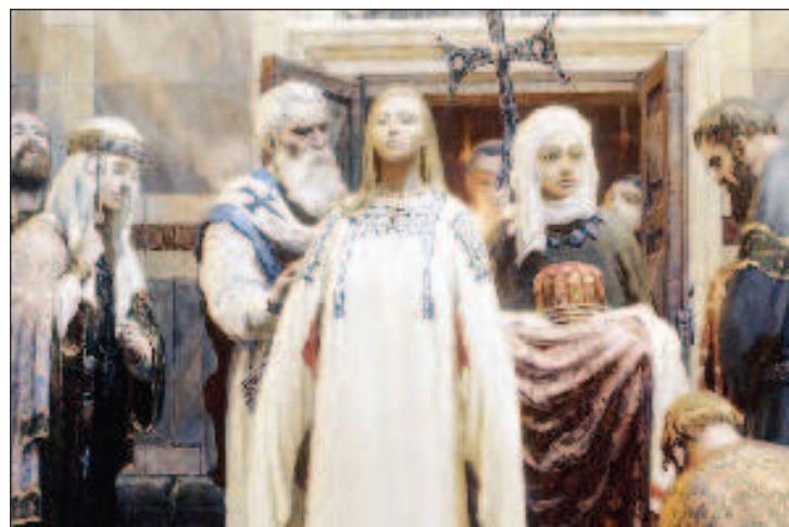
Крещение княгини Ольги - во святом крещении Елена