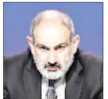
Премьер-министр Армении Никол Пашинян

Ранее министр иностранных дел Армении Арарат Мирзоян заявил, что страна не намерена становиться средой для уклонения от санкций. Он отметил, что война повлияла и на экономику Армении, как положительно, так и отрицательно. Однако это не повлияет на решение руководства страны относительно санкций.