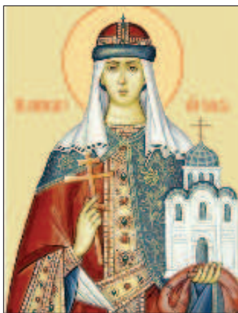
Святая равноапостольная княгиня Ольга

Точно известно, что гибель мужа перевернула жизнь