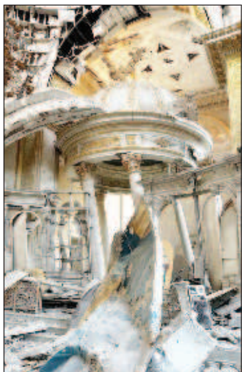
собора. Мужчине оказана медицинская помощь, он госпитализирован.

В результате попадания боеприпаса в богослужебном здании возник пожар. Огонь быстро потушили прибывшие на место спасатели. Пострадал охранник