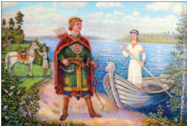
Первая встреча и знакомство князя Игоря с "перевозчицей с челном"

княгини. В 945 году князь Игорь отправился получать дань с племени древлян. Финансовый спор закончился убийством киевского князя. Ольга оказалась вдовой с трехлетним сыном на руках. С точки зрения законов того времени, она имела право остаться правительницей, если не имела намерений вновь выйти замуж. Но для этого Ольге необходимо было доказать киевской дружине, что она способна эффективно руководить. Княгине это удалось в полной мере. Мы можем только гадать, насколько сильно Ольга любила погибшего мужа. Возможно, то, что произошло дальше, связано с ее глубоким чувством к Игорю. А возможно, глава Киева посчитала, что не имеет права оставлять безнаказанной гибель своего предшественника.