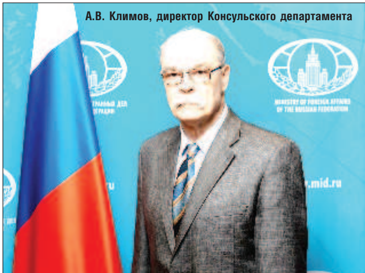
А.В. Климов, директор Консульского департамента

- Единую электронную визу могут получить только граждане иностранных государств, перечень которых утвержден распоряжением