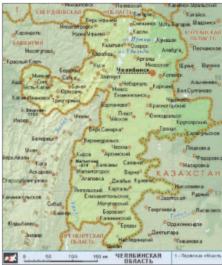
Если посмотреть на карту Челябинской области, удивляет причудливая форма её границ. На запад, на территорию Башкирии, выступает большой "полуостров". Он охватывает территории бывших горных заводов

Человек на территории Челябинской области появился давно. Здесь найдены многочисленные археологические памятники, самые старые из которых относятся к палеолиту (примерно 70-80 тысяч лет назад). Примерно 4 тысячи лет назад в южные районы пришли индоиранские племена, основавшие Аркаим и другие поселения так называемой "Страны городов". В эпоху раннего железного века жители степей занимались кочевым скотоводством, а жители лесов жили охотой и рыбалкой. На севере возникли городища Иткульской культуры, действовали металлургические комплексы. С середины I тыс. н.э. на Южный Урал пришли тюрки. Перед приходом русских здесь жили преимущественно башкиры. С тех времён на карте сохранились многочисленные башкирские названия. Эти территории раньше входили в состав Ногайской Орды, Казанского и Сибирского ханств. После их