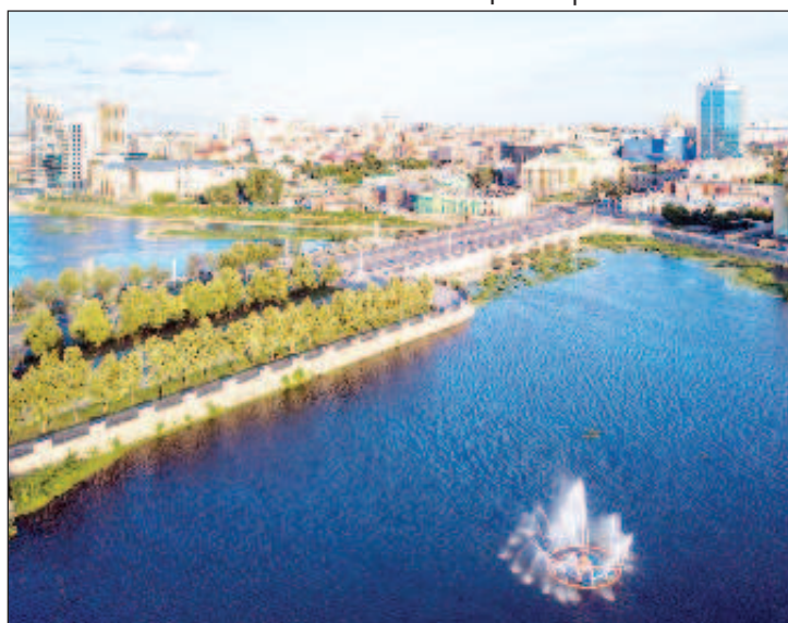
Челябинск - город между Европой и Сибирью. По количеству жителей занимает седьмое место среди российских городов-миллионников. Находится в центре Евразии, на восточном склоне Уральских гор, на расстоянии 1 879 км от Москвы. Интересный факт: с геологической точки зрения одна половина Челябинска находится в Сибири, так как эта часть города расположена в зоне осадочных пород, а вторая половина стоит на граните, характерном для Урала. Разграничивает их река Миасс, а соединяет - Ленинградский мост, по нему жители города могут несколько раз в день попасть из Сибири на Урал и обратно

На берегу реки Сим близ города Миньяра расположено настоящее чудо природы - пульсирующий карстовый источник Ералашный или Пропаший ключ. Зимой стоит заехать к замерзающему и превращающемуся в гигантскую сосульку Зюраткульскому фонтану. На территории области встречаются пещеры, гроты, провалы, арки и прочие формы карстового рельефа.