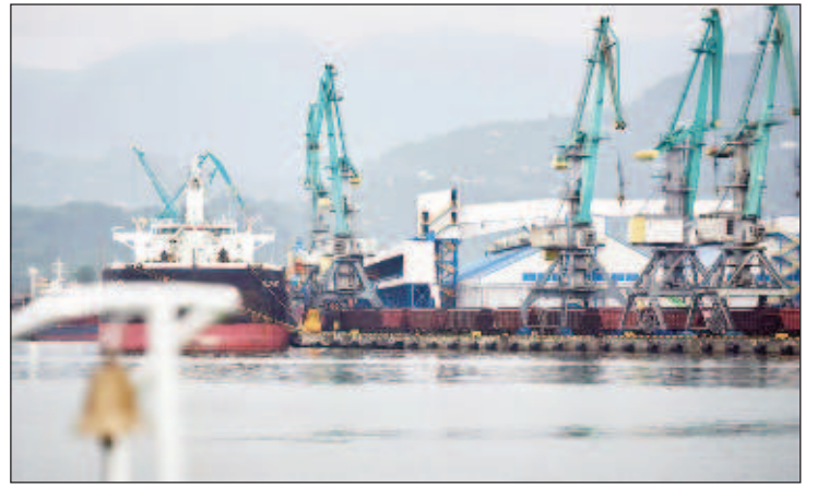
Батумский грузовой порт

Переход Батуми-Новороссийск занимает примерно от 18 до 22 часов. При необходимости судно может идти быстрее (не экономя топливо) или медленнее, разница составит от двух до