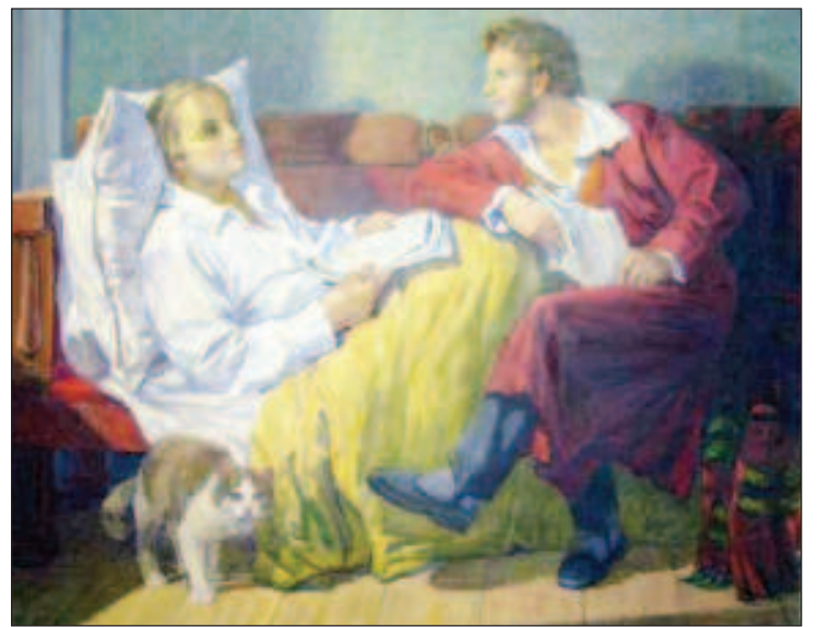
Пушкин у постели больного друга

Литературное наследие поэта состоит из 170 стихов. Автор занимался творческими поисками и оказался в числе первых создателей сонетов в