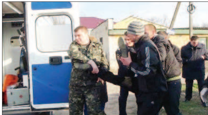
Идет "добровольная" мобилизация

По мнению собеседника агентства, от подобных решений украинских властей