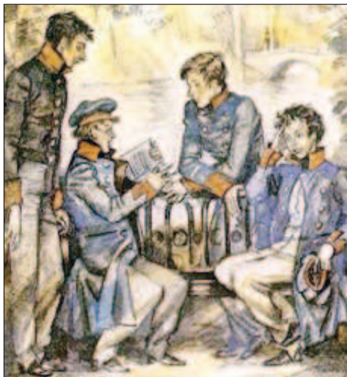
Дельвиг и Пушкин с друзьями в лицее

Антон Дельвиг не оставил огромного литературного наследия, но его стих "Соловей", музыку к которому сочинил Александр Александрович Алябьев, считается классическим произведением. Его исполняют лучшие российские и мировые вокалисты. Дельвиг был известен как литературный деятель, поэт и издатель. В 1819 г. с друзьями-