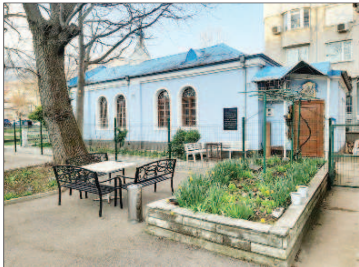
Храм св. Пантелеимона в Софии

- После событий сентября 1944 года Союз русских инвалидов был запрещён, как и многие другие эмигрантские организации. Дом русских инвалидов в Княжево, который к тому времени уже представлял собой довольно внушительное сооружение, занимающее большую площадь, был конфискован и национализирован вместе со зданием храма. Такое правовое положение нашего храма сохраняется до сегодняш-