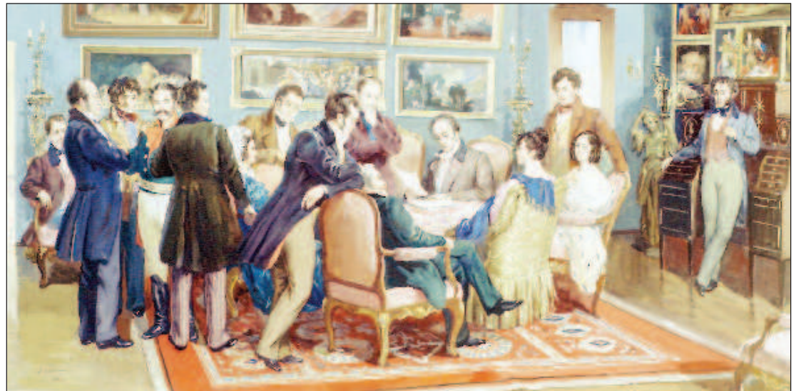
Дельвиг и Пушкин часто вместе проводили вечера в литературных салонах

Главным детищем поэта оказалась "Литературная газета". Основав ее в 1830 г. при поддержке Александра Пушкина и Петра Вяземского, Антон выступал в роли критика, противоборствующего с "коммерческой" литературой и необразованной аудиторией. На страницах издания нашлось место произведениям Пушкина и Кюхе-