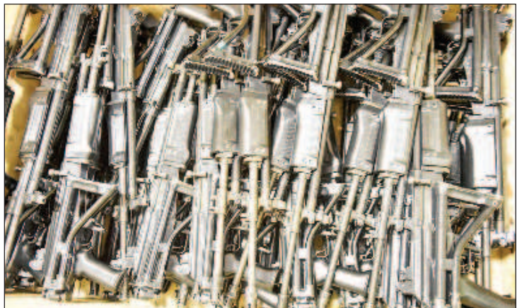
Эстония отправит Украине партию огнестрельного оружия и боеприпасов

"Мы снова нашли возможность помочь Украине. На этот раз Киеву будут отправлены 150 единиц ручного огнестрельного оружия и боеприпасы к нему", - приводит пресс-служба слова главы эстонского оборонного ведомства.