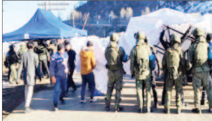
США и Евросоюз призвали Азербайджан разблокировать Лачинский коридор

Ранее премьер-министр Армении Никол Пашинян обвинил Азербайджан в проблемах с доставкой гуманитарной помощи для Карабаха. Он рассказал, что 361 тонна гуманитарной помощи, отправленной в регион, все еще находилась на въезде в Лачинский коридор.