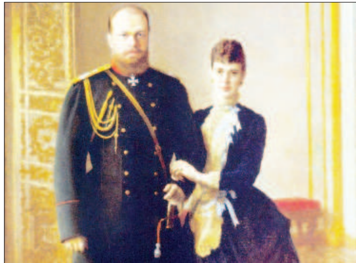
Император Александр III с супругой Марией Федоровной

Оказавшись в изгнании, поначалу Мария Федоровна жила у Кристиана X. Ей выделили небольшой уголок во дворце и минимальное содержание. Через некоторое время бывшая императрица с дочерьми и слугами переехала на небольшую виллу Видор, которую Мария Федоровна купила еще в 1904 году наполовину со старшей сестрой Александрой. Мария Федоровна была императрицей без империи, ее нигде не принимали официально. Не принимал ее в Букингемском дворце даже родной племянник, сын Александры, король Георг V.