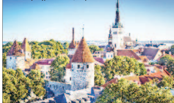
Таллин - культурная столица Европы

мьер-министра, семья которой ведёт бизнес в России, никто увольнять не собирается".