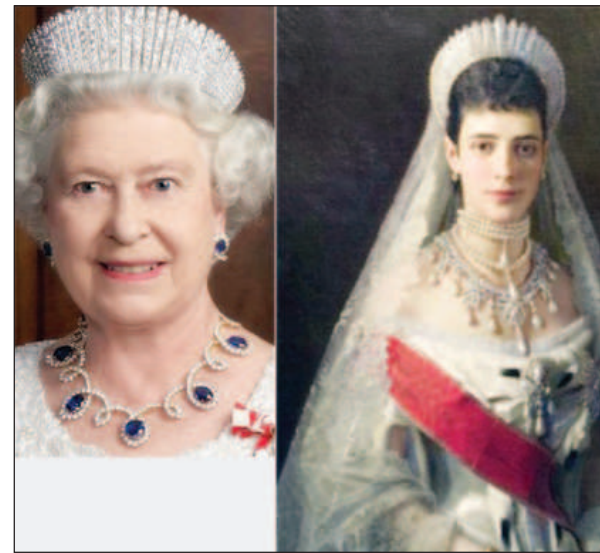
Самое известное приобретение Виндзоров - тиара-кокошник, в котором венчалась Мария Федоровна

вески. Мария Федоровна обожала сапфиры. А Елизавета II - эту брошь.