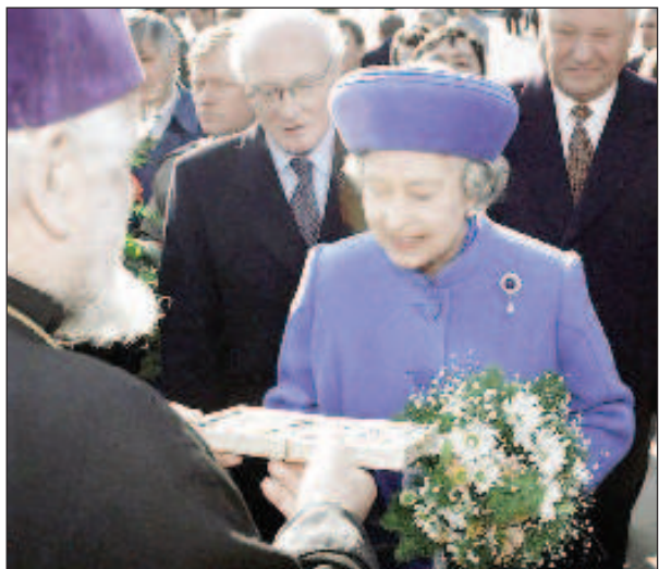
Британская королева Елизавет II на Красной площади в Москве в 1994 г. На ярко-голубом пальто - брошь из личных драгоценностей императрицы Марии Федоровны

Вскоре ларец был вскрыт в присутствии Ксении и членов английской монаршей семьи. Оценку драгоценностей произвела фирма "Хеннел и сыновья". Представитель фирмы предложил под залог императорских сокровищ 100