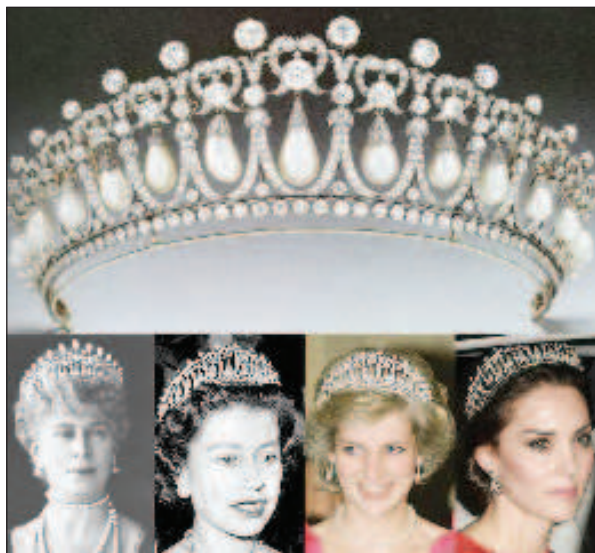
Владимирская тиара с "узелками любви" британские королевские особы носят до сих пор