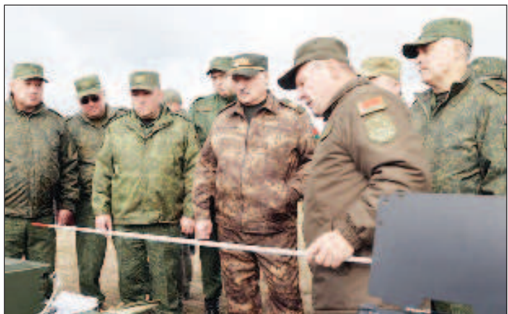
"Маск нам не нужен" - Александру Лукашенко показали аналог Starlink

Белорусский военный создал собственный аналог американской спутниковой системы Starlink, но за очень маленькие деньги. Видео об этом опубликовало государственное агентство "Белта" на своем YouTube-канале.