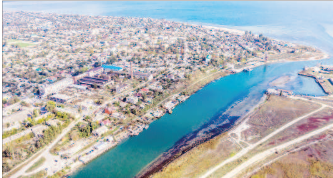
Геническ. Красоту Геническа создали не архитекторы, а сама природа. Кроме морского отдыха, сюда приезжают, чтобы увидеть такие чудеса природы, как озеро Сиваш. Своими целебными свойствами оно очень известно. Соль из озера когда-то везли в Японию и Египет, и использовали в косметологии для лечения кожных заболеваний. Испытать на себе рецепты восточных красавиц можно и сегодня, ведь несколько местных предприятий изготавливают продукцию на основе солей из озера

Остров Бирючий - уникальный кусочек суши, являющийся продолжением Федотовой косы, расположенной между Азовским морем и Утлюкским лиманом. Он соединен с материковой частью узким перешейком шириной не более 10 м. и постепенно достигает размаха