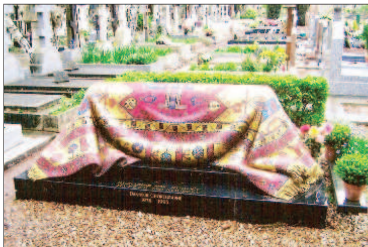
Здесь похоронен выдающийся танцор Рудольф Нуриев

Королевский бастион Смоленска стал знаковым местом в истории франко-русского сотрудничества - в июле 2019 г. отечественные археологи вместе с французскими коллегами там обнаружили останки Гюдена. Во время Отечественной войны 1812 г. Гюден командовал дивизией в составе корпуса маршала Даву, однако получил смертельное ранение под Смоленском. В битве при Валутиной горе генерал лишился левой ноги и через