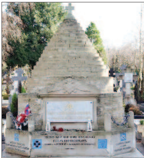
Могила генерала Корнилова с надписью "всем корниловцам павшим за Родину и на чужбине скончавшимся"