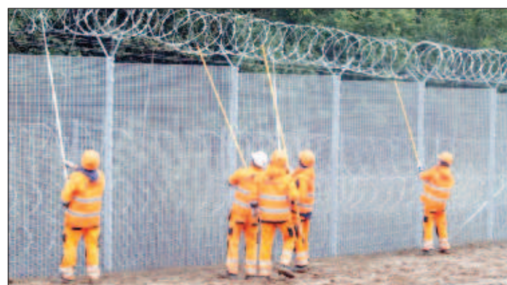
В Латвии разворовали деньги на строительство забора с Белоруссией

вать 24 апреля в Рижском городском суде.