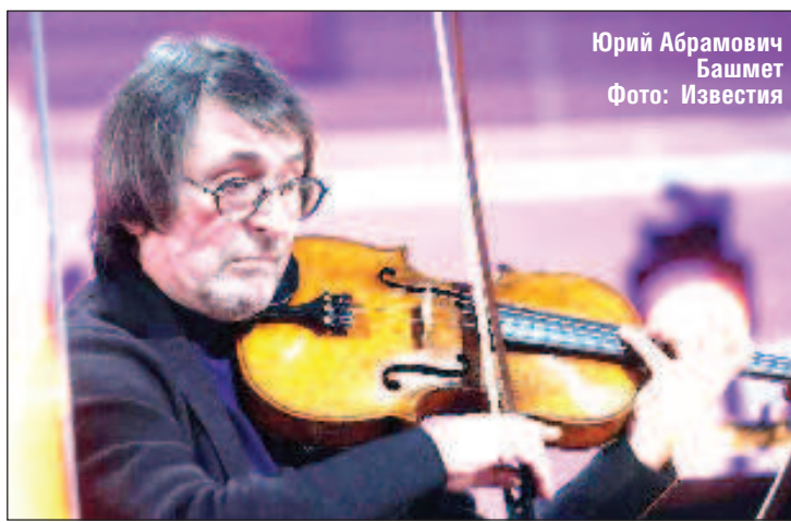
Юрий Абрамович Башмет

Концерт, который напоминал музыкальные иллюстрации к автобиографии маэстро, получился весьма трогательным. Виртуальный Башмет делился с публикой откровениями - о том, как увлекся творчеством The Beatles и сам играл на гитаре, как благодаря настойчивости матери поступил в Московскую консерваторию, и даже о том, как забыл вступить в оркестре, засмотревшись на руки Мстислава Ростроповича. История жизненного и творческого пути музыканта складывалась на глазах, шаг за шагом, но