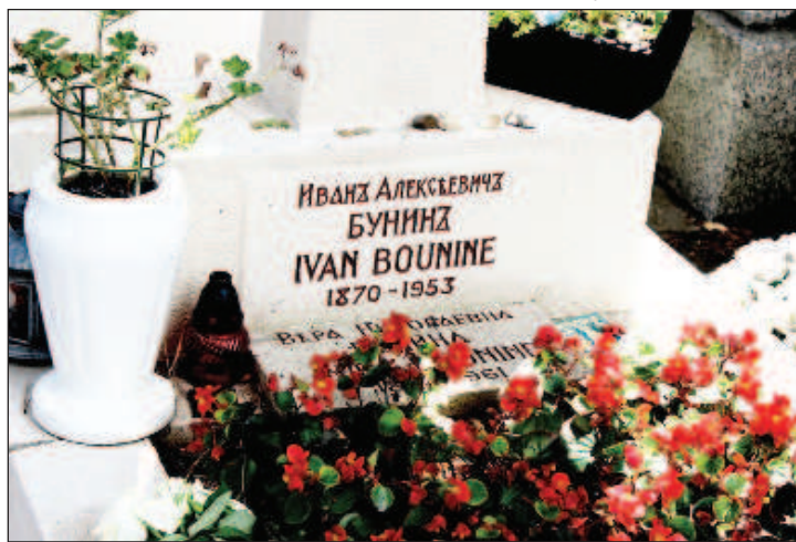
Могила писателя Ивана Бунина

ция была повторена: во французское государственное казначейство на счет города Сент-Женевьев-де-Буа поступило около 610 000 евро, что позволило возобновить истекшие концессии еще на 480 участков "русского каре". С тех пор по соглашению с мэрией на эти нужды ежегодно переводились сотни тысяч евро. Считается, что от России мэрии получено свыше двух миллионов евро. Москва была готова продолжить перевод необходимых сумм, а они согласовывались заранее, на счет властей Сент-Женевьев-де-Буа. Но внезапно возникла непреодолимая проблема - французская сторона отказалась при-