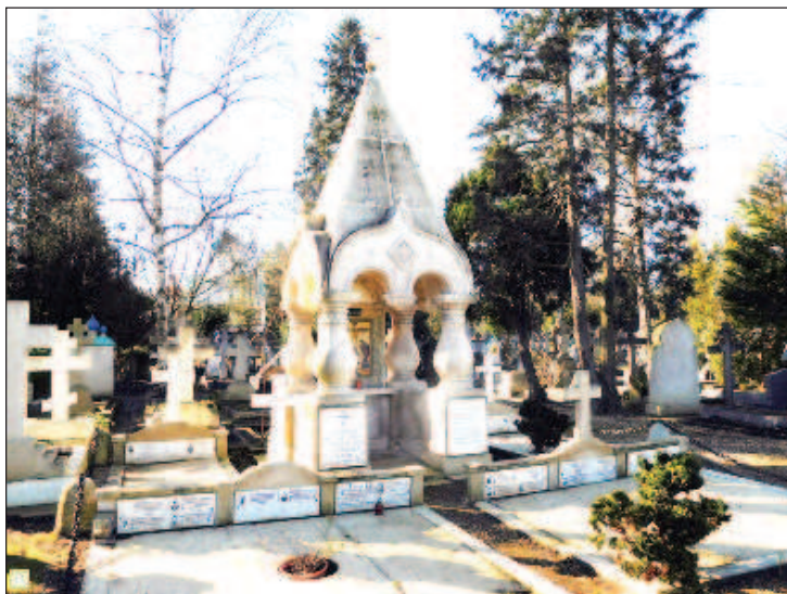
Часовня на русском кладбище в Сент-Женевьев-де-Буа

Так, в 2008 г. на эти цели было выделено 692 000 евро. Спустя шесть лет опера-