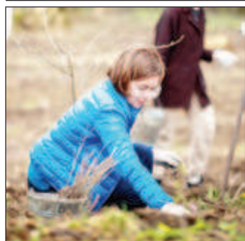
Президент Молдавии дала личный пример