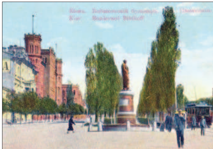
Памятник Алексею Бобринскому в Киеве, который был разрушен

И Бобринский загорелся идеей сделать "сладкую жизнь" доступной каждому.