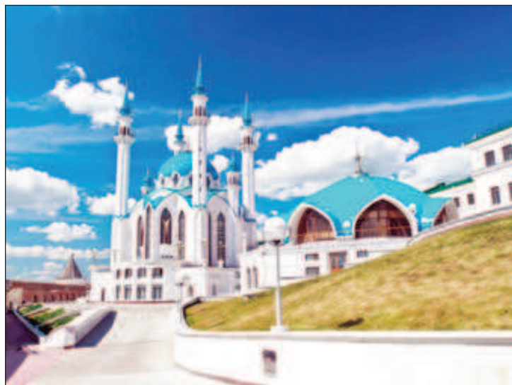
Мусульманские мечети Казани - это невероятные сооружения, посещение которых станет изюминкой любого путешествия. Великолепные минареты, пышное убранство, особая аура - все это присуще этим культовым местам. Однако и на таком фоне мечеть в Казани "Кул-Шариф" даже на фото поражает своей грациозностью и великолепием

В 1556 году началось строительство нового, белокаменного Кремля, в опустевший город (татарам было запрещено селиться ближе 30 вёрст от города) вселили 7 тысяч русских, которых по приказу Ивана Грозного переселяли целыми слободами из разных русских городов, а казанские татары были выселены за стену деревянного посада Казани, за проток Булак, положив,