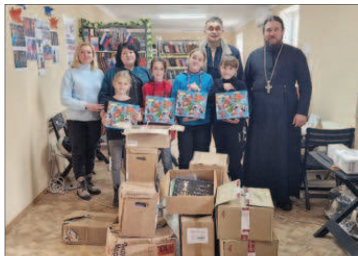
В семейной школе "Покров" при Пермском Успенском женском монастыре изготавливают окопные свечи и шьют полотенца для госпиталей

Среди вещей - предметы первой необходимости, продукты питания, медикаменты, теплые одежды, постельное белье, влажные салфетки, моющие средства, средства гигиены. В оказании благотворительной помощи также принимают участие педагоги общеобразовательных школ и воспитатели детских садов Перми. Не остаются в стороне и уча-