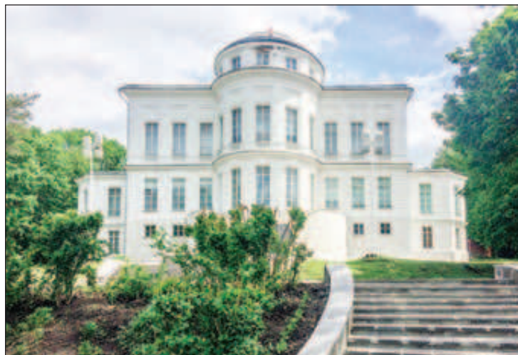
Дворец Бобринских в Богородицке, Тульская область

Сергеевича даже есть строки, в которых, возможно, звучат отголоски тех встреч: "Иду в гостиную; там слышу разговор / О близких выборах, о сахарном заводе..."