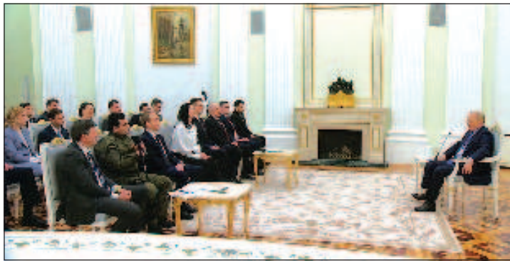
Как сообщает "Русский мир", сто два человека стали победителями суперфинала конкурса "Лидеры России". В том числе представители тридцати одного ре-

Российский лидер поздравил победителей, он добавил, что за пять сезонов конкурса в нём приняли участие более миллиона человек. "Лидеры России" являются самым большим кадровым конкурсом во всём мире, уточнил Владимир Путин.