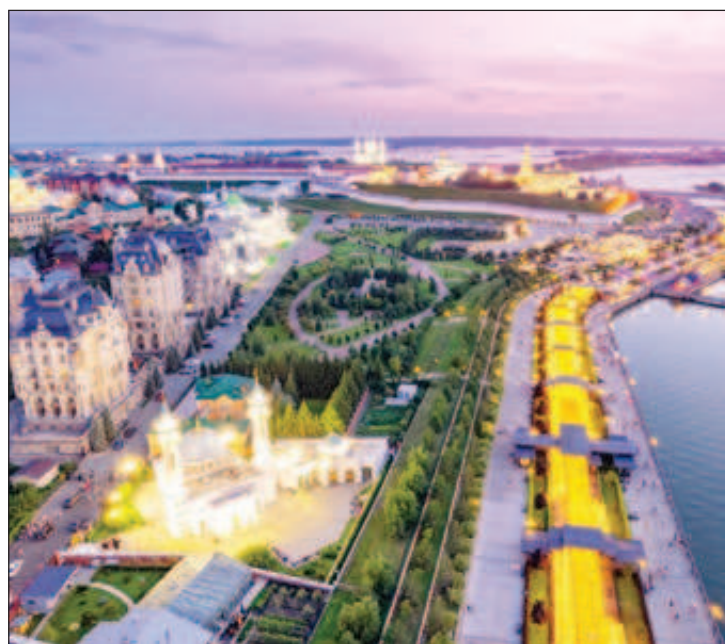
Город Казань имеет зарегистрированный бренд "Третья столица России". В 2005 году было отпраздновано тысячелетие Казани. Город неоднократно принимал международные соревнования высокого уровня по различным видам спорта, в том числе XXVII Всемирную летнюю Универсиаду в 2013 году, а также ряд матчей Чемпионата мира по футболу 2018 года

Сад Эрмитаж известен далеко за пределами Казани. Несмотря на то, что он может похвастаться ухоженностью и живописностью, совсем не его красоты манят путешественников. Интерес последних вызывает множество мистических легенд, появление которых связано с богатой и довольно пугающей историей этого парка.