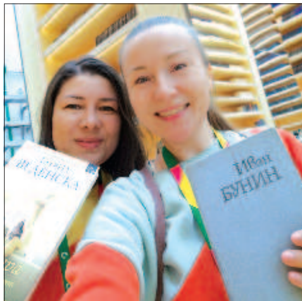
Произведения русских классиков на языке своей страны участники оставили на память в библиотеке "Сириус", созданной на ВМФ

гионов России и презентациями инноваций и изобретений наших ученых в области науки и медицины в технологическом хабе. Под активностями я имею в виду мастер-классы и игры: можно было сделать чебурашку, сплести браслет, раскрасить матрешку, поучаствовать в квизе и т.д. Также на Фестивале в рамках культурной программы мне удалось посетить спектакль, концерт симфонической музыки и, вишенка на торте, Ледо-