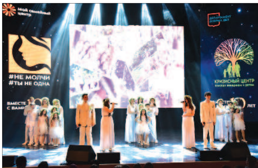
Концертную программу юбилейного мероприятия открыло выступление хора многодетных семей, воспевающих любовь к семье, культуре и жизни

За прошедшие 10 лет Кризисный центр стал опорой более 3 тысячам москвичек, которые решительно шагнули в новую жизнь благодаря помощи специалистов и психологической поддержке. Используя ресурсы, предостав-