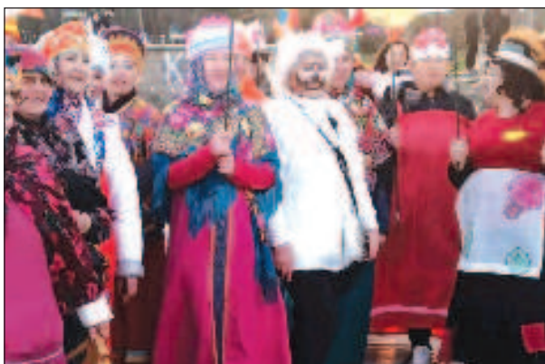
Бургас и море