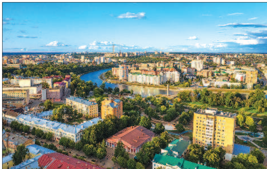
Плодородные земли, расположенные вокруг Орла, привлекали сюда помещиков, поэтому в XIX веке город стал центром дворянской культуры. Орловский край - родина таких писателей, как И. С. Тургенев, М. М. Пришвин, Л. Н. Андреев, А. А. Фет, философа М. М. Бахтина, историка Т. Н. Грановского. В городе из десяти музеев шесть - литературные. Поэтому часто Орёл называют (после Москвы и Петербурга, конечно) литературной столицей России. Очень много туристов хвалит дом-музей Н. С. Лескова. В настоящее время город делится на четыре административных района: Заводской, Советский, Железнодорожный и Северный. Большая часть достопримечательностей находится в самом большом районе Орла - Заводском

Изготовлением чулочно-носочных изделий занимается фабрика ОАО "Гамма". Все металлургическое про-