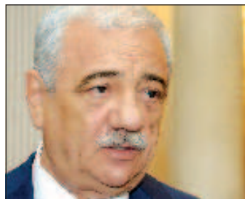
Председатель Конфедерации профсоюзов Азербайджана Саттар Мехбальев

Председатель Конфедерации профсоюзов Азербайджана Саттар Мехбальев отметил, что подобные акции проводятся на