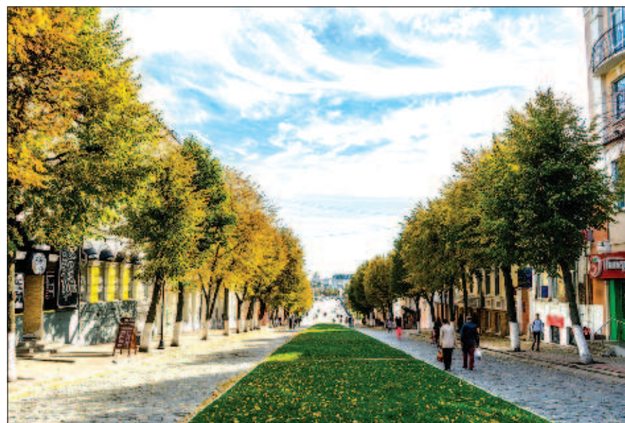
Улица Ленина - центральная пешеходная улица города Орла. Находится в пределах исторического центра города, в Советском районе. За свою продолжительную историю улица сменяла ряд названий. По различным данным, первоначально она была известна как Большая Болховская, Болховская дорога, Большая Дворянская и, несмотря на официальное переименование в феврале 1784 года в Болховскую улицу, вплоть до середины XIX века упоминалась под этими названиями. В 1919 году, при советской власти, она была переименована в честь В. И. Ленина и с тех пор не меняла своего названия. На сегодняшний день улица Ленина представляет собой одну из наиболее оживлённых в городе, где размещены предприятия общепита, магазины различной направленности, государственные административные и культурные учреждения, офисы общественных организаций

изводство лежит на плечах ОАО "Сверсталь-метиз" и его дочерней компании ООО "Орелкорд". Строительными материалами занимаются ЗАО "Велор" и ОАО "Орловский завод силикатного кирпича". "Орёлтехмаш" - завод, выпускающий текстильное оборудование. ЗАО "Протон-Электротекс", ЗАО "Электротекс", ЗАО "ОРЛЭКС" занимаются производством электронного и оптического оборудования. ЗАО "Протон", ЗАО "Протон-Импульс", ЗАО "Научприбор" совместно с Новосибирским институтом ядерной физики Сибирского отделения РАН разрабатывают и производят сложную медицинскую технику и аналитическое оборудование.