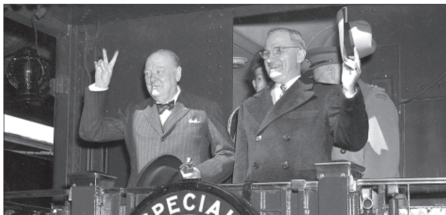
Черчилль в поезде президента США - по пути в Фултон

Тут все тоньше, чем кажется на самом деле. Гитлеровские теории превосходства не имели чисто герман-