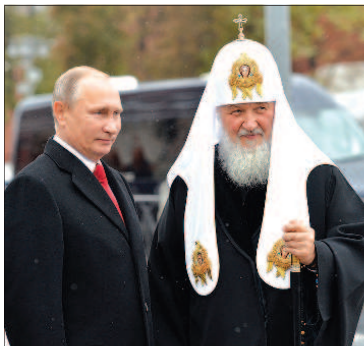
Владимир Путин и Патриарх Кирилл

лись конструктивные отношения, направленные на утверждение в обществе традиционных нравственных ценностей, духовное просвещение и патриотическое воспитание молодежи, сохранение богатого исторического и культурного наследия. Надеюсь, что при Вашей поддержке наше сотрудничество будет развиваться и впредь, принося добрые плоды", - отметил Святейший Патриарх Кирилл и пожелал Главе государства "крепости душевных и телесных сил, щедрой помощи Божией и благословенных успехов в дальнейших трудах на высоком и ответственном посту Президента Российской Федерации".