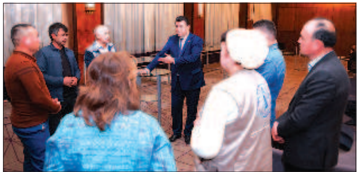
Участники в Форуме кооперативов

Первый Национальный форум кооперативов прошел в Душанбе 12-13 марта при поддержке министерства сельского хозяйства Таджикистана. Как было отмечено в рамках ивента, он направлен на разработку рекомендаций по развитию кооперативов. Об этом сообщили в пресс-службе Продовольственной и сельскохозяйственной организации ООН (ФАО).