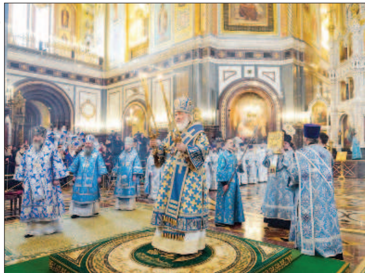
Святейший Патриарх Московский и всея Руси Кирилл

"Вот если бы каждый христианин не только связывал свою церковность с посещением храма, но и осознавал, сколь важно совершать добрые дела, как важно помогать людям, особенно тем, кто находится в трудных обстоятельствах! А таких сейчас очень много. Как много сегодня людей, уязвленных тяжелейшим конфликтом на Донбассе, - не только морально, и физически уязвленных! И здесь, в Москве, лежат раненые воины, еще вчера здоровые молодые люди, полные надежд на будущее, а сегодня - положившие здоровье свое за Родину, за народ свой. Как они нуждаются в нашей помощи и поддержке! Да и по-