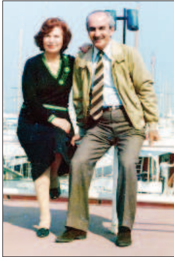
Во время одной из длинных командировок далеко от Родины