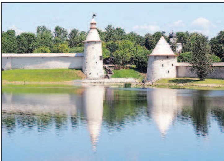
Башни Плоская и Высокая. Плоская башня - северная башня Псковского Кремля. Объект культурного наследия федерального значения. Расположена в месте впадения реки Псковы в реку Великую. Образует ансамбль с находящейся на другом берегу Псковы башней Высокой. С 2021 года открыта для посещения