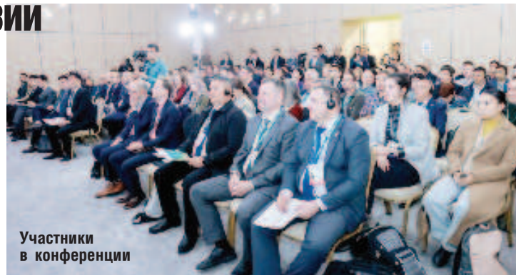
Участники в конференции

Планы МСОП включают создание региональной сети охраняемых природных территорий в рамках проекта, а также принятие мер