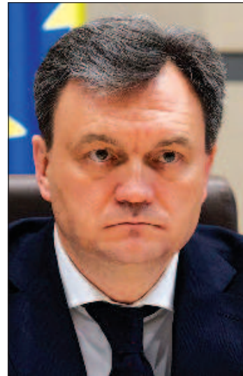
Премьер-министр Молдавии Дорин Речан

Речан указал, что основной приоритет для Молдавии - активное продвижение вступления в Европейский Союз. Премьер-министр выразил надежду на то, что каждый проект, реализуемый в стране, будет отражать поддержку европейского пути развития и будет ощущаться гражданами.