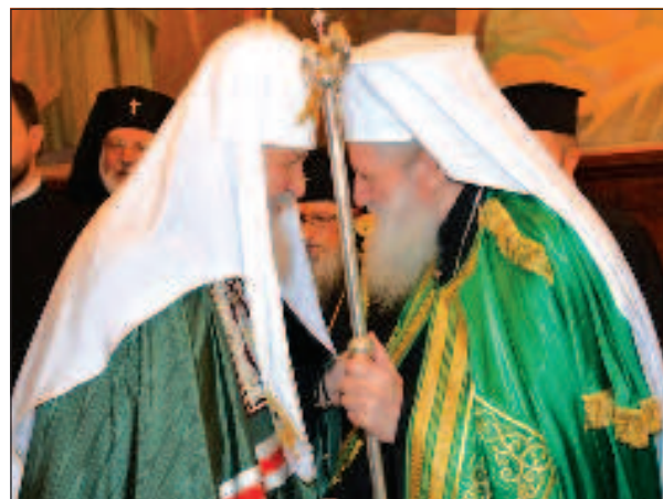
Встреча Патриарха Кирилла с Патриархом Неофитом в Софии, 2020 г.

Также по случаю годовщины интронизации Святейшего Патриарха Болгарского Неофита поздравительное послание направил Председатель Отдела внешних церковных связей Московского Патриархата митрополит Волоколамский Антоний.