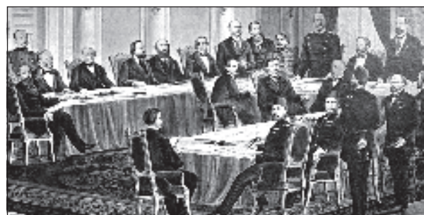
Многие обсуждали судьба Балкан, даже побежденная Турция, но представители самих балканских государств не были приглашены

комиссара. Почти половина болгарского народа осталось за пределами этого княжества. Из другой части Болгарии, расположенной к югу от Балканских гор, создавалась автономная провинция Османской империи под названием Восточная Румелия с христианским генерал-губернатором во главе, назначаемым