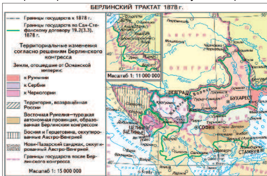
Карта Болгарии и соседних балканских стран по Берлинскому договору

Основные споры шли по поводу границ Болгарии и объеме прав султана в южной части Болгарии, расположенной к югу от Балканских гор. Здесь было решено создать автономную провинцию Османской империи - Восточная Румелия. Выход к Эгейскому морю она не получила. Вскоре после открытия конгресса сведения об англо-русском соглашении попали в печать. Это вызвало скандал. Английское общество упрекало правительство в излишней "уступчивости". Из-за разногласий по поводу судьбы Восточной Румелии, Варны и Софийского санджака Дизраэли даже угрожал покинуть конгресс. В конце концов при посредничестве Бисмарка спорные вопросы были решены: британцы дали согласие на передачу Варны и Софийского санджака Болгарии; русские уступили, дав право султану держать войска в Восточной Румелии.