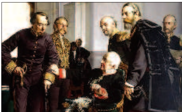
Участники Берлинского конгресса: Князь Горчаков сидит сложа ладонь на руку Дизраэли

Конгресс открылся 13 июня 1878 г. в Берлине. На нем участвовали шесть великих держав и Турция. Представители балканских государств были допущены в Берлин, но не являлись участниками конференции. Делегации великих держав представляли Бисмарк, Горчаков, Биконсфильд, Андраши, Ваддингтон и Корти (Германия, Россия, Англия, Австро-Венгрия, Франция и Италия). Положение русской делегации было