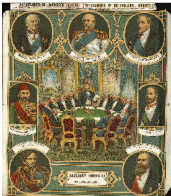
Заседание конгресса: на портретах в медалонах представители великих держав

войне с Турцией привела к воссозданию болгарской государственности. В этой области Россия сделала много. В стране были созданы Гражданское управление, органы суда, введена конституция. Ее проект был разработан в Петербурге специально созданным Особым совещанием. Тырновская конституция 1879 г.